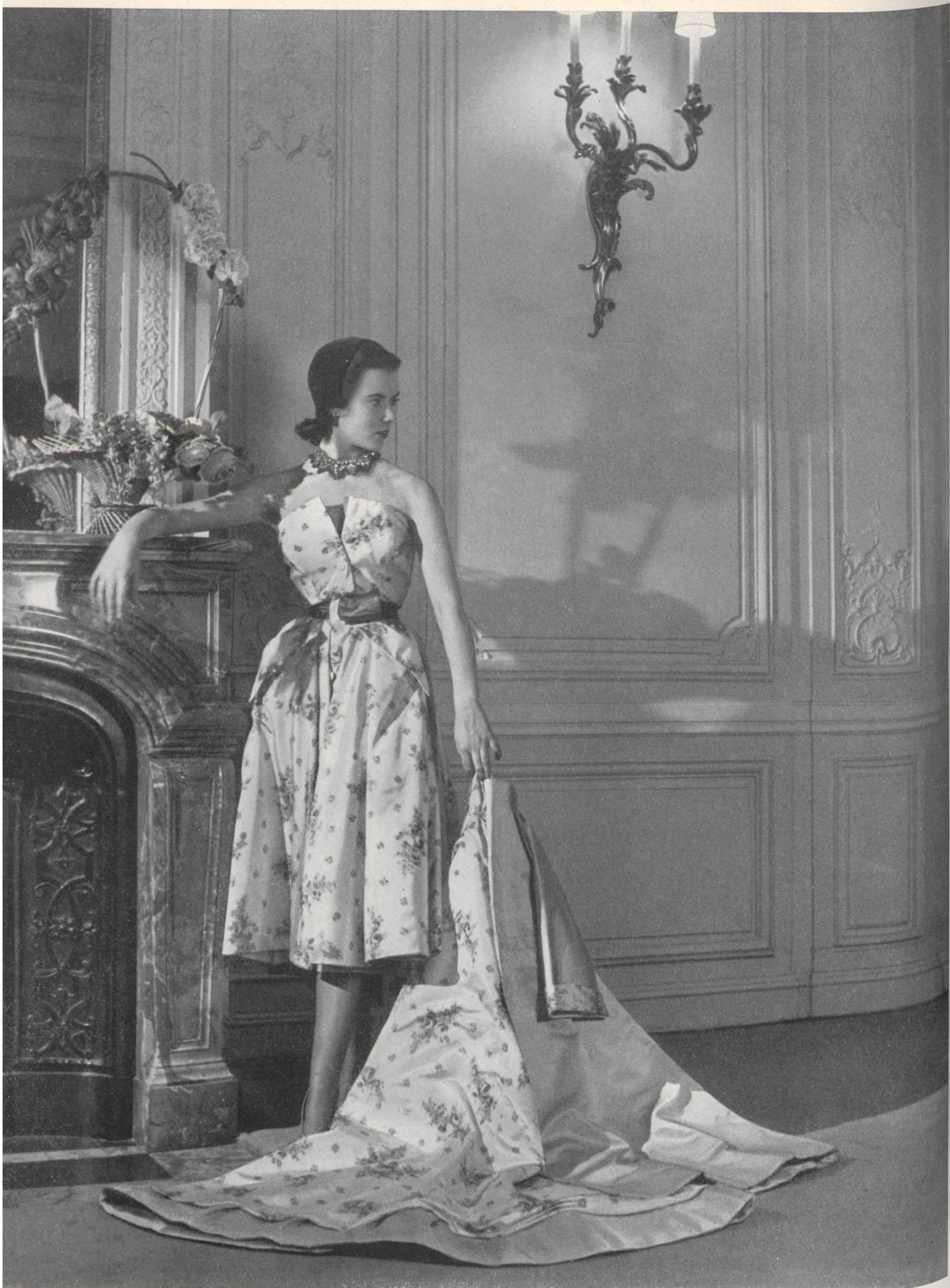
CHRISTIAN DIOR L. Abraham & Cie, Soieries S. A., Zurich