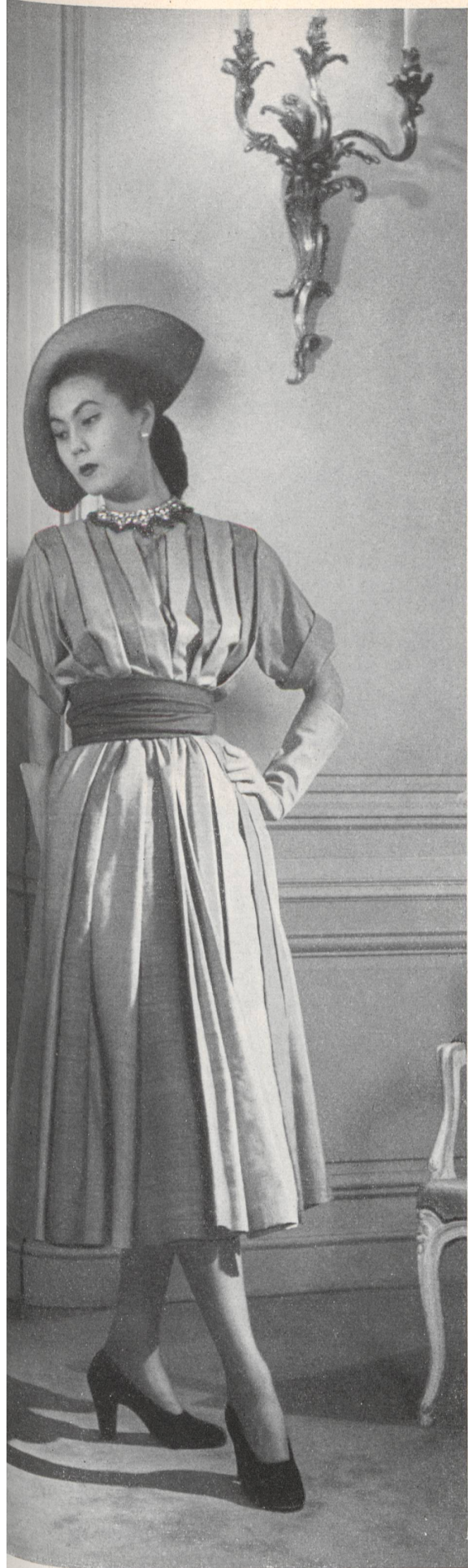
CHRISTIAN DIOR L. Abraham & Cie, Soieries S. A., Zurich