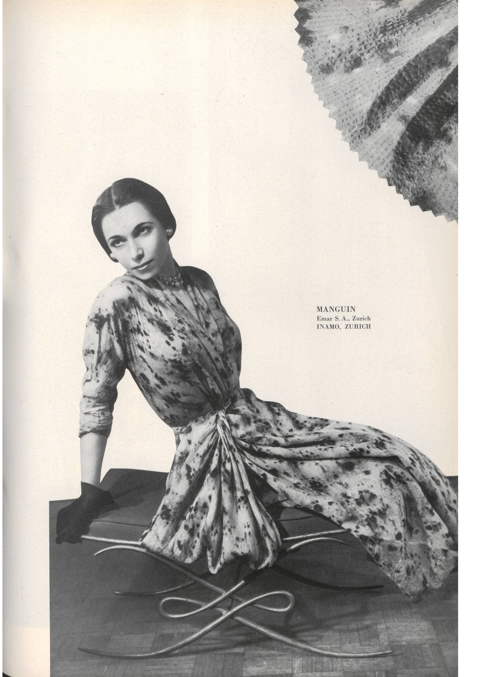
MANGUIN Emar S. A., Zurich INAMO, ZURICH