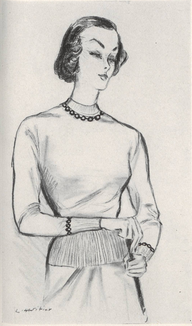
ANNY BLATT Union S. A., St-Gall PIERRE BRIVET FILS, PARIS