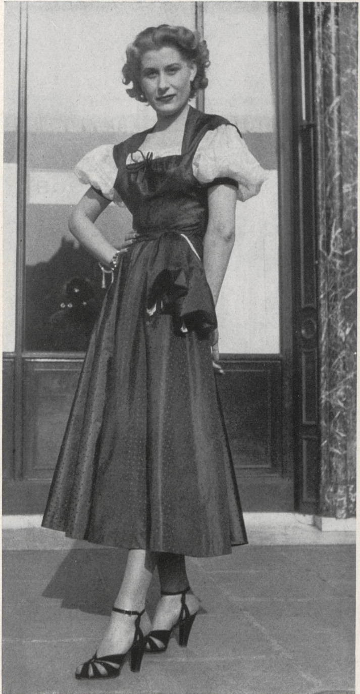
AGNÈS DRECOLL Rudolf Brauchbar & Cie, Zurich