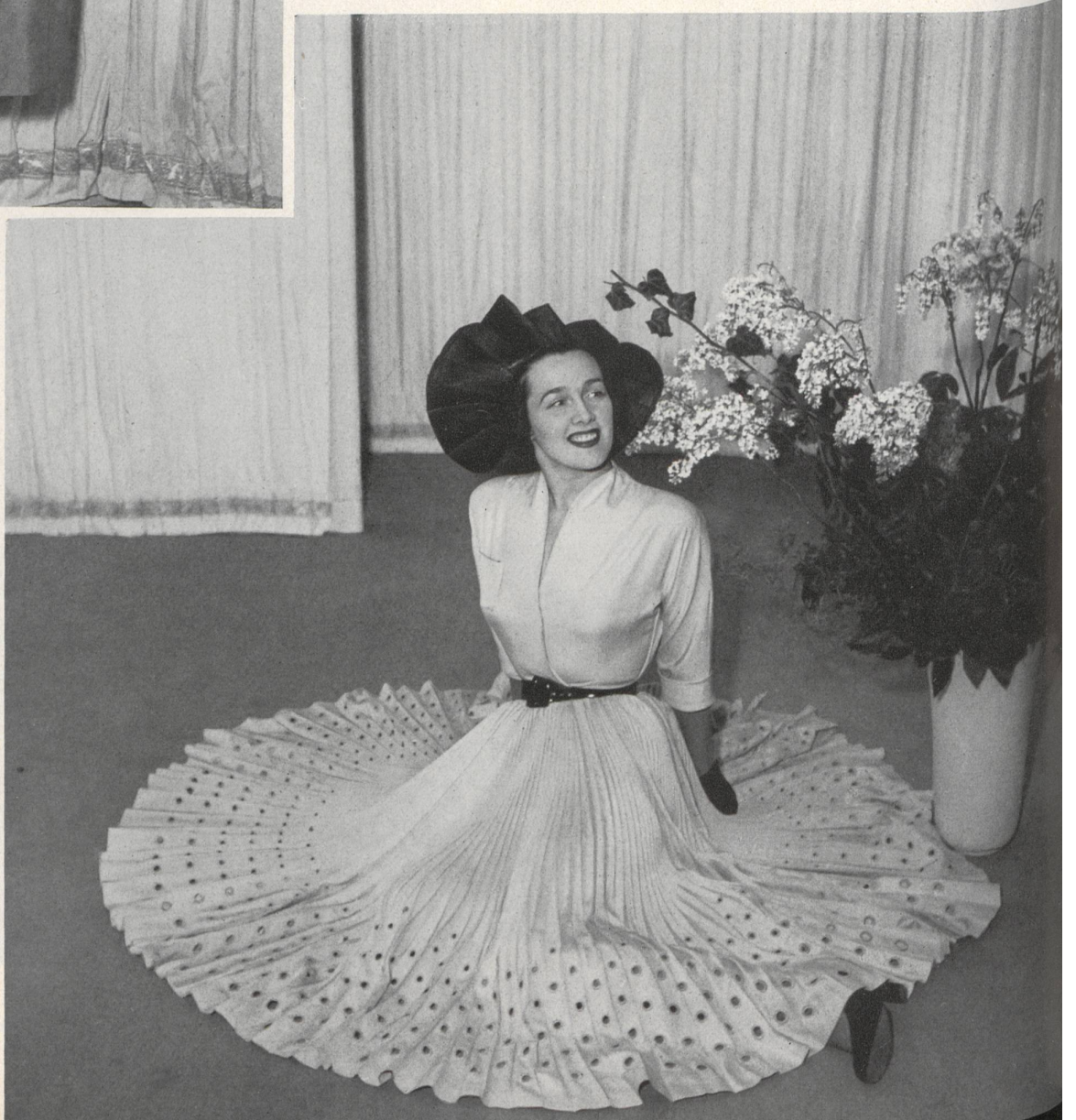
MARCEL ROCHAS Rudolf Brauchbar & Cie, Zurich