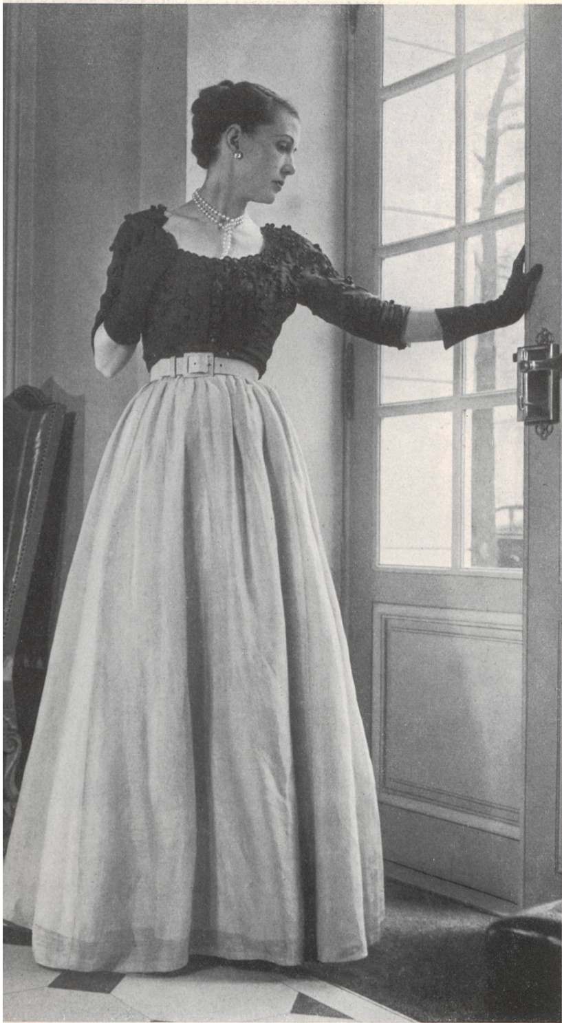
BALENCIAGA Heer & Cie S. A., Thalwil INAMO, ZURICH