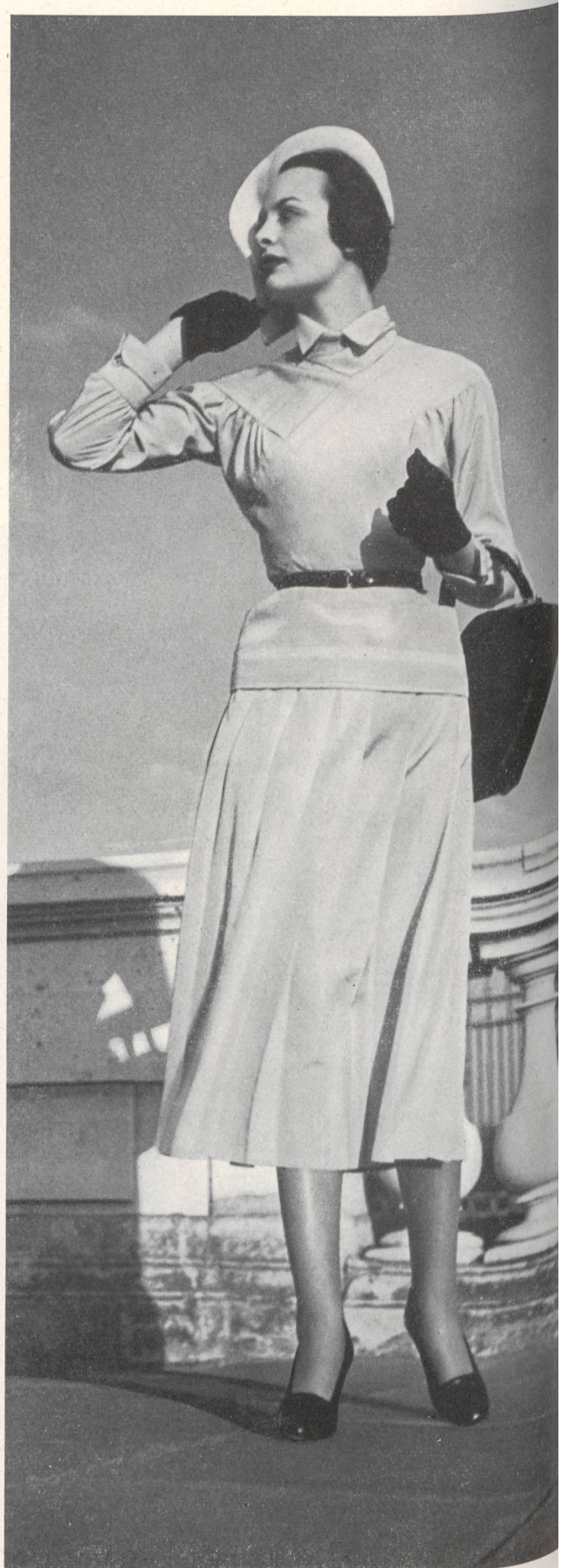
JEAN DESSÈS Heer & Cie S. A., Thalwil INAMO, ZURICH