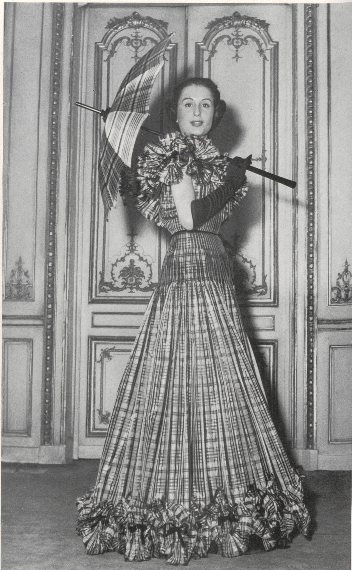
MARTIAL & ARMAND Rudolf Brauchbar & Cie, Zurich