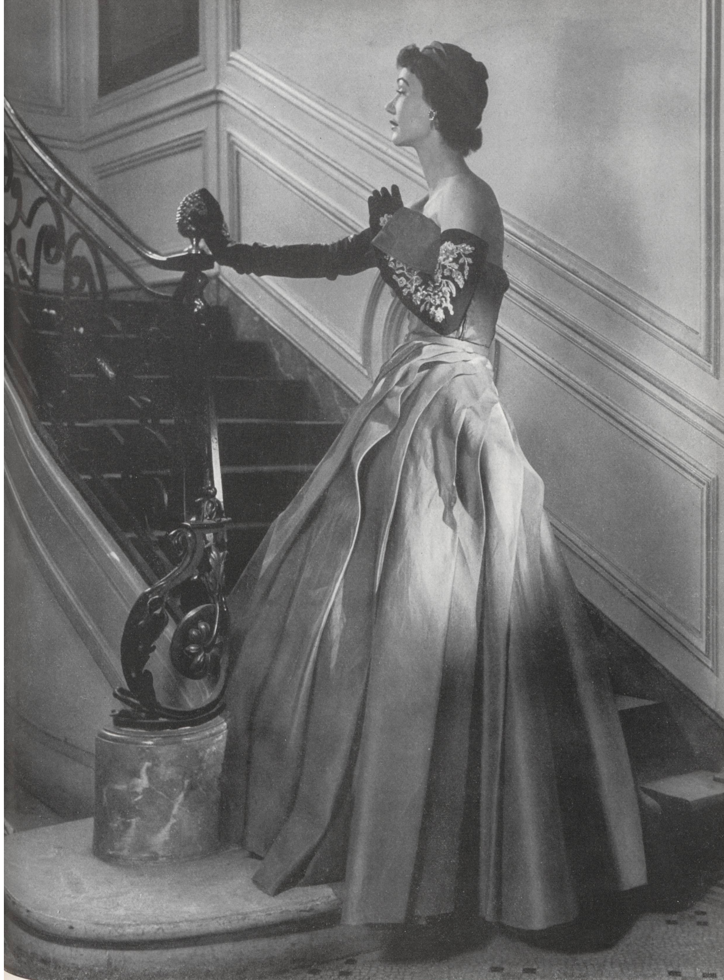
JACQUES FATH L. Abraham & Cie, Soieries S. A., Zurich