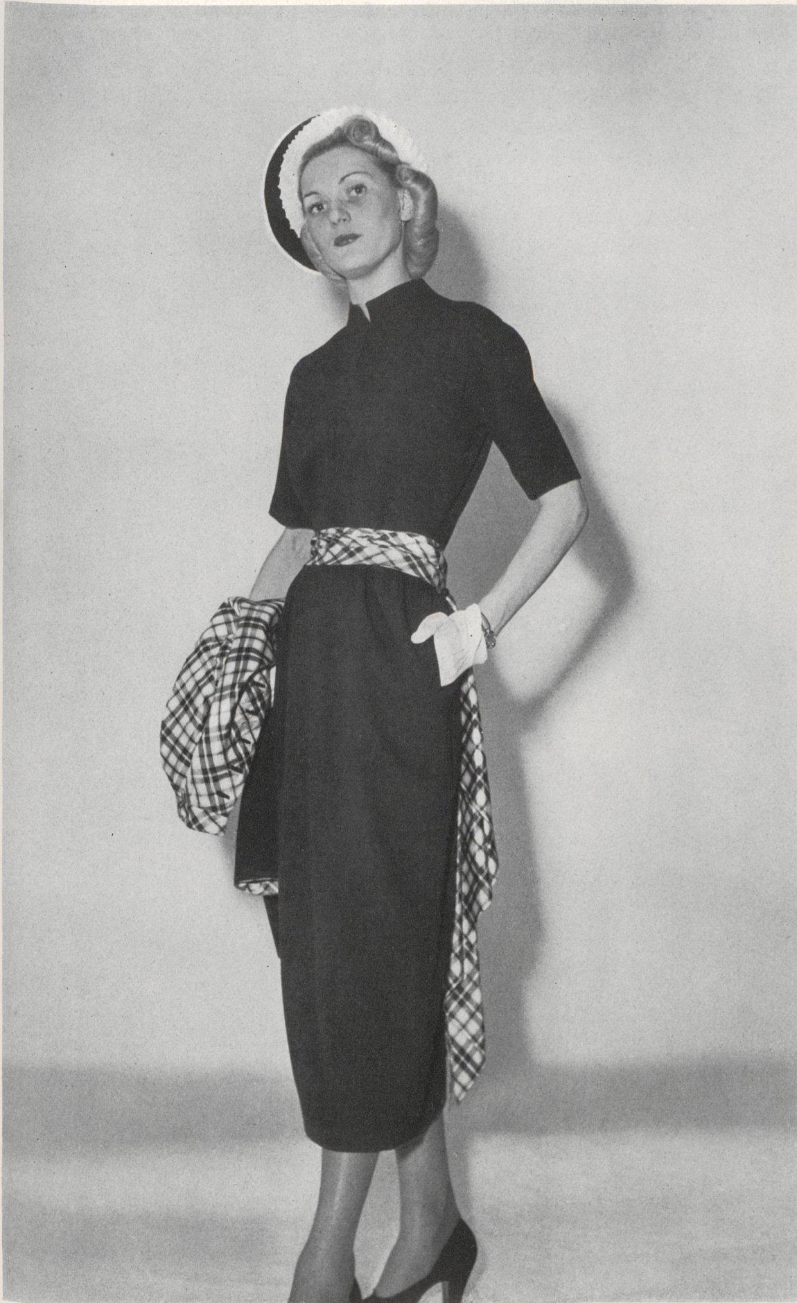
MOLYNEUX Rudolf Brauchbar & Cie, Zurich