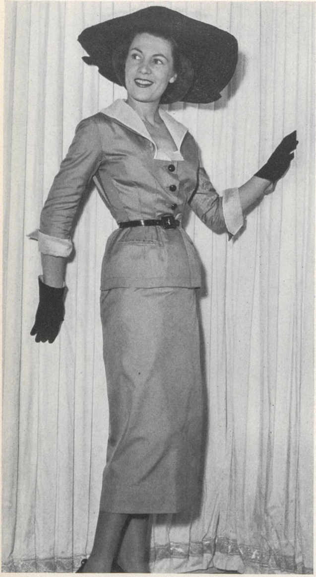
MARCEL ROCHAS Rudolf Brauchbar & Cie, Zurich