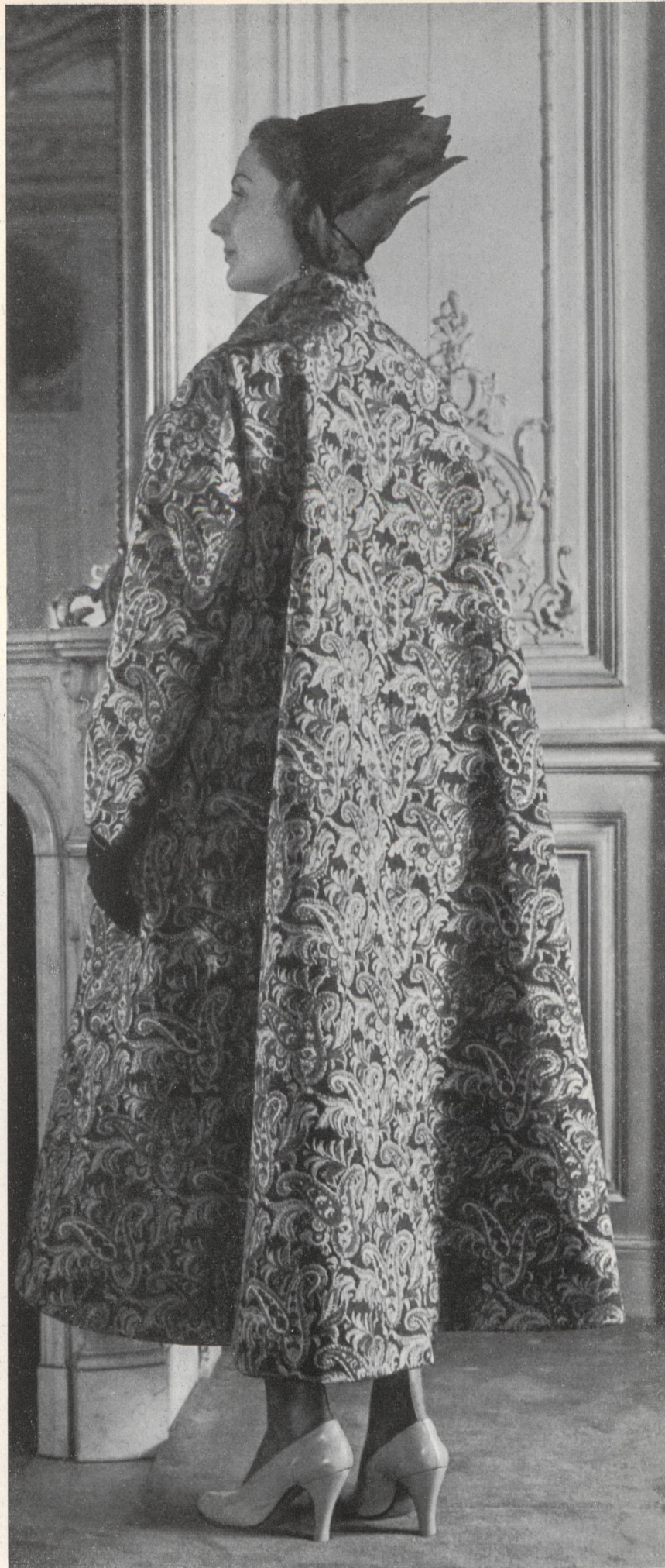
SCHIAPARELLI L. Abraham & Cie, Soieries S. A., Zurich