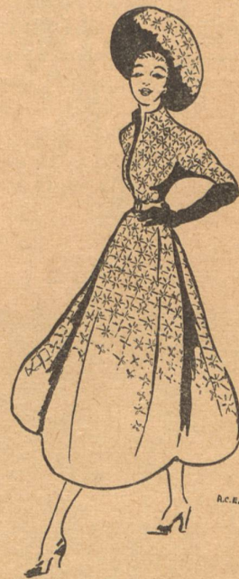
Vestido en bordado suiza de Frederick Starke.