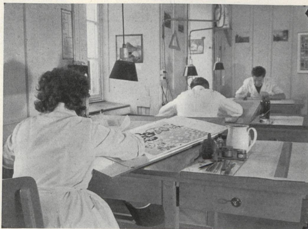
Taller de dibujo.

La estampación con estarcidos se lleva a cabo, en líneas generales, de la manera siguiente: La pieza de tejido se extiende y se fija sobre una mesa larga (de 40 a 80 metros) aplicándose sucesivamente y de un extremo al otro