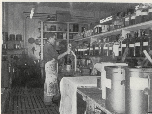
Preparación de las tintas.

mediante un estarcido, un reporte tras otro, todos los colores que componen el dibujo. Tiene que haber pues un estarcido por color; el estarcido está formado por una gasa de seda ultrafina, tensa en un marco. Mediante una operación fotoquímica se ciega con una película gelatinosa aquellas partes del estarcido que no deben dejar marca estampada, quedando libres los sitios que tienen que ser permeables al color; la tinta pasa fácilmente a través de las mallas de la gasa y penetra en las fibras del tejido cuando se la aplica sobre toda la superficie del estarcido,