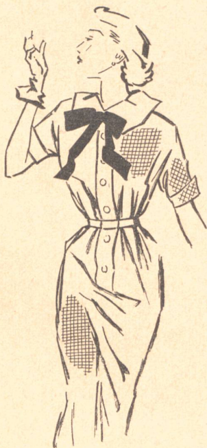
Vestido hechura camisero, de tafetán cuadrulado azul, de Mollie Parnis, Nueva York.

El tafetán está de moda; con él se confeccionan vestidos, trajes, blusas, forros y miles de adornos. En una colección de espléndidos tafetanes importados de Zurich, sorprende la calidad del tejido, su suavidad y la infinita variedad de los tonos de color. Se encuentran todos los colores del arco iris, de los