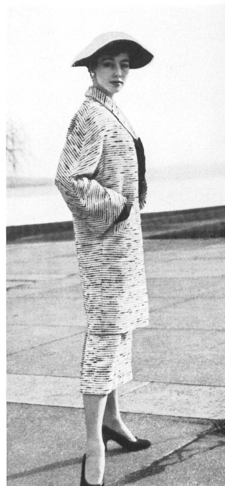
Conjunto de tweed fantasía negro y blanco.