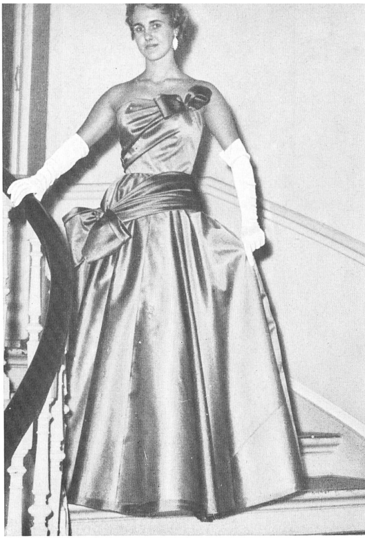
Honico A/S, Copenhagen Organza Cristalline de Emar S. A., Zurich