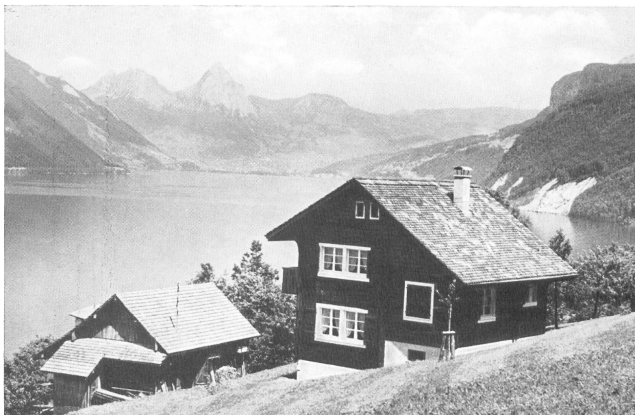
Una de las casas de reposo para los empleados, en Beckenried cerca de Lucerna.

La obra conmemorativa de la Hilatura del Lorze debe quedar reseñada como un modelo de su clase. Al disponer de una documentación abundante y completa, el autor supo sacar provecho muy competentemente y, al mismo tiempo que reseña el historial de una empresa, ha logrado escribir un capítulo en el que estudia muy a fondo el desarrollo industrial y económico suizo durante los últimos cien años transcurridos.