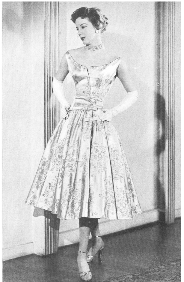
Frederick Starke Ltd., London

Woven rayon by L. Abraham & Co., Silks Ltd., Zurich