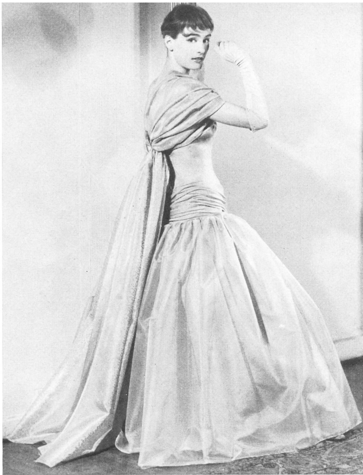
Frederick Starke Ltd., London

Pure silk organza by L. Abraham & Co., Silks Ltd., Zurich