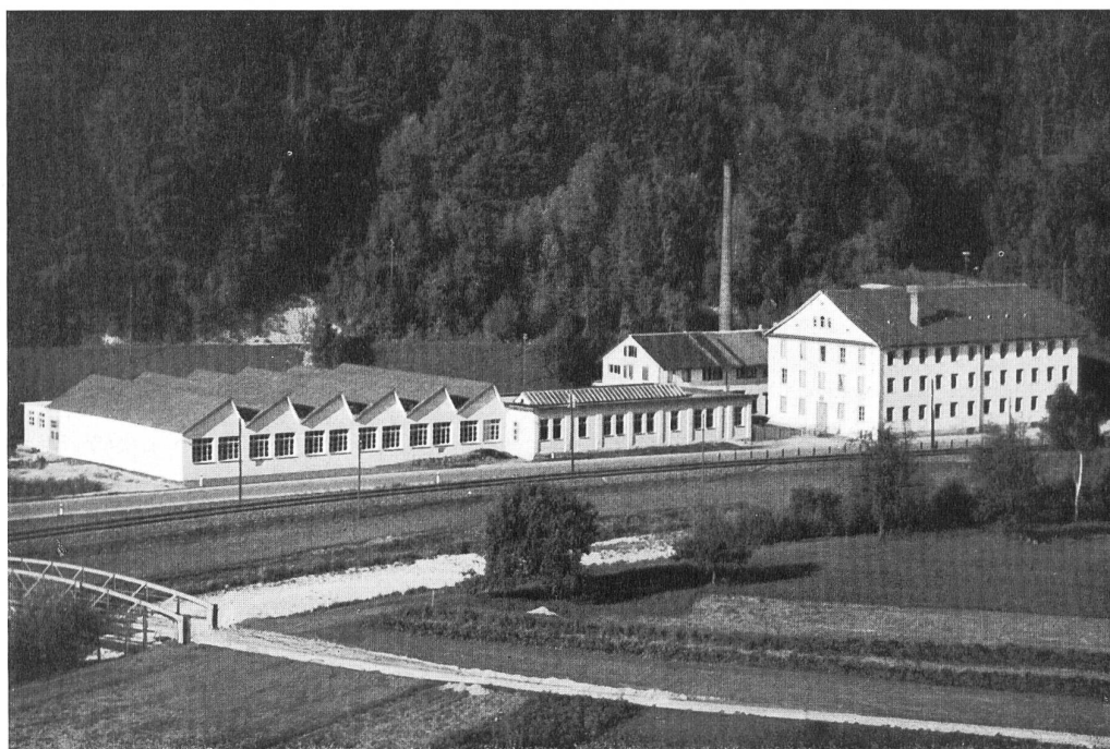
Tisaje de la casa J. G. Nef & Cia S. A. en Bauma.