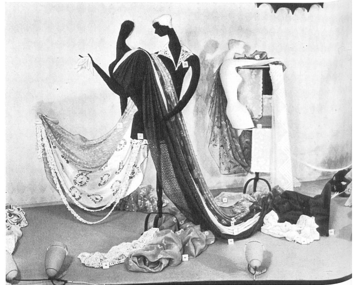
Bordados y tejidos finos de algodón de San-Gall.

La « Semana Suiza » de Estocolmo ha constituido un éxito. Esperemos que contribuirá duraderamente a desarrollar las relaciones comerciales sueco-suizas, como fué expresado por todos los participantes.