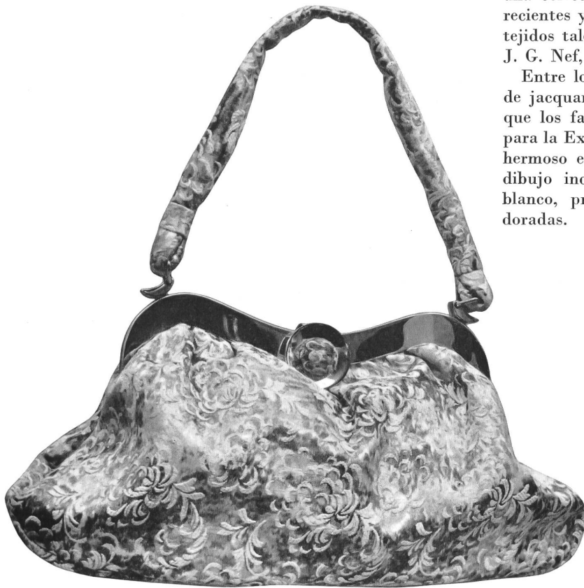
METTLER & CIE S.A., SAINT-GALL Brocart de coton Baumwollbrokat Modèle : Fritz Fürstl, Offenbach s.M.

Entre los tejidos, los había de brocado de algodón y de jacquard con dibujos y en colores muy originales y que los fabricantes suizos habían creado especialmente para la Exposición Universal de Bruselas. El modelo más hermoso era un abrigo de tejido brocado figurando un dibujo inca y adornado con un cuello de « renard » blanco, presentado sobre una camisa con lentejuelas doradas.