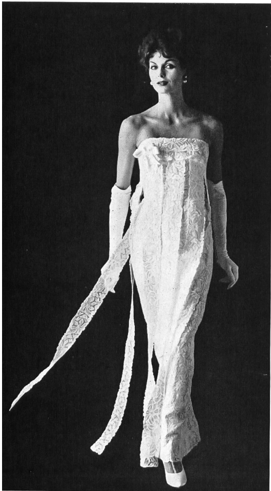
FORSTER WILLI & CO., SAINT-GALL Galons de broderie Embroidered galloons Modèle : Galanos, Los Angeles

LA «LÍNEA», TAL Y COMO SE LA VE DESDE AQUÍ