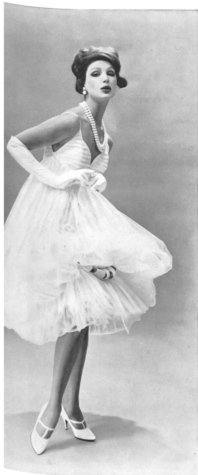
FORSTER WILLI & CO., SAINT-GALL Broderie Points d'esprit sur coton Point d'Esprit embroidered cotton Modèle : Galanos, Los Angeles