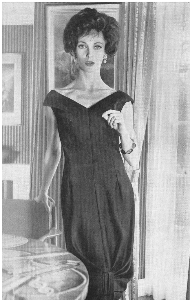
SOIERIES STEHLI S.A., ZURICH Pure silk morocaine. Model Roter Models Ltd., London.

Susan Small y Frank Usher, emplean a menudo tejidos suizos, mientras que otras casas, como Roter Models, siempre tienen en sus colecciones varios modelos confeccionados con materiales suizos.