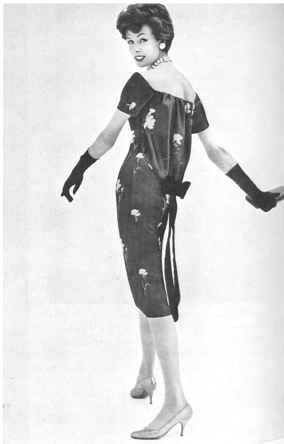
FORSTER WILLI & Co, SAINT-GALL Embroidered pure silk organdie. Model Roter Models Ltd., London.

Claro es que son los mercados más exigentes los que mayores posibilidades de venta ofrecen a los productos suizos del ramo textil y del vestido. Ciertos fabricantes de prendas al por mayor, tales como Frederick Starke,