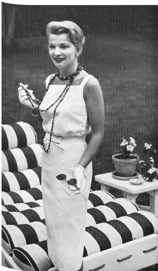
«NELO», J. G. NEF & Co. Ltd., HERISAU Nelo-Lugano cotton fabric. Model Lanz of California worn by MGM Star Gera Rowlands.