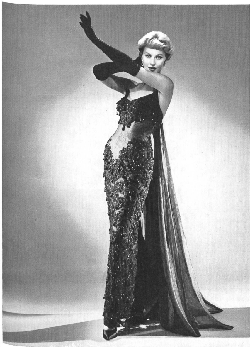
NEUBURGER & Co. S.A., SAINT-GALL Reembroidered lace. Model Don Loper, Los Angeles.