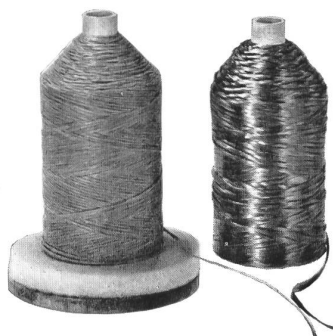
Société de la Viscose suisse, Emmenbrücke

En la sección llamada « Calle de las tiendecillas » la Sociedad de la Viscosa Suiza exhibió además su paja artificial que reemplaza a la rafia para toda clase de labores de fantasía y que puede ser, inclusive, utilizada ahora con los aparatos de hacer calceta a mano para la confección de distintos artículos, tales como faldas, sombreros, bolsos de mano para el verano, etc.