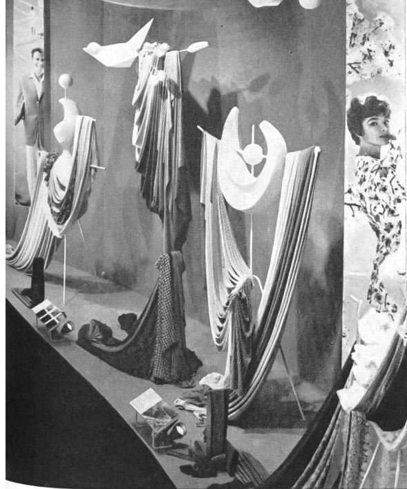
La industria lanera suiza estaba representada en varias secciones de la SAFFA, y especialmente por una exposición temática del vestido. Reproducimos aquí una vista del « stand » de la exposición organizada en el « Tío vivo de la moda » por la Asociación Suiza de la Industria Lanera y en la que están agrupados los productos de 36 fabricantes.