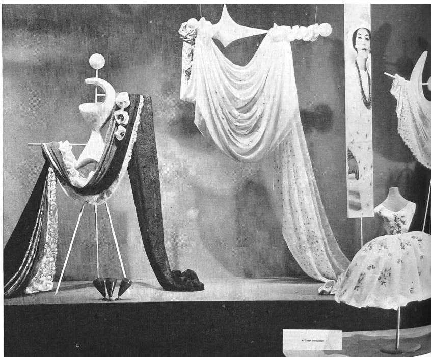
Exposición de bordados de San Galo en el «Tío vivo de la moda». Arreglo por la Sra. Tildy Grob-Wenger.