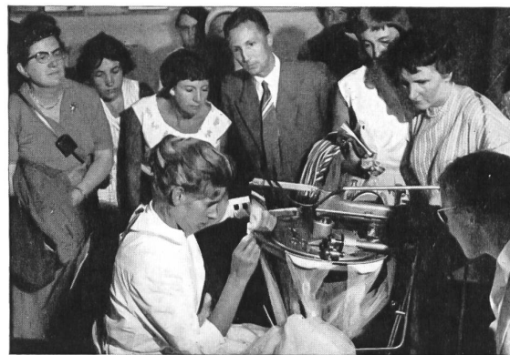
Société de la Viscose suisse, Emmenbrücke

En la SAFFA, la Sociedad de la Viscosa Suiza estuvo representada en primer lugar por una caseta de información sobre el nylon « Nylsuisse » (marca registrada) instalada en el pabellón del Instituto de Investigaciones sobre la vivienda, de Zurich. También figuraba en la nave dedicada a « la mujer en la industria », en el grupo « Industria Textil » colocado bajo el patronazgo de la Asociación de Empleadores de la Industria Textil. Aparte de los numerosos tejidos exhibidos en la « Torre de la Seda » (véase pág. 150, fig. 3) dispuso aquí de un « stand » que informaba al visitante sobre la fabricación y el empleo de todos los productos de esta empresa: hilos de rayón y de fibrana, paja artificial para el trenzado, pelos artificiales para pelucas, etc.