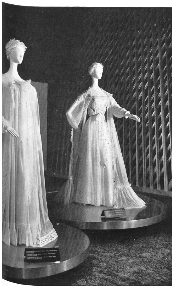
Société de la Viscose suisse, Emmenbrücke Négligés en nylon Nylsuisse.