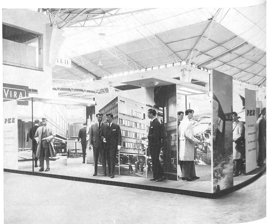
Le stand « PKZ », Burger-Kehl & Co, AG, Zurich.

El Vº Salón del vestido masculino celebrado en Colonia a fines de agosto ha reunido la participación de 310 casas procedentes de 13 países distintos. Tres casas suizas tuvieron empeño en estar representadas, y los vestidos que exhibieron han merecido la atención de los especialistas y comerciantes de muchos países. Como en todos los demás ramos de la industria suiza del vestido, la camisería y la confección de prendas listas para llevar resaltan por cuatro puntos : calidad de los tejidos y de los accesorios,