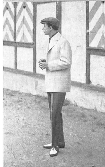
Modèles Ritex Photos Guniat