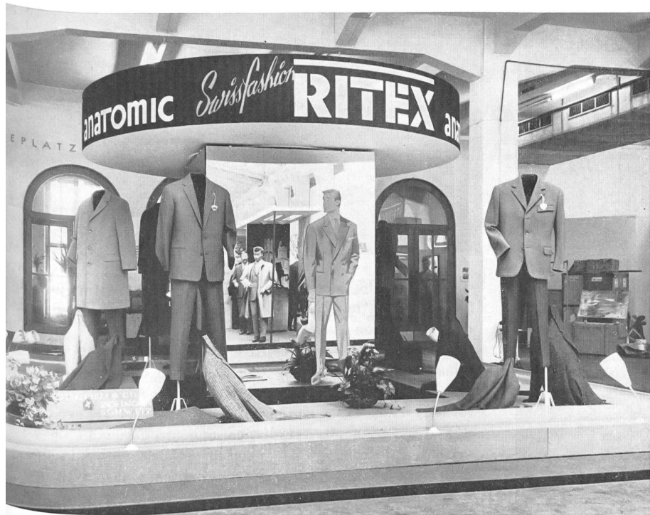
Le stand « Ritex », Roth, Iseli & Cie, Zofingue

buena hechura, corte esmerado y buen gusto. Por este último término pretendemos expresar la elegancia en el vestir que, sin dejar de lado las ideas modernas y a veces audaces, no pierde jamás de vista las necesidades prácticas, esto es, el vestir con elegancia y corrección.