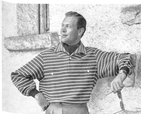
Modèles « Lutteurs », AG. Fehlmann Söhne, Schöftland

buena hechura, corte esmerado y buen gusto. Por este último término pretendemos expresar la elegancia en el vestir que, sin dejar de lado las ideas modernas y a veces audaces, no pierde jamás de vista las necesidades prácticas, esto es, el vestir con elegancia y corrección.