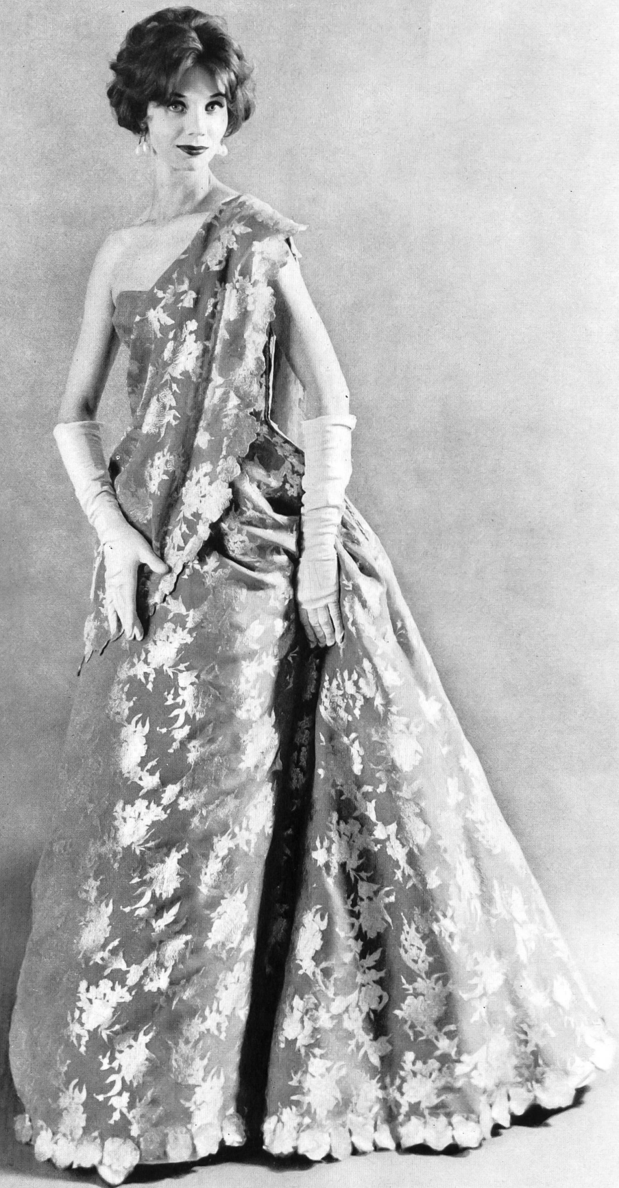
JEAN DESSES « Basra » broché de L. Abraham & Cie, Soieries S. A. Zurich.