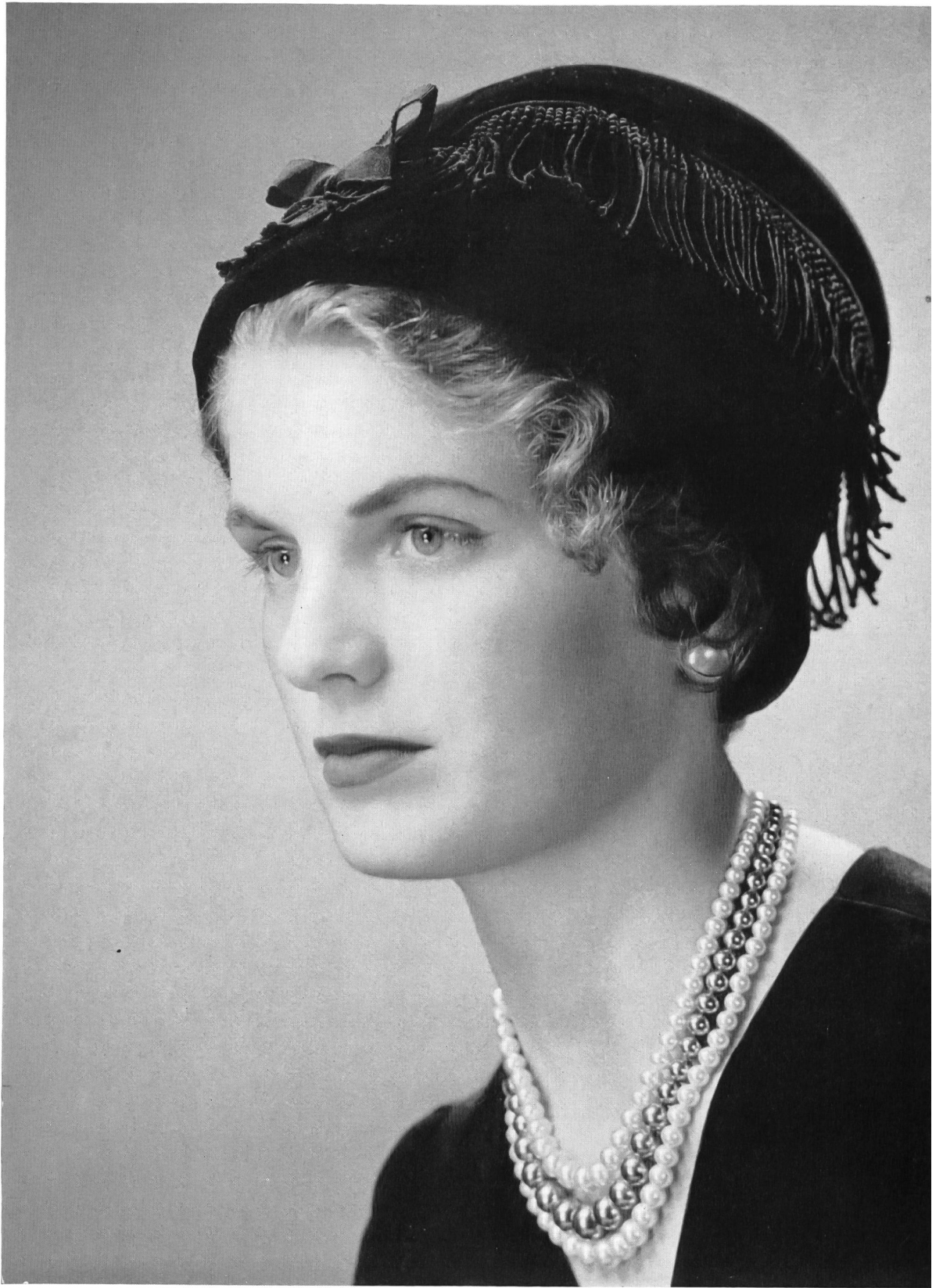
LANVIN CASTILLO Frange de guipure noire de Union S. A., Saint-Gall