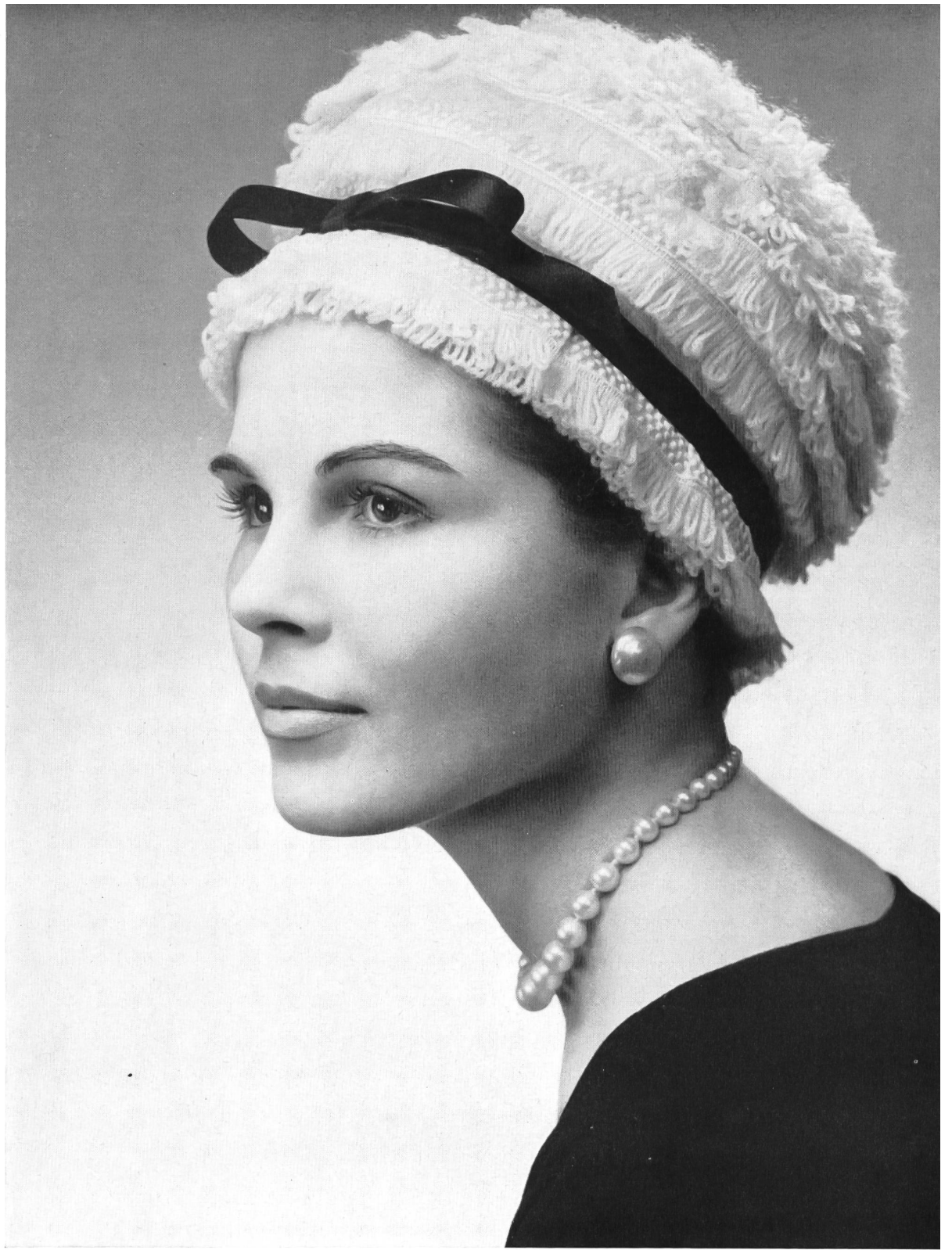
LANVIN CASTILLO Frange de laine brodée de Union S. A., Saint-Gall