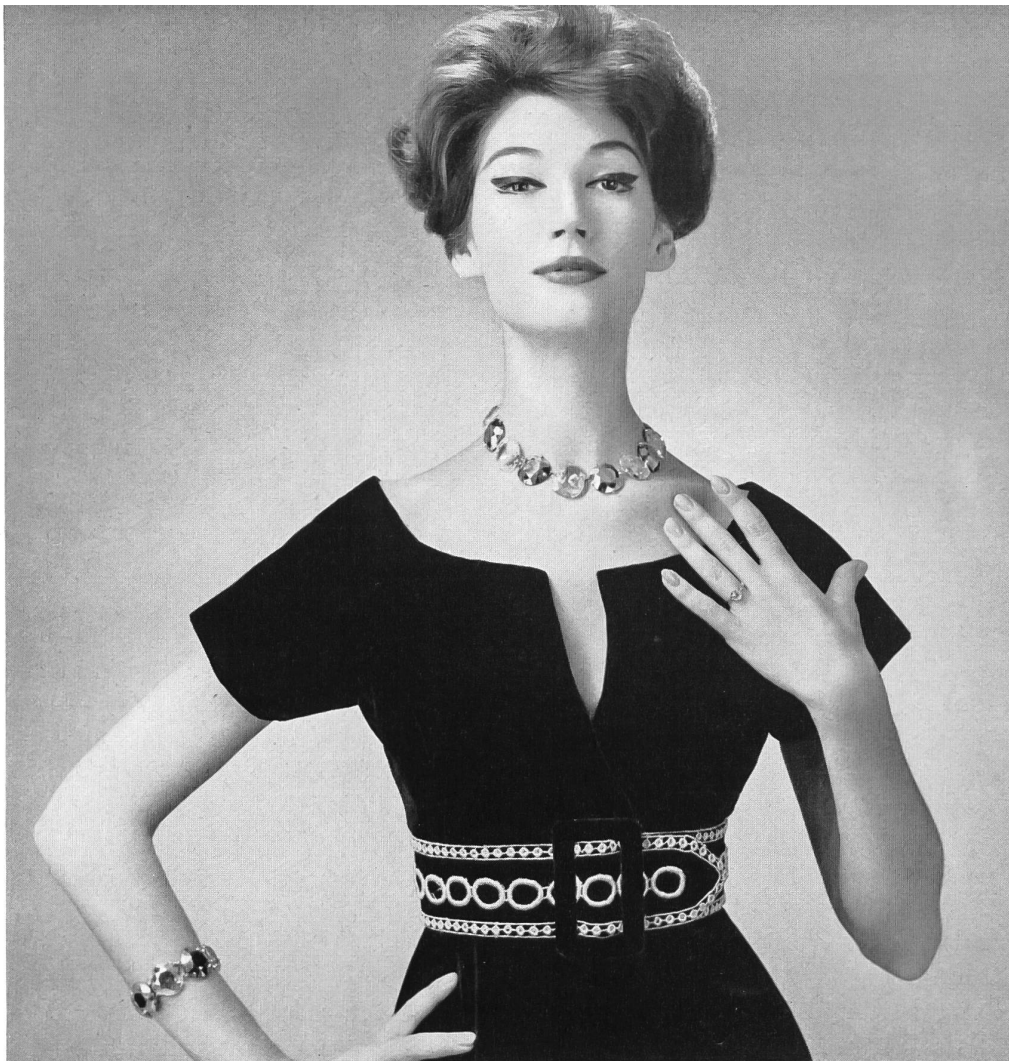
CHRISTIAN DIOR (Boutique) Galon en broderie or de Union S. A., Saint-Gall