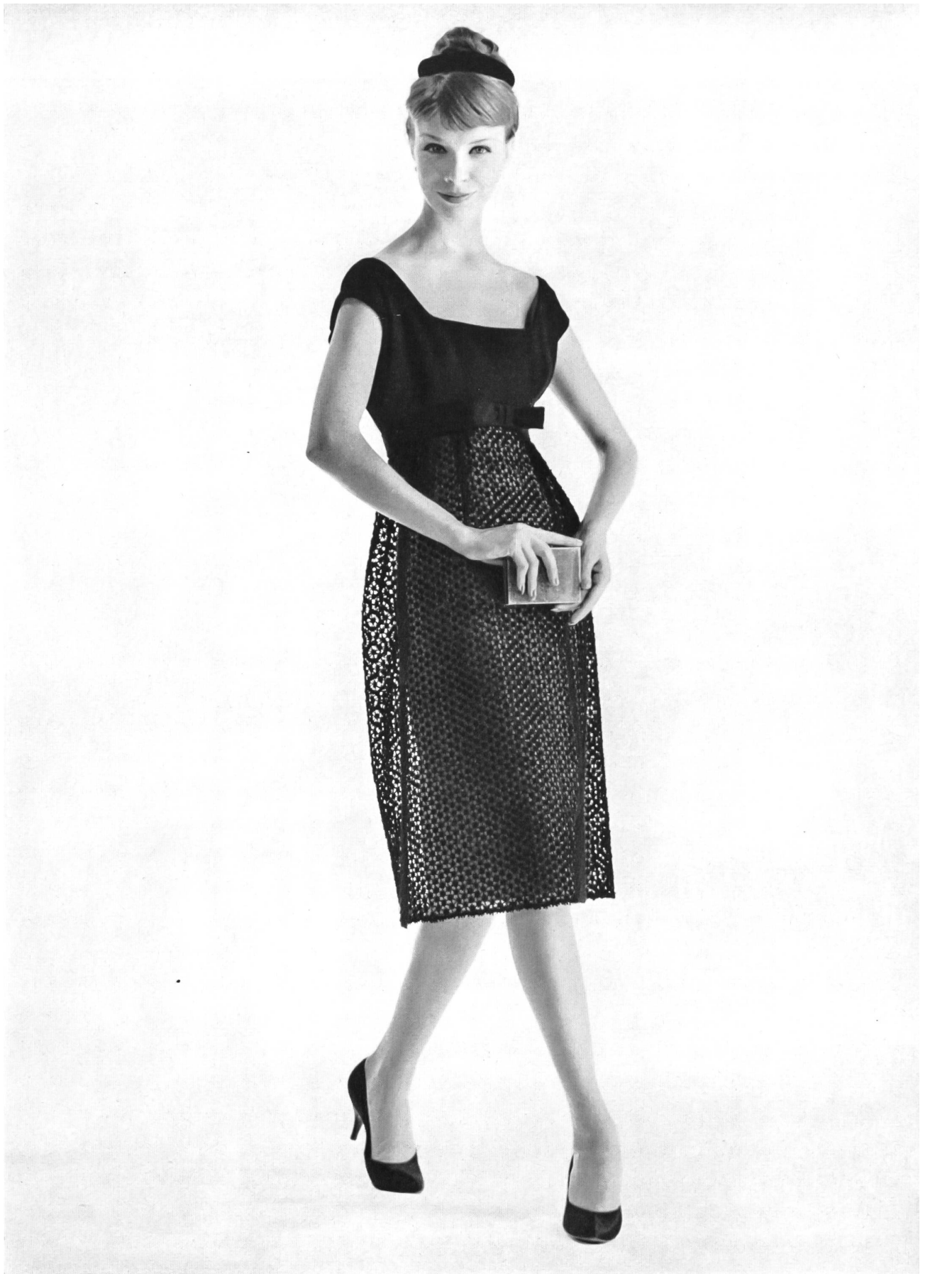
GUY LAROCHE Dentelle de laine de Forster Willi & Co., Saint-Gall Grossiste à Paris : Pierre Brivet S.à.r.l.

Modèles exclusifs - Reproduction interdite