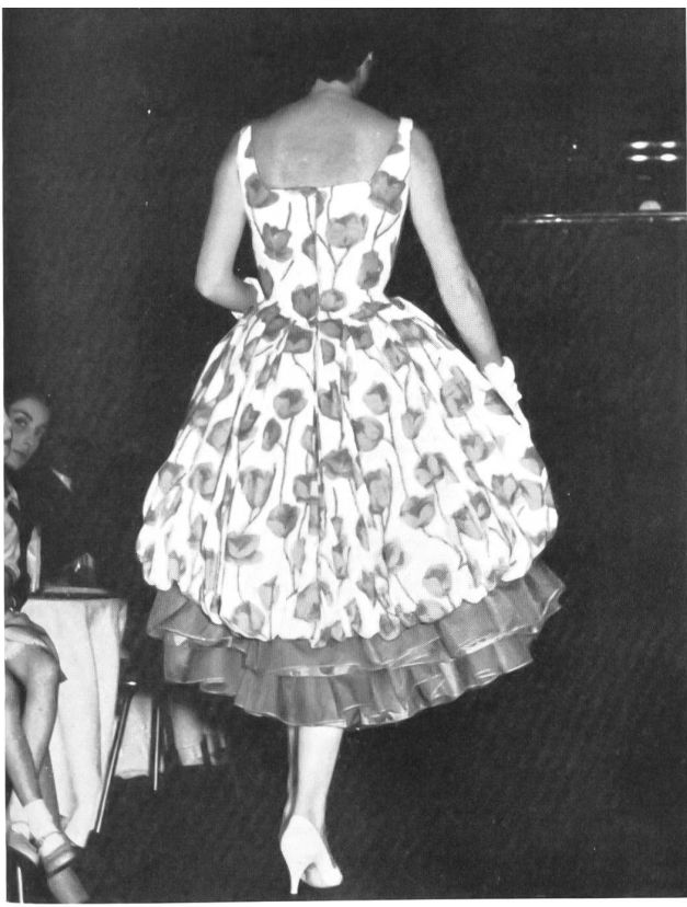
Toile Capri imprimée/Printed Toile Capri. (Cotton - viscose.)