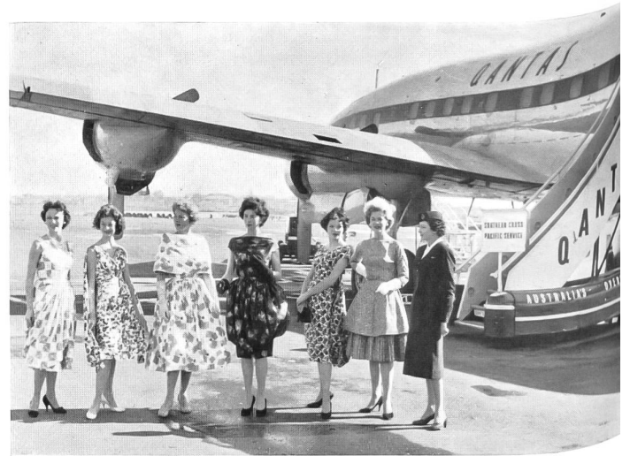
Arrivée des mannequins à Sydney. Arrival of the mannequins in Sydney.

El mes de agosto de este año, las ciudades de Sydney y de Melbourne tuvieron ocasión de presenciar un desfile de modas de unas proporciones imponentes. Según la revista «Australian Fashion News», se trataba del «mayor acontecimiento del año en la esfera de la moda». A impulsos de un importador australiano de tejidos, más de cincuenta de los mejores fabricantes de prendas listas para llevar de Australia confeccionaron con tejidos europeos unos modelos de un gusto exquisito y, para ello utilizaron especialmente productos de la casa