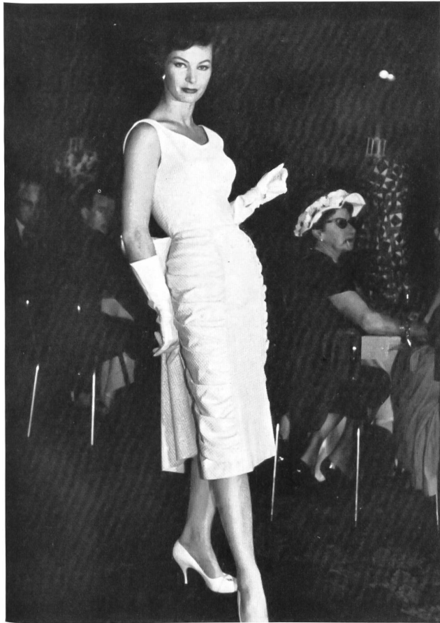
Luxor lamé, façonné ; infroissable. Luxor, crease resisting figured lamé. (Staple fibre - cotton - Lurex.)