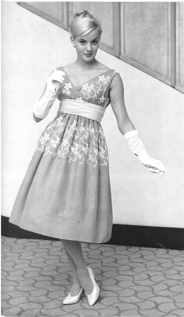
JACOB ROHNER S. A., REBSTEIN

Natté coton brodé. Embroidered basket-weave cotton.