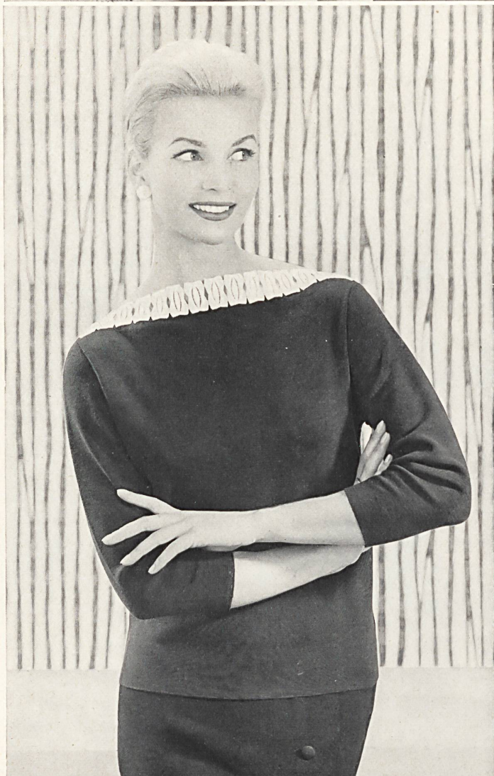
VICTOR TANNER S. A., SAINT-GALL

Jaquette de sport exclusive, fully fashioned, à grosse maille • Exclusive bulky knit jacket, fully fashioned • Exklusive, sportliche Strickjacke in fully fashioned Ausführung