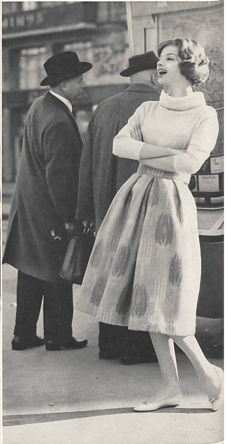
« abc », A. BLUM & CO., ZURICH

Jupe de cocktail en tissu jacquard genre Gobelin avec effets Lurex • Cocktail skirt in a Gobelin type jacquard fabric with Lurex thread effects • Cocktail Jupe aus Jacquard-gewobenem gobelinartigem Stoff mit Lurex-Effekt • Photo Guniat