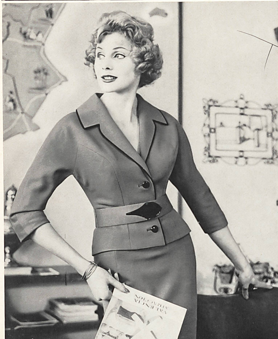
« STREBA » JOHANN MULLER S. A., WOHLLEN

Robe mode en wevenit • Fashionable Wevenit dress • Modisches Wevenit Kleid