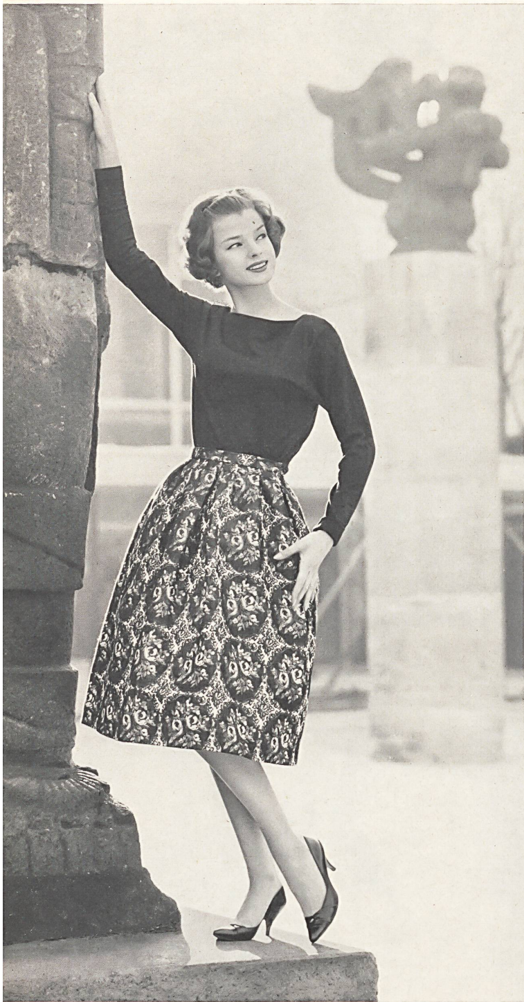
« abc », A. BLUM & CO., ZURICH

Jupe de cocktail en tissu jacquard genre Gobelin avec effets Lurex • Cocktail skirt in a Gobelin type jacquard fabric with Lurex thread effects • Cocktail Jupe aus Jacquard-gewobenem gobelinartigem Stoff mit Lurex-Effekt • Photo Guniat