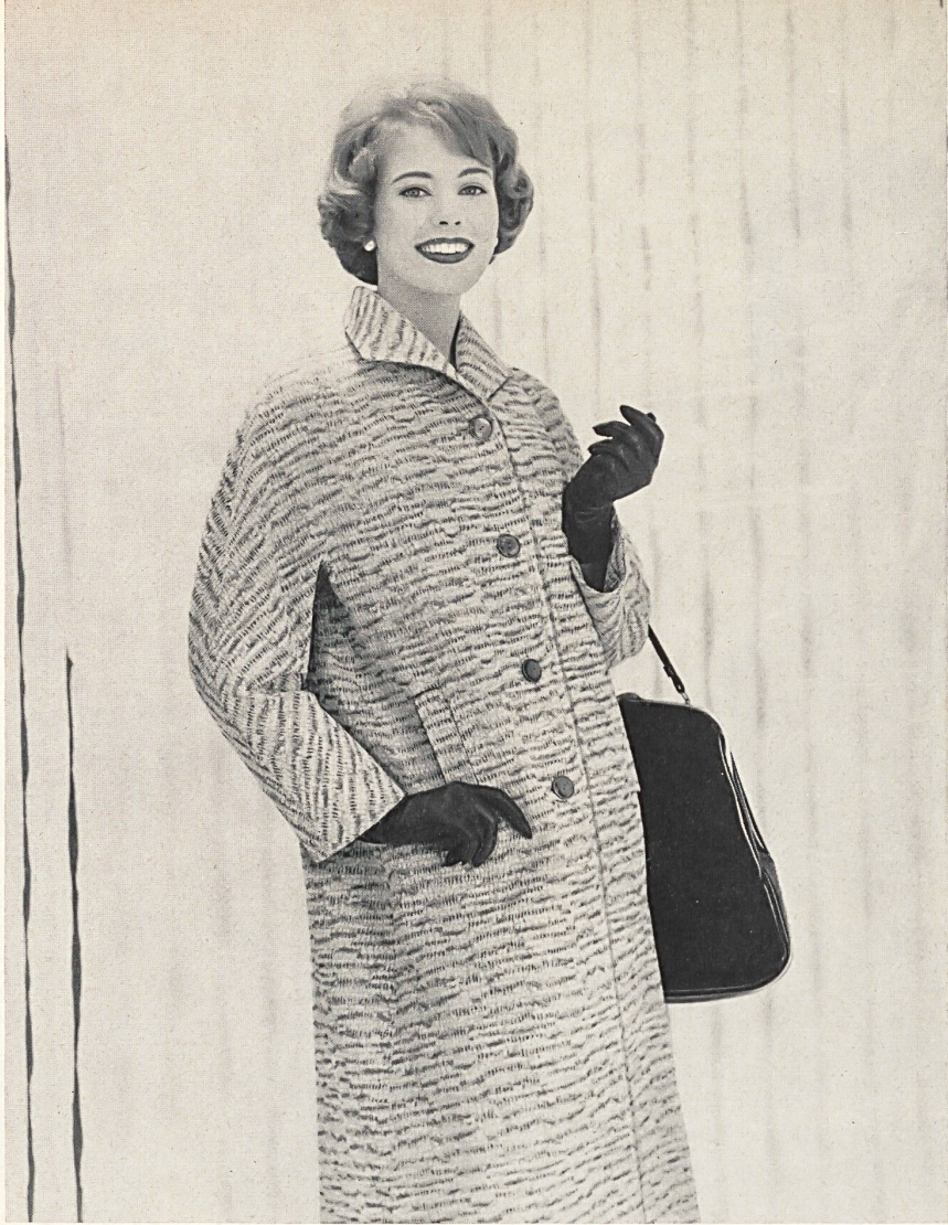
◀ « MATADOR », BISCHOFF TEXTILES S. A., SAINT-GALL

Manteau en coton et rayonne avec effets de fils crylor • Cotton and rayon coat with crylor thread effects • Baumwolle/Kunstseide Mantel mit Crylorfadeneffekten • Photo Lutz