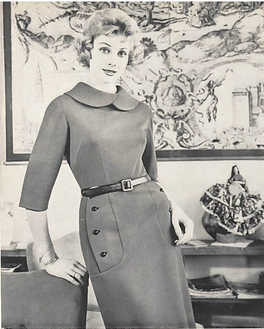
◀ R. ANDERES S. A., SAINT-GALL

Robe mode en wevenit • Fashionable Wevenit dress • Modisches Wevenit Kleid • Photo Rév