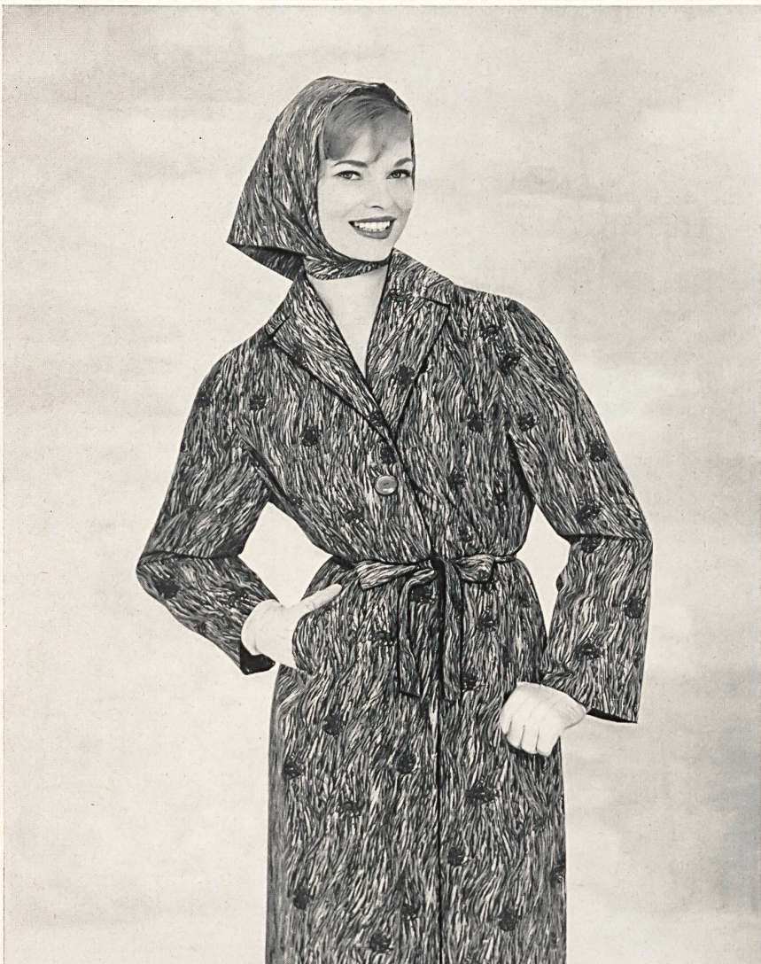
◀ « ADMIRAL », BAERLOCHER & CO., RHEINECK

Manteau en coton et rayonne avec effets de fils crylor • Cotton and rayon coat with crylor thread effects • Baumwolle/Kunstseide Mantel mit Crylorfadeneffekten • Photo Lutz