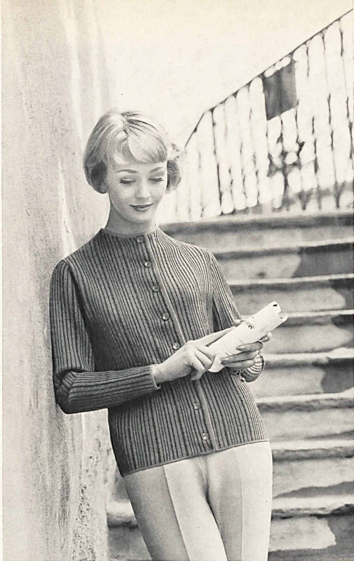
◀ « PRIORA », JOH. LAIB & CIE S. A., AMRISWIL Fabrique de bonneterie • Knitwear manufacturers • Strick- und Wirkwarenfabrik • Photo Lutz