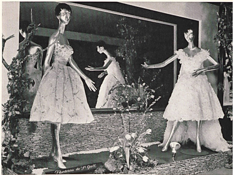
La exposición de bordados en el foyer del teatro

Las Well's Sisters, del ballet Bentyber de París, presentan vestidos de bordados de San Galo en la revista puesta en escena por el Teatro de Lausanne