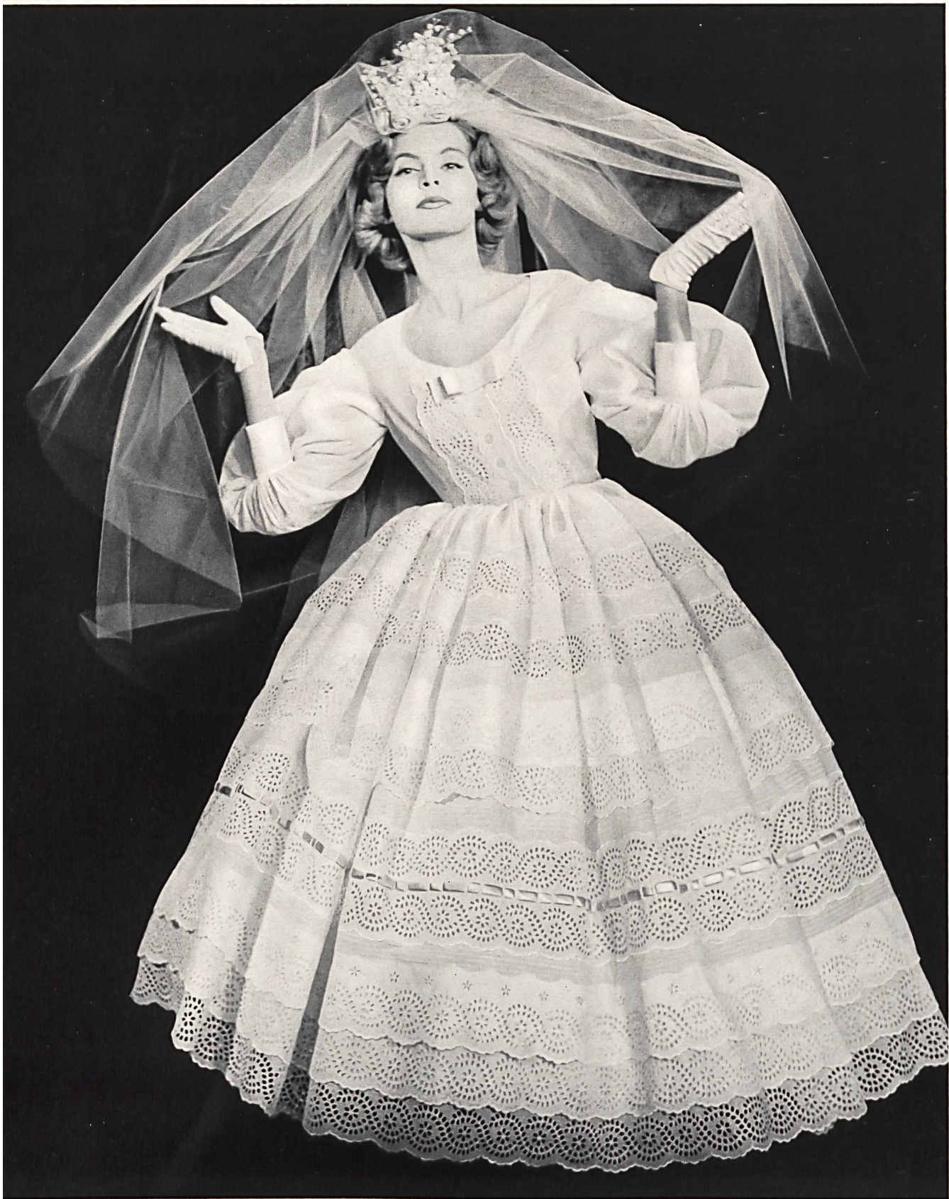
MAGGY ROUFF Broderie anglaise de Walter Schrank & Co., Saint-Gall Grossiste à Paris: Robert Burg & Co.