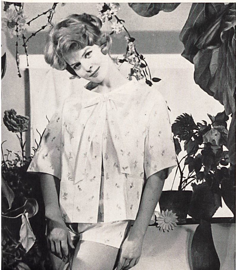
CHRISTIAN DIOR (Boutique) Plumetis brodé couleurs de Forster Willi & Co., Saint-Gall