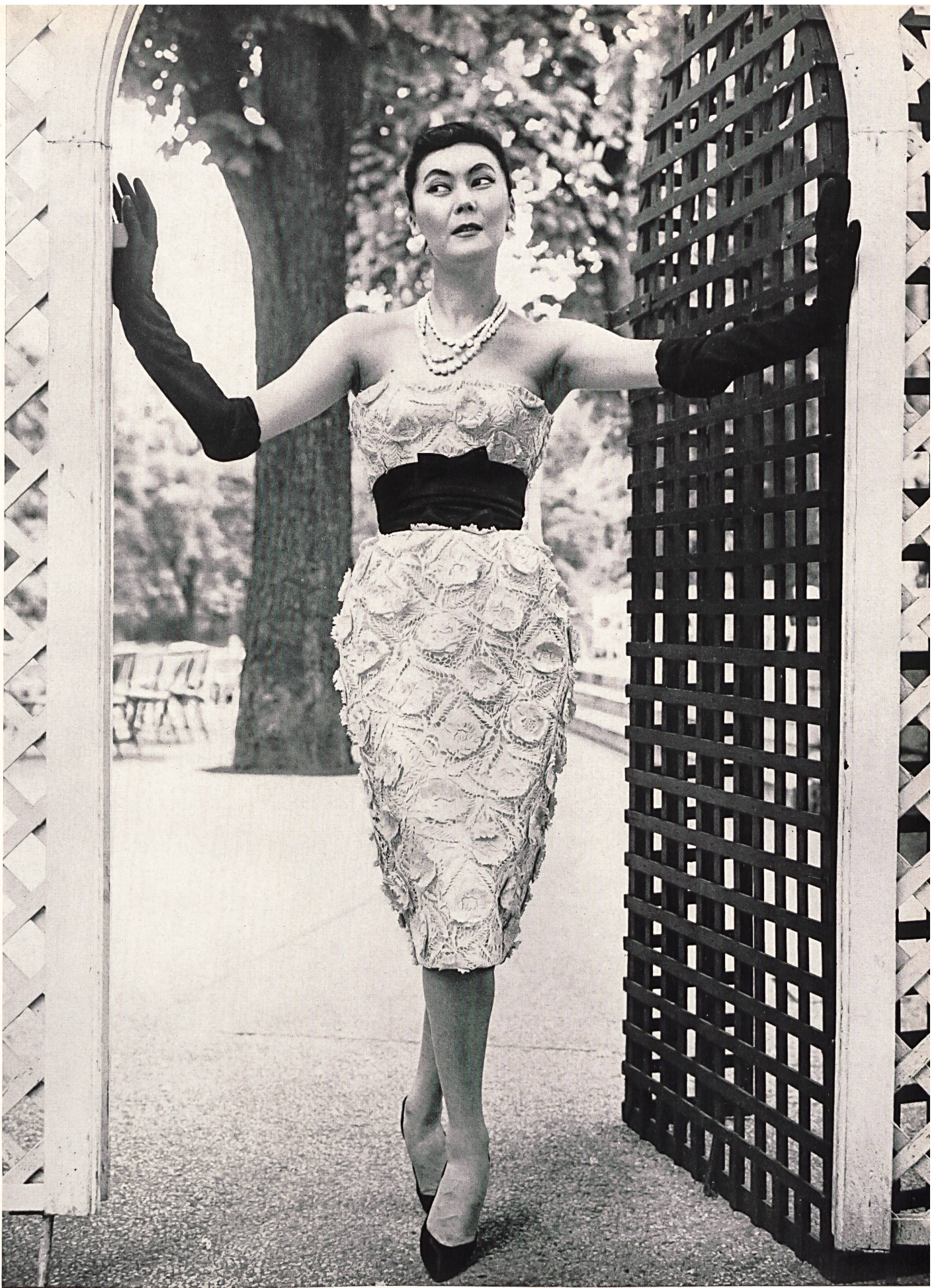
NINA RICCI Laize de guipure de Forster Willi & Co., Saint-Gall Grossiste à Paris : Les Tisseurs B. de M.