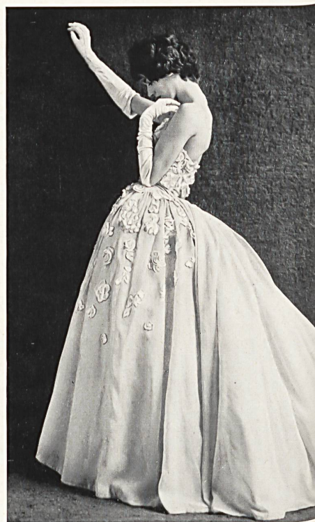
FORSTER WILLI & CO., SAINT-GALL

Embroidered cotton organdie allover Laize d'organdi de coton brodée Modèle John Cavanagh, London