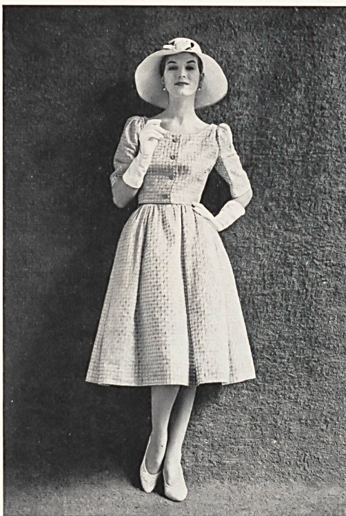
FORSTER WILLI & CO., SAINT-GALL

Multicolour embroidery on cotton organdie Organdi de coton brodé multicolore Modèle Victor Stiebel, London