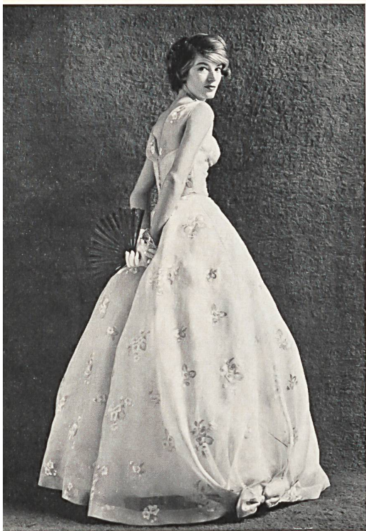
FORSTER WILLI & CO., SAINT-GALL

Multicolour embroidery on cotton organdie Organdi de coton brodé multicolore Modèle Victor Stiebel, London