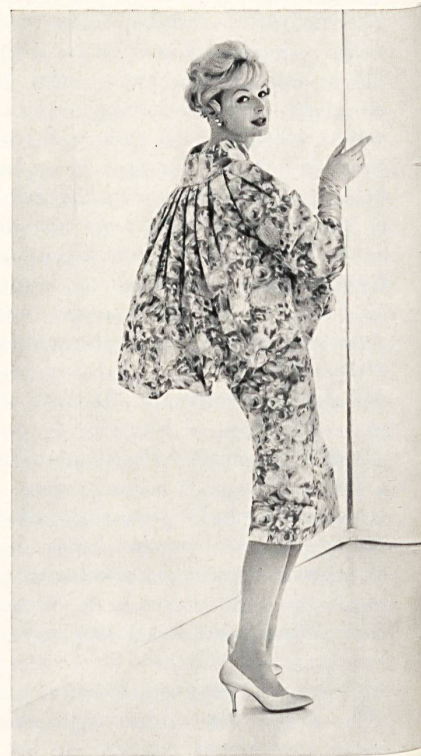
L. ABRAHAM & CO. SILKS LTD., ZURICH

La casa Werlé se ha especializado desde sus principios en el empleo de los tejidos finos importados que confieren a sus creaciones un gusto tan característico combinado