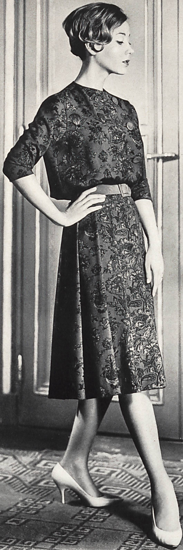
BERNARD SAGARDOY Laine imprimée « Crapella » de Rudolf Brauchbar & Cie S.A., Zurich Distribué par la Maison Montex, Paris