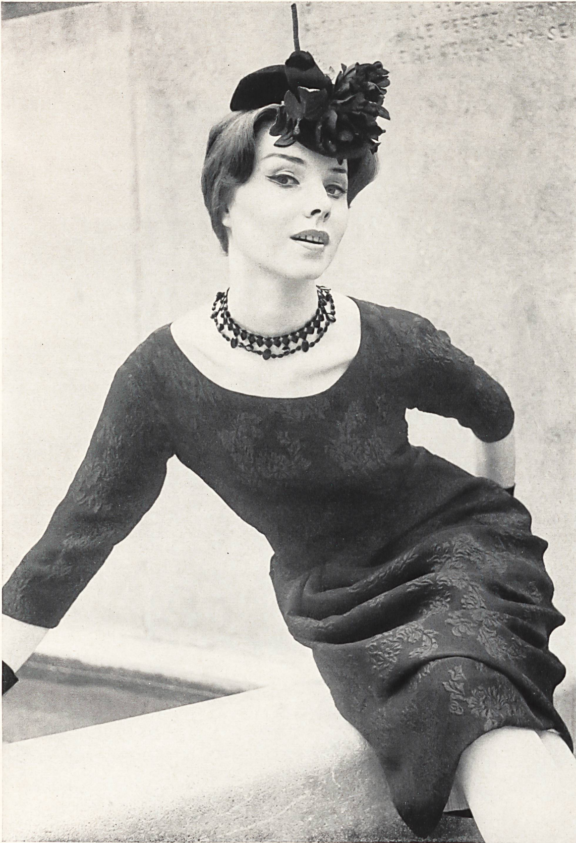
PIERRE CARDIN Crêpe façonné en relief, soie naturelle, de Soieries Stehli S. A., Zurich