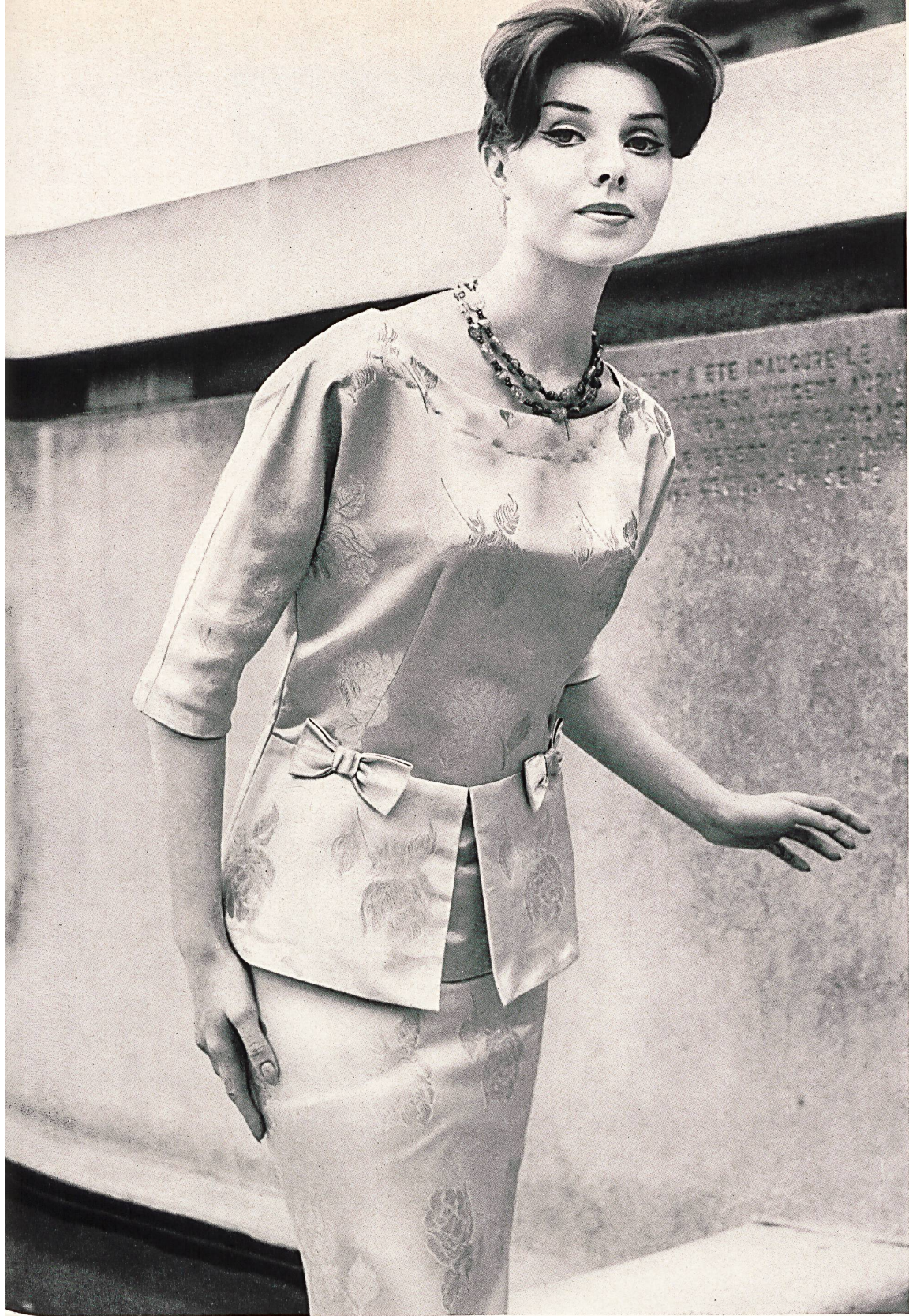
PIERRE CARDIN Duchesse façonné lamé, soie naturelle, de Soieries Stehli S. A., Zurich