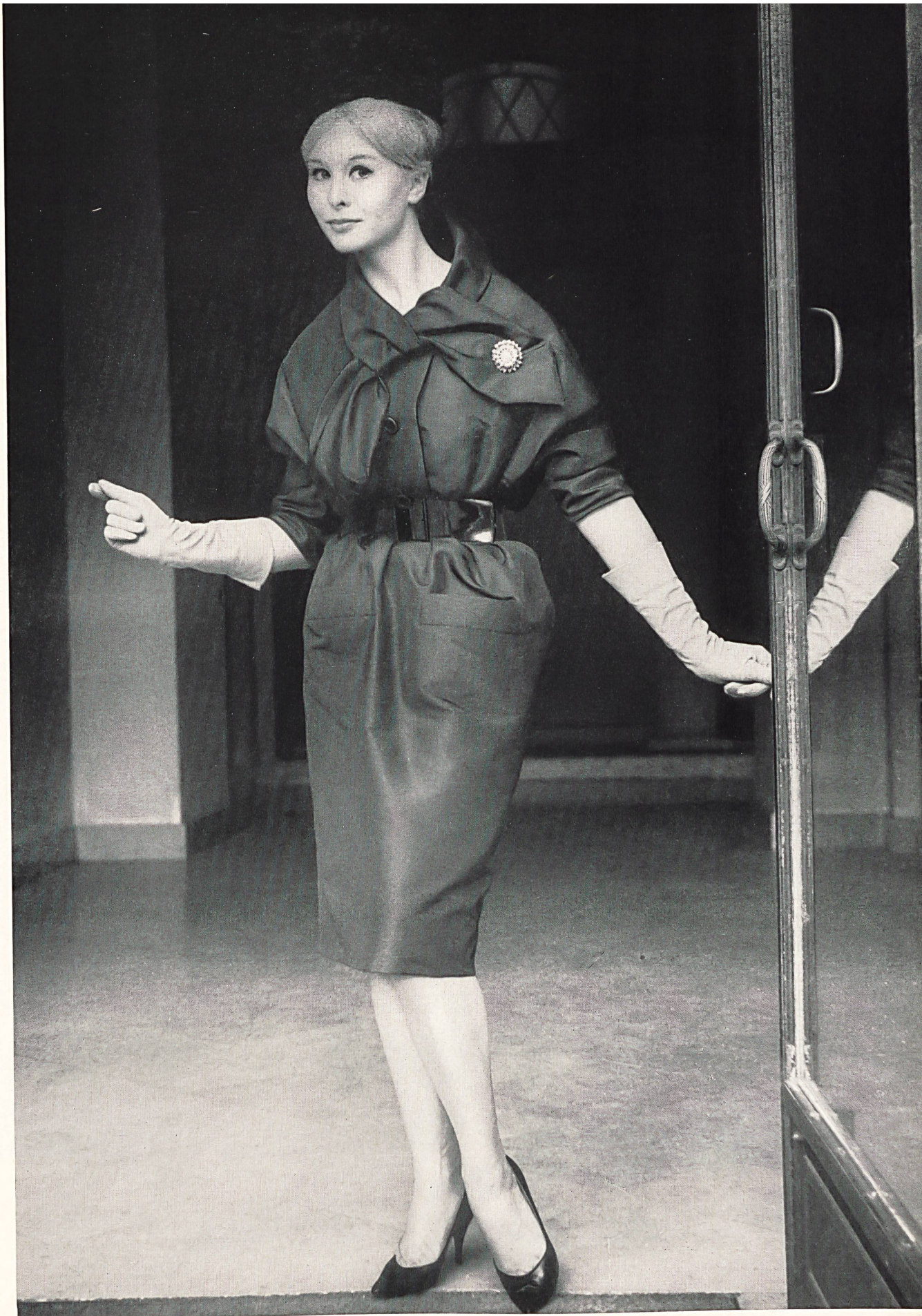
NINA RICCI Poult de soie de la S.A. Stünzi Fils, Horgen