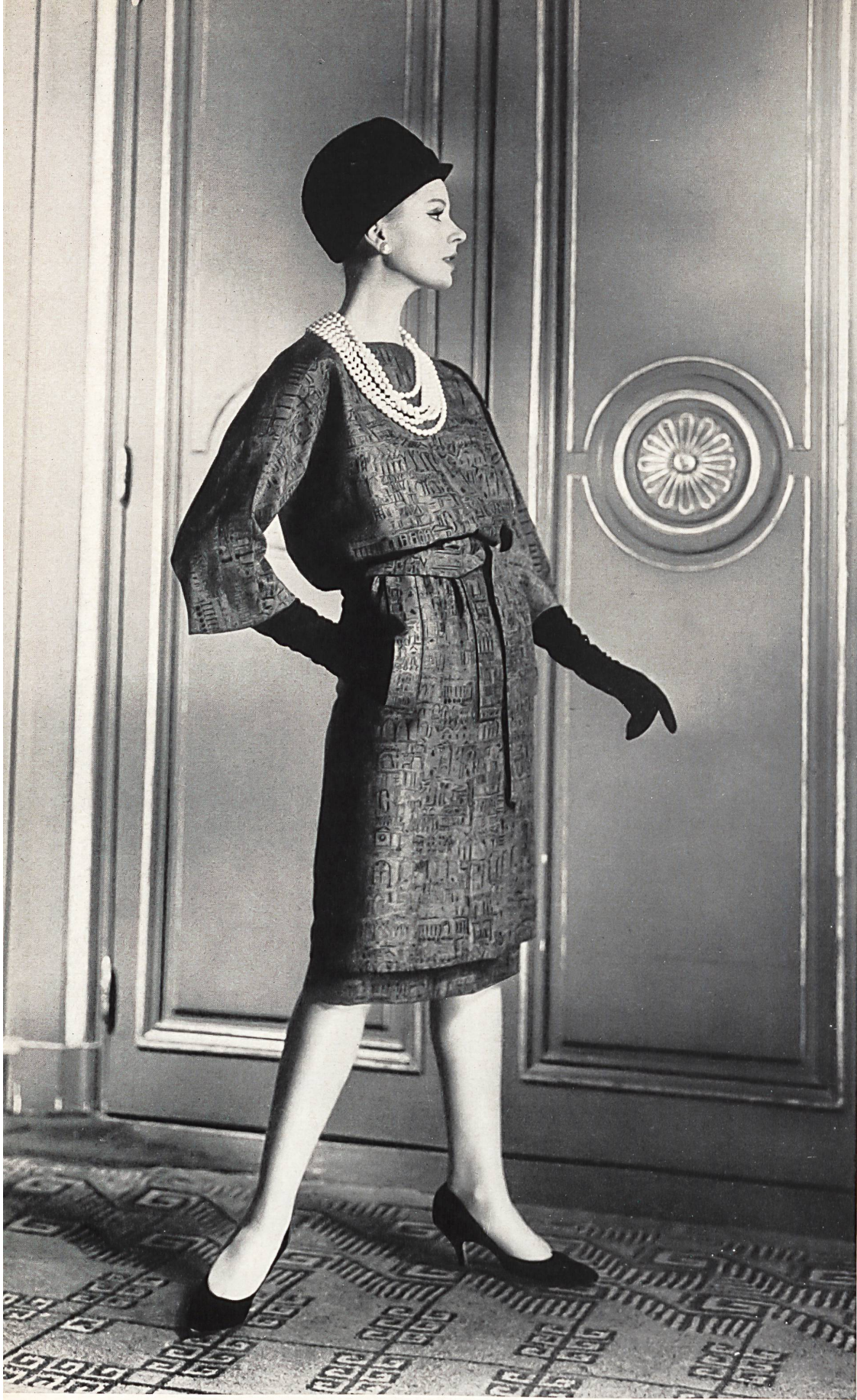
MICHEL GOMA Soielaine imprimée « Miranda » de Reichenbach & Co., Saint-Gall Distribué par Montex, Paris