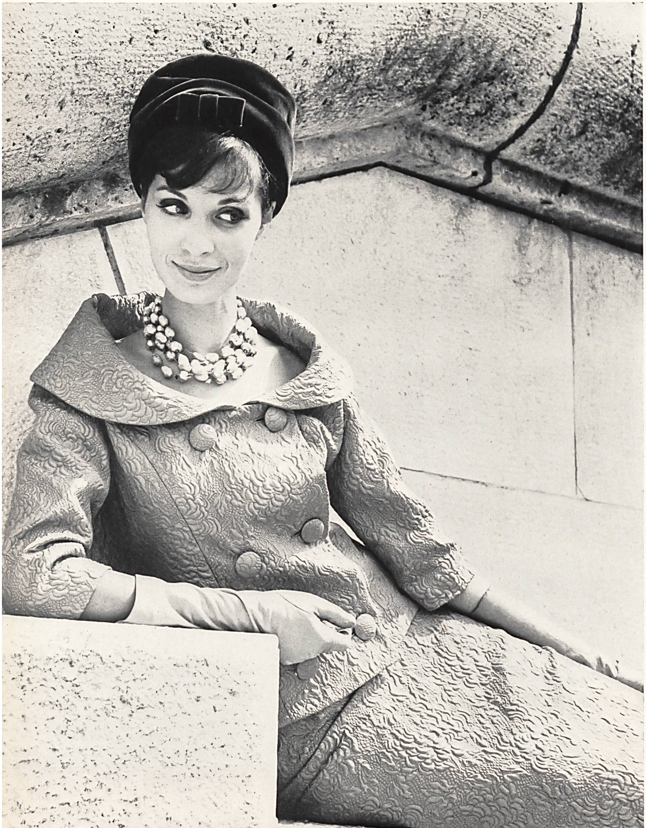
PIERRE CARDIN Façonné matelassé, soie naturelle, de Soieries Stehli S.A., Zurich