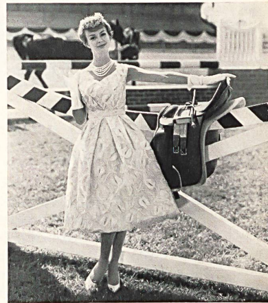
FORSTER WILLI & CO., SAINT-GALL

Bordado oruga sobre organdi Modèle Gack, Zurich