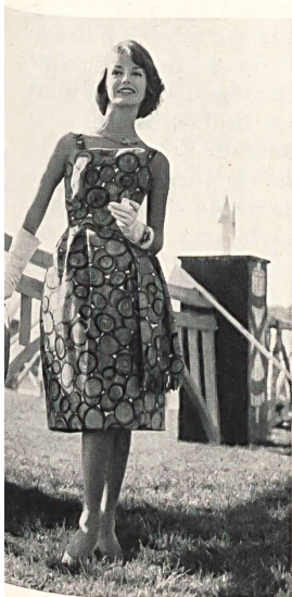
METTLER & CIE S. A., SAINT-GALL

Bordado oruga sobre organdi Modèle Gack, Zurich