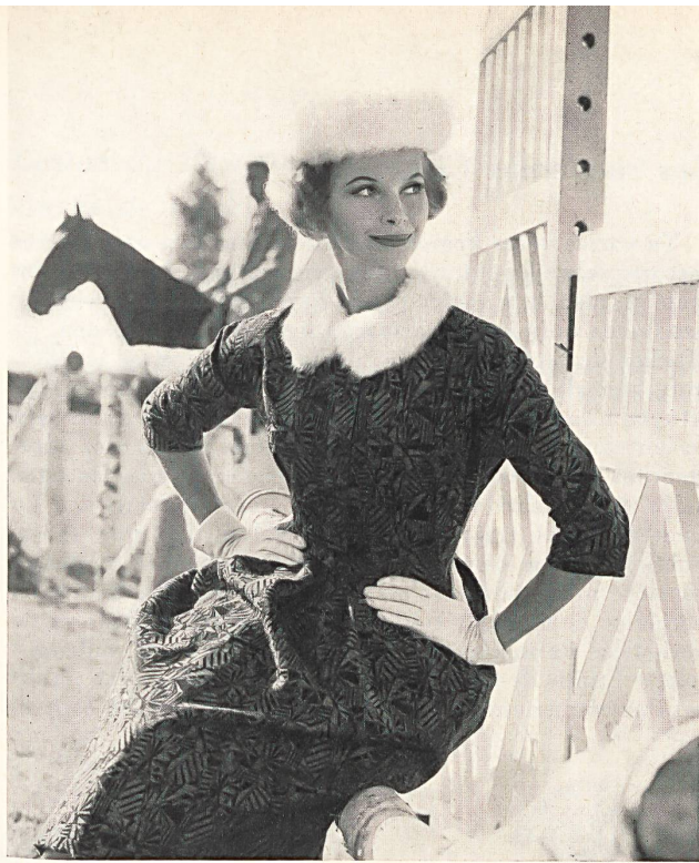
STOFFEL & CO., SAINT-GALL