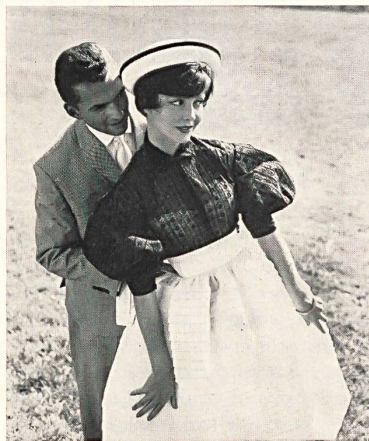
UNION S. A., SAINT-GALL

Porque San Galo combina siempre su gran acontecimiento deportivo con la presentación de las más bellas realizaciones de su industria. Así pues, como todos los años, tuvo lugar un desfile de maniqués en el hipódromo,