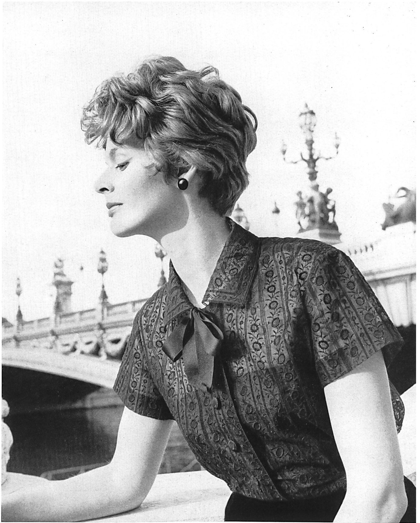
CHRISTIAN DIOR (Boutique) Organdi de soie noir brodé de Union S. A., Saint-Gall