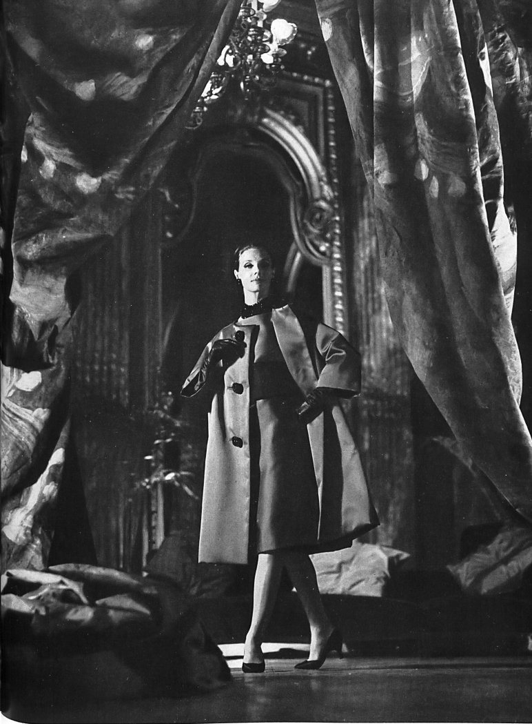
CHRISTIAN DIOR Ensemble et manteau en Satin double-face de L. Abraham & Cie, Soieries S. A., Zurich