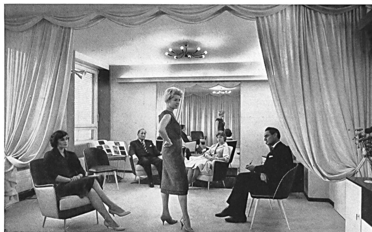
Presentación de modas en un salón particular