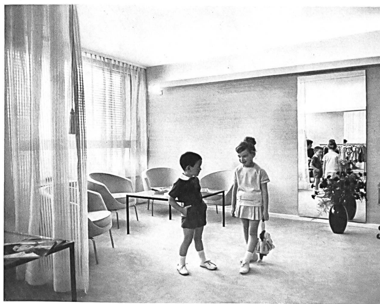
Vista de uno de los salones