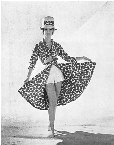
A. BLUM & CO, ZURICH

Conjunto de playa Tissu / fabric / tejido / Gewebe : Schweiz. Decken- & Tuch- fabriken Pfungen-Turben- thal A.-G., Pfungen