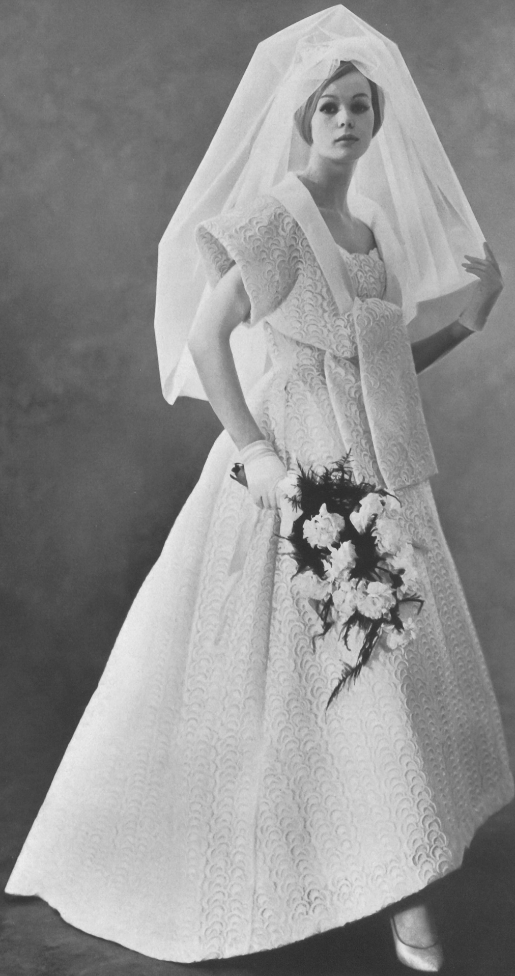
Modèle GACK, ZURICH Photo Rév