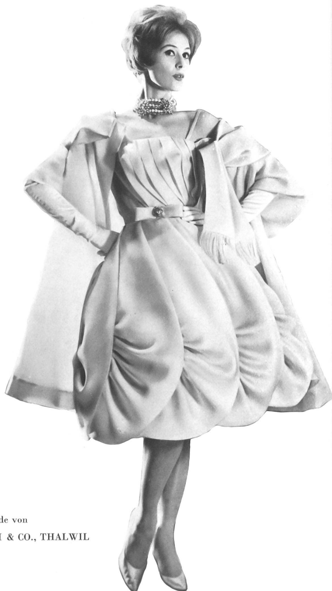
Modèle GACK, ZURICH

Satin organdi pure soie de Pure silk organdy satin by Raso organdi pura seda de Organdy Satin aus reiner Seide von