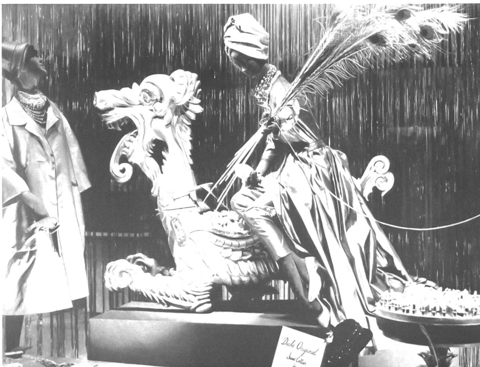
La vitrine du magasin de Lilly Daché à New York The window display of the Lilly Daché shop in New York