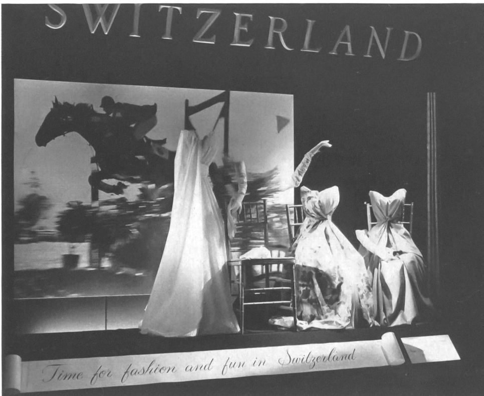
Office National Suisse du Tourisme La vitrine du bureau des Chemins de fer suisses à New York Swiss National Tourist Office The window display at the Swiss Federal Railroads Office in New York

de realce sobre un fondo de terciopelo negro y contrastando con una instantánea tomada en un concurso hípico, se ve tres espectadoras imaginarias, incorpóreas, tan sólo representadas por sus vestidos (véase la ilustración adjunta). De izquierdas a derechas, son tres vestidos largos de noche, el primero, de cremoso bordado « Nelo » de