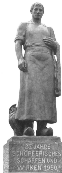
El Tintorero, estatua que adorna la fuente Heberlein en Wattwil