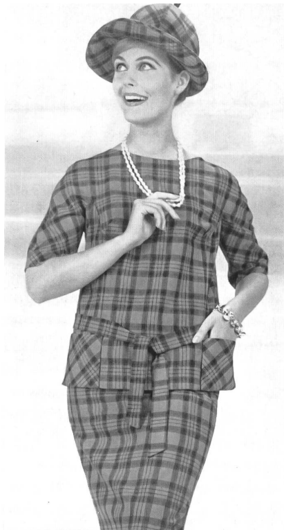
«ZURRER» WEISBROD-ZURRER FILS, HAUSEN s. A.

Orlon/rayonne Modèle : Brüllmann & Co., Zurich