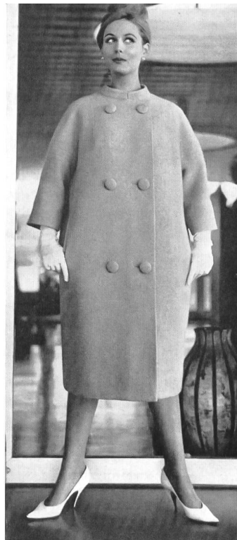
SCHMID A.G., GATTIKON Orlon/laine Modèle : Arthur Schibli S. A., Genève

Orlon/rayonne Modèle : Brüllmann & Co., Zurich