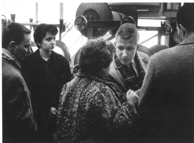
Periodistas visitando una tejeduría de algodón. (Meyer-Mayor Söhne, Neu St. Johann)