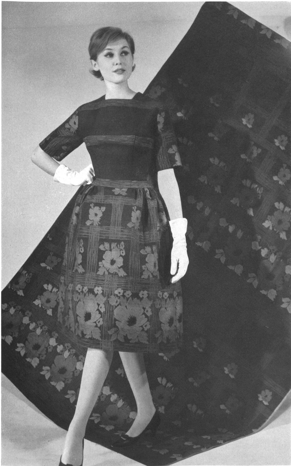
MAX KIRCHHEIMER FILS & CIE, ZURICH Coton d'hiver, dessin Jacquard d'un genre nouveau Winter cotton in a new style Jacquard design Algodón de invierno con dibujo Jacquard de estilo nuevo Winter cotton in neuartigem Jacquard dessin. Modèle Willy Meyer S.A., Zurich