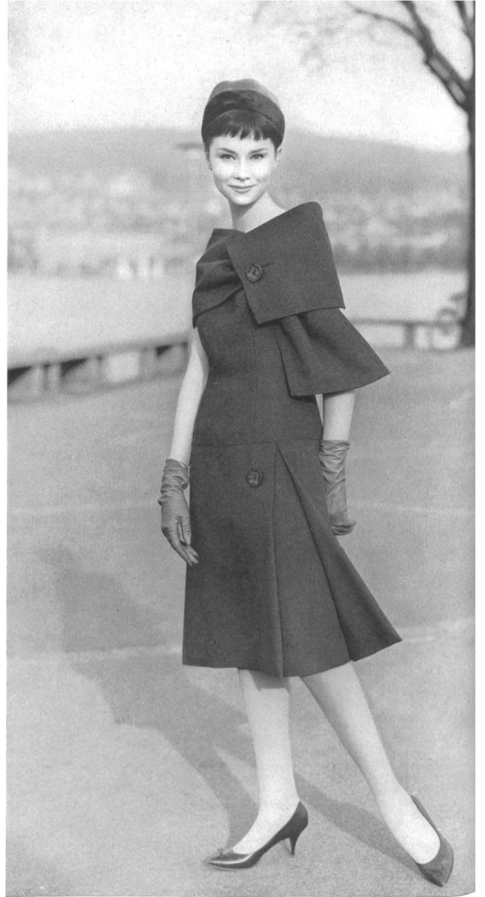
HEER & CIE S.A., THALWIL Rêve de Térylène Modèle Eugen Braunschweig S.A., Zurich