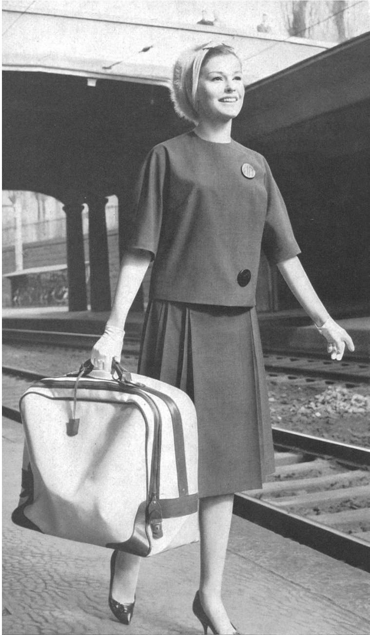
HEER & CIE S.A., THALWIL Rêve de Térylène Modèle R. Cafader & Cie S.A., Zurich