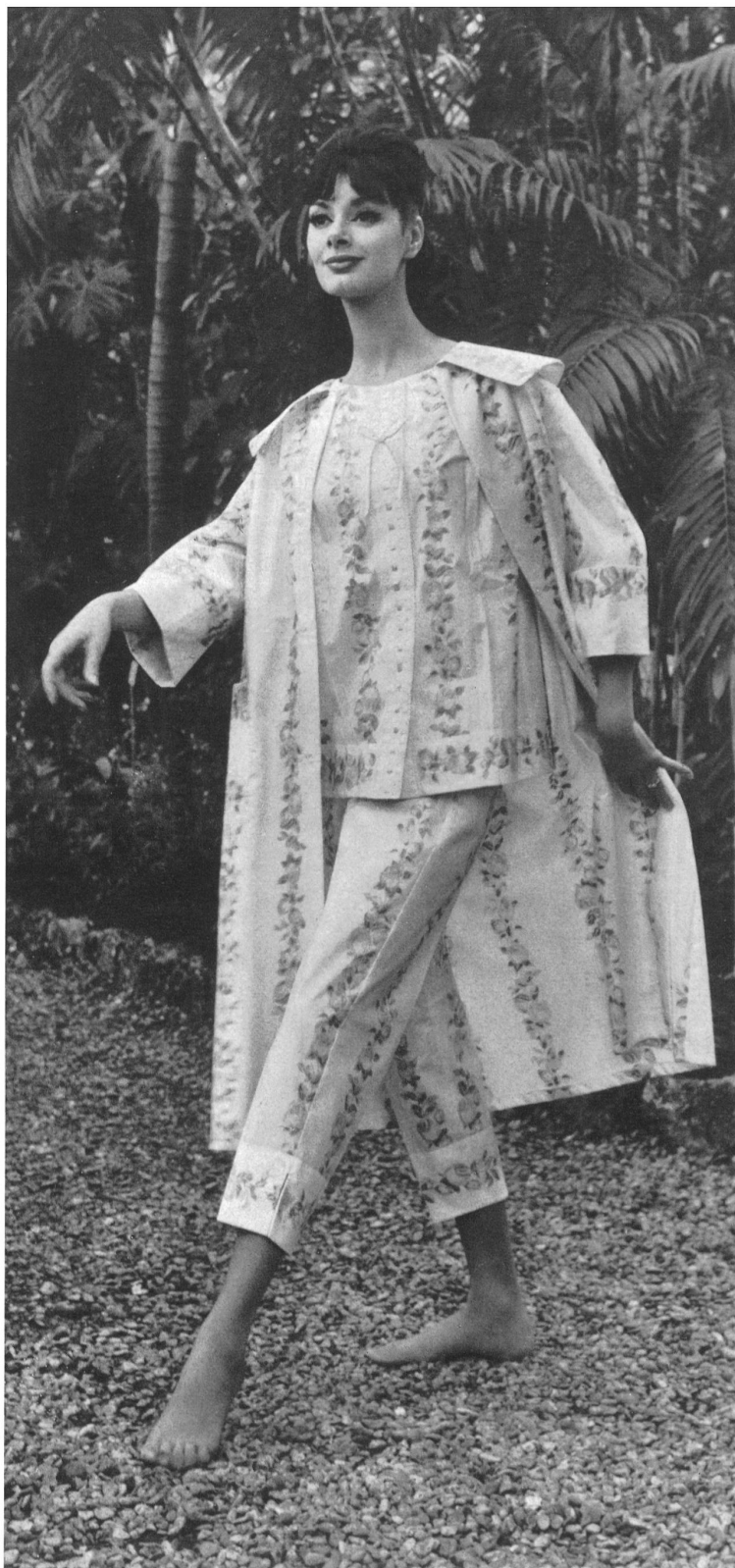
J. G. NEF & CO., S. A., HERISAU Tissu de coton Minicare imprimé — Printed Minicare cotton fabric — Tejido de algodón Minicare estampado — Be- drucktes Minicare Baumwollgewebe Modèle Leumann, Boesch & Co. S. A., Kronbühl, « MINICARE », Joseph Bancroft & Sons Co. A.G., Zurich