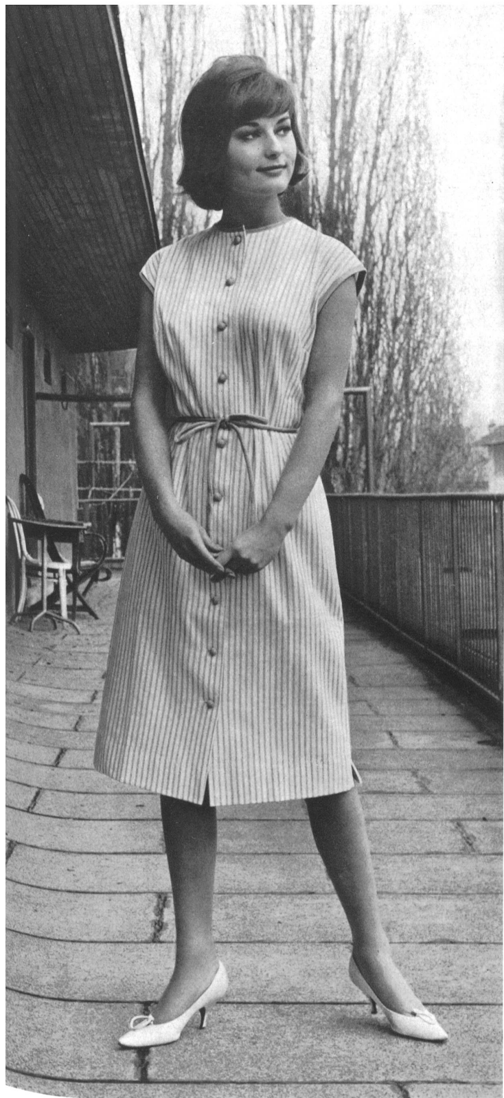
« YALA », JAKOB LAIB & CO., AMRISWIL Jersey de coton Minicare — Minicare cotton jersey — Jersey de algodón Mini- care — Minicare Baumwolljersey « MINICARE », Joseph Bancroft & Sons Co. A.G., Zurich