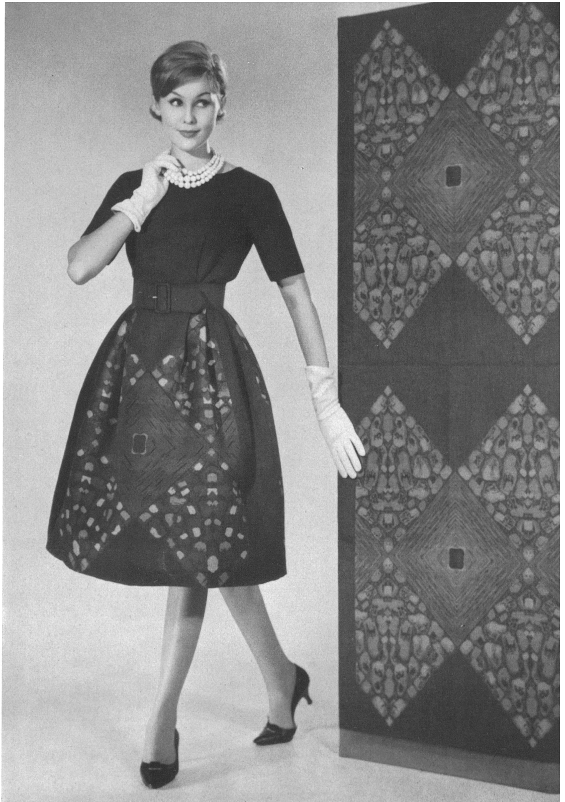
MAX KIRCHHEIMER FILS & CIE, ZURICH Coton d'hiver, dessin Jacquard d'un genre nouveau Winter cotton in a new style Jacquard design Algodón de invierno con dibujo Jacquard de estilo nuevo Winter cotton in neuartigem Jacquard dessin Modèle Cortesca S.A., Zurich