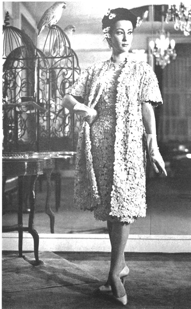
UNION S.A., SAINT-GALL Guipur estilo cordoncillo amarilla Modèle Fred Spillmann, Bâle