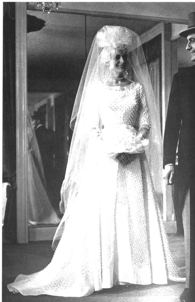
UNION S.A., SAINT-GALL Organdi blanco bordado Modèle Fred Spillmann, Bâle