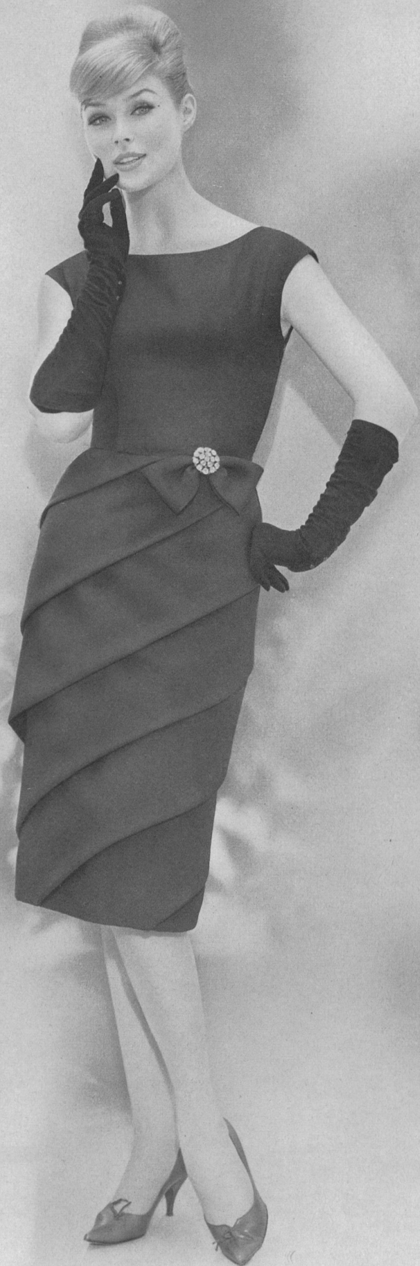
CUBEGA S.A., ZURICH « Cascade », Satin soie et laine / Silk and wool satin / Satén de seda y lana / Satin aus Seide und Wolle Modèle Eugen Braunschweig A.G., Zurich