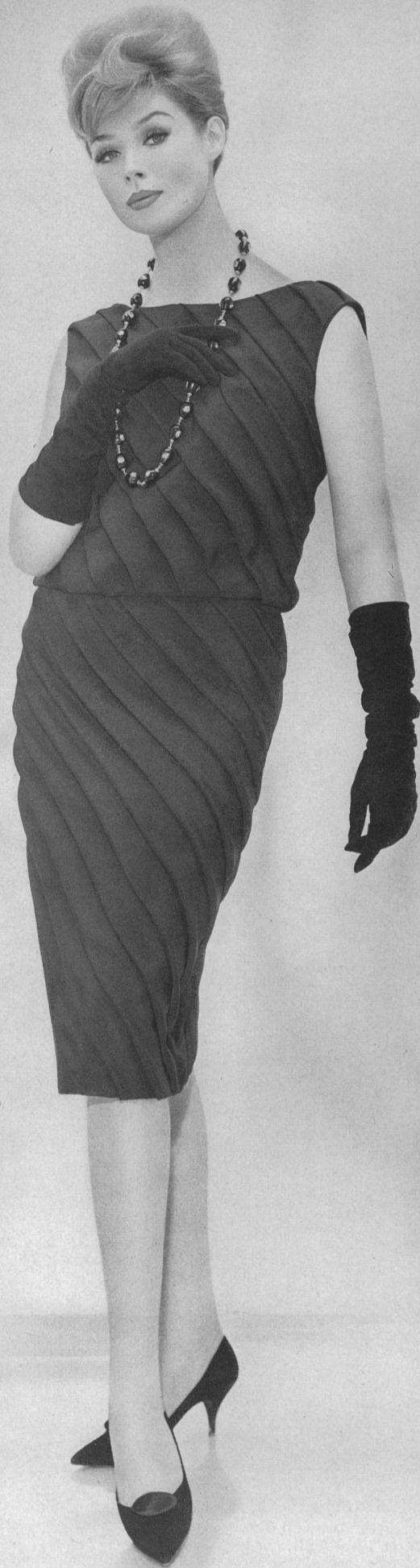
ROBT. SCHWARZENBACH & CO., THALWIL Mousse de soie Modèle Eugen Braunschweig A.G., Zurich