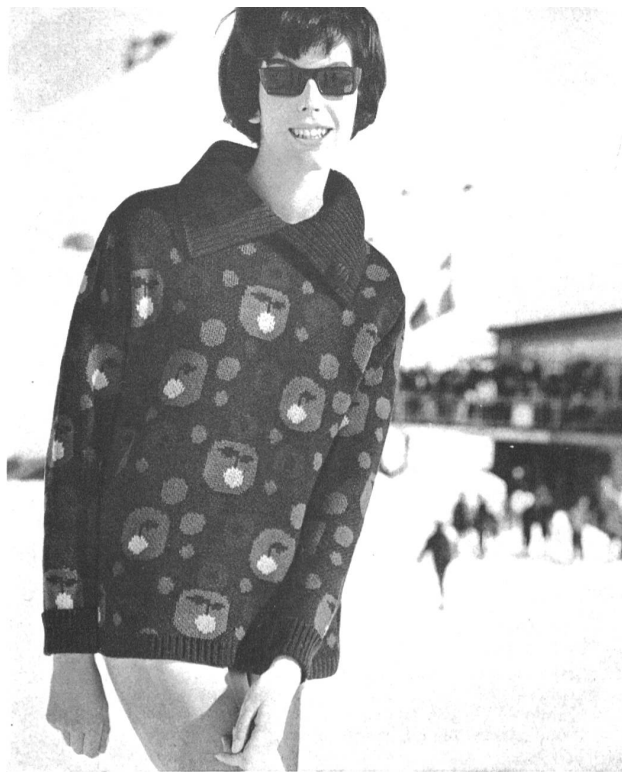
Pulóver de esquí, con dibujo jacquard moderno, cuello de moda que puede llevarse abierto o cerrado

Medio siglo al servicio de la fabricación de artículos de punto basta para crear ciertas obligaciones. Por lo tanto, no puede extrañar que los productos de esta empresa sean conocidísimos, y no sólo por su calidad, sino también por lo exclusivos y por lo originales que son sus modelos. En su programa de fabricación están incluídos actualmente los vestidos de punto para señora y caballero, al estilo de moda, empezando por los pequeños pulóveres y las chaquetas « fully fashioned », hasta los pulóveres y chaquetas para los deportes en los que están admitidas todas las audacias, sin olvidar los modelos clásicos parcialmente combinados con piel de ante de superior calidad, los pulóveres de esquiar de una elegancia muy refinada y los vestidos, los dos piezas y los trajes de punto de lo más elegante. Hemos de añadir que « Tanner » pasa por ser uno de los mejores productores de prendas de punto completamente disminuídas. En 1954 esta fábrica recibió una enorme máquina « Cotton » moderna que puede producir series de pulóveres y de chaquetas tan finas como cálidas, completamente disminuídas. Además de estos mastodontes modernos que no recuerdan en lo más mínimo al punto de calceta hecho a mano, esta empresa posee además, en su fábrica de San Galo/Bruggen, un parque muy bien surtido de máquinas perfeccionadas para la fabricación de toda clase de artículos del ramo. En unos