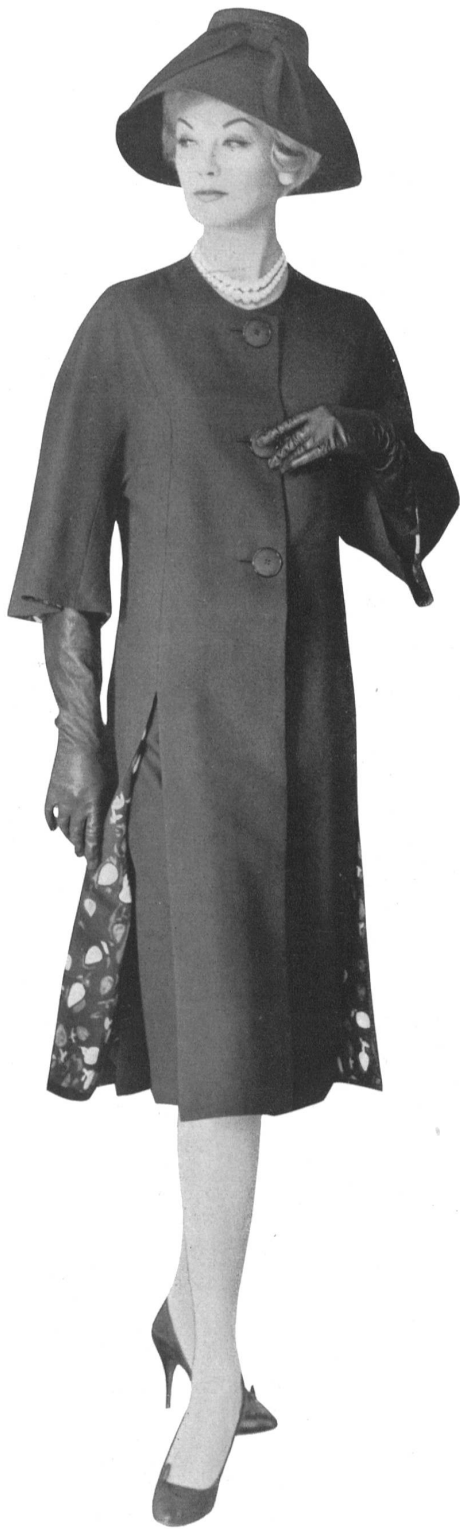
« ZURRER », WEISBROD-ZURRER FILS, HAUSEN s. A.

Tissu soie sauvage — Raw silk fabric Modèle Irène, Los Angeles Fabric distributed by K. Myer, Mill Valley (Cal.)