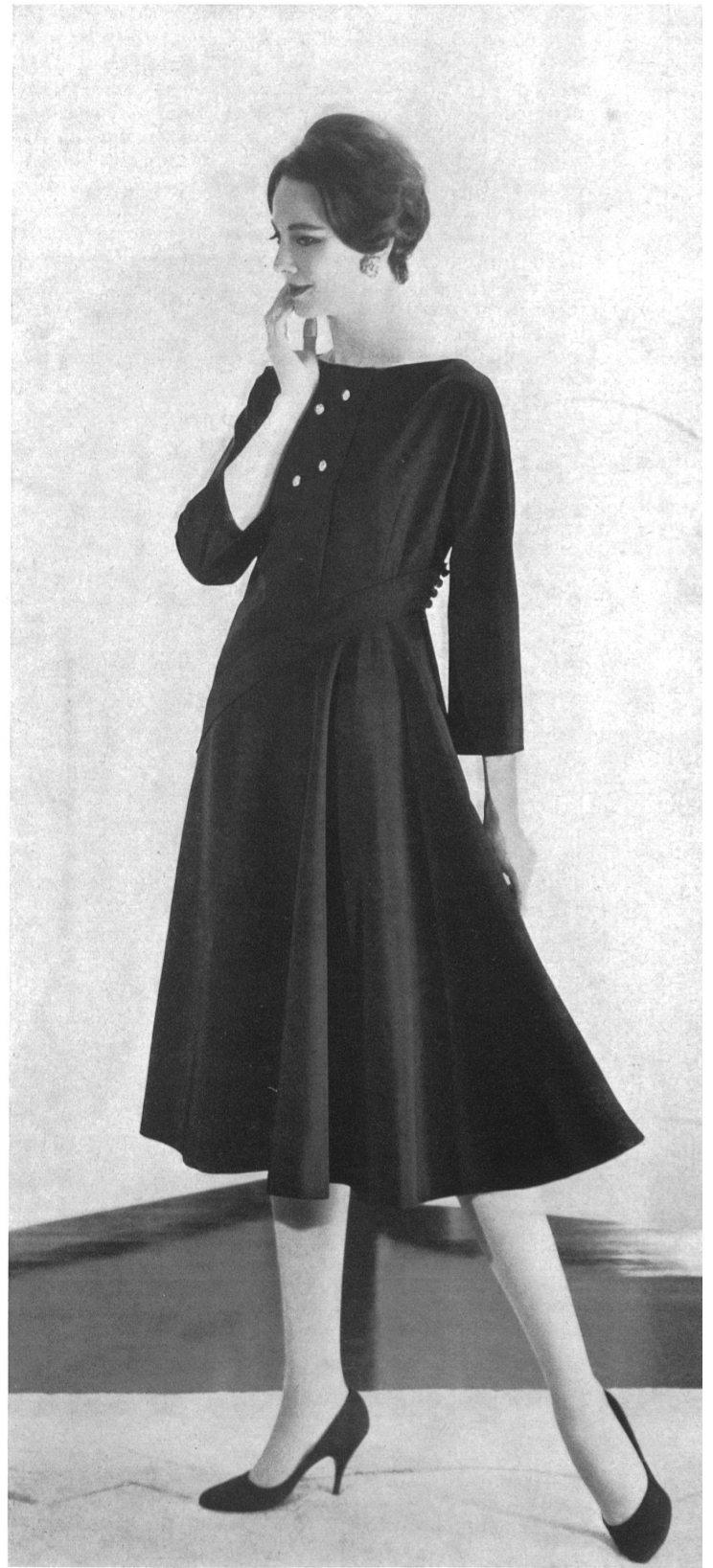
« ZURRER », WEISBROD-ZURRER FILS, HAUSEN s. A.

Tissu soie sauvage — Raw silk fabric Modèle Irène, Los Angeles Fabric distributed by K. Myer, Mill Valley (Cal.)