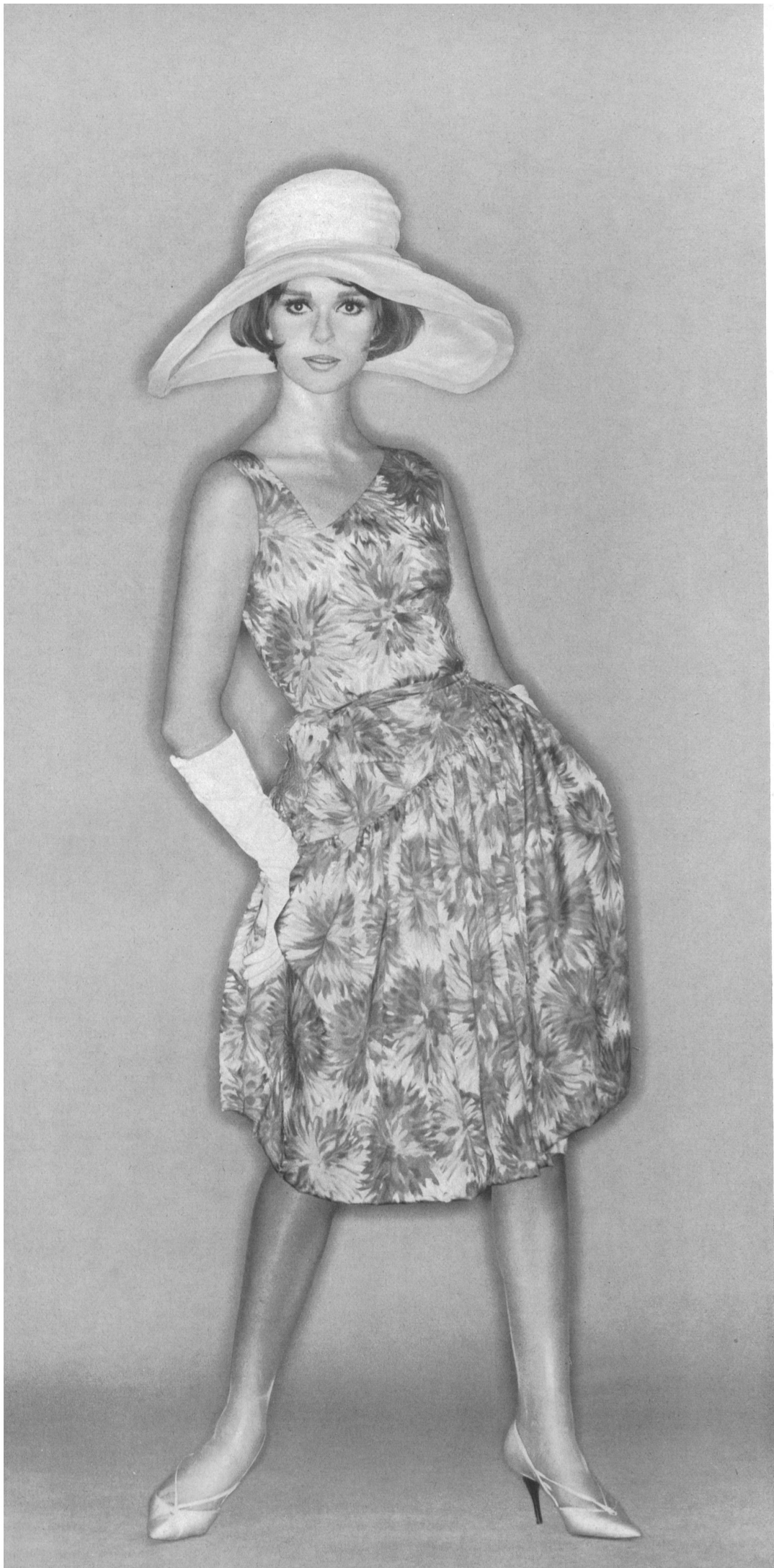
MAGGY ROUFF Tissu pure soie «Manina» de Robt. Schwarzenbach & Co., Thalwil