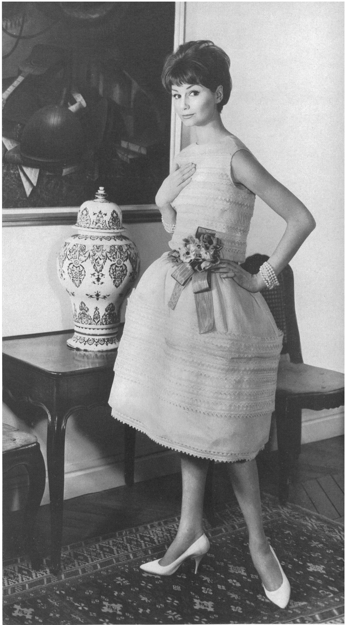
CHRISTIAN DIOR Organdi brodé de Forster Willi & Co., Saint-Gall