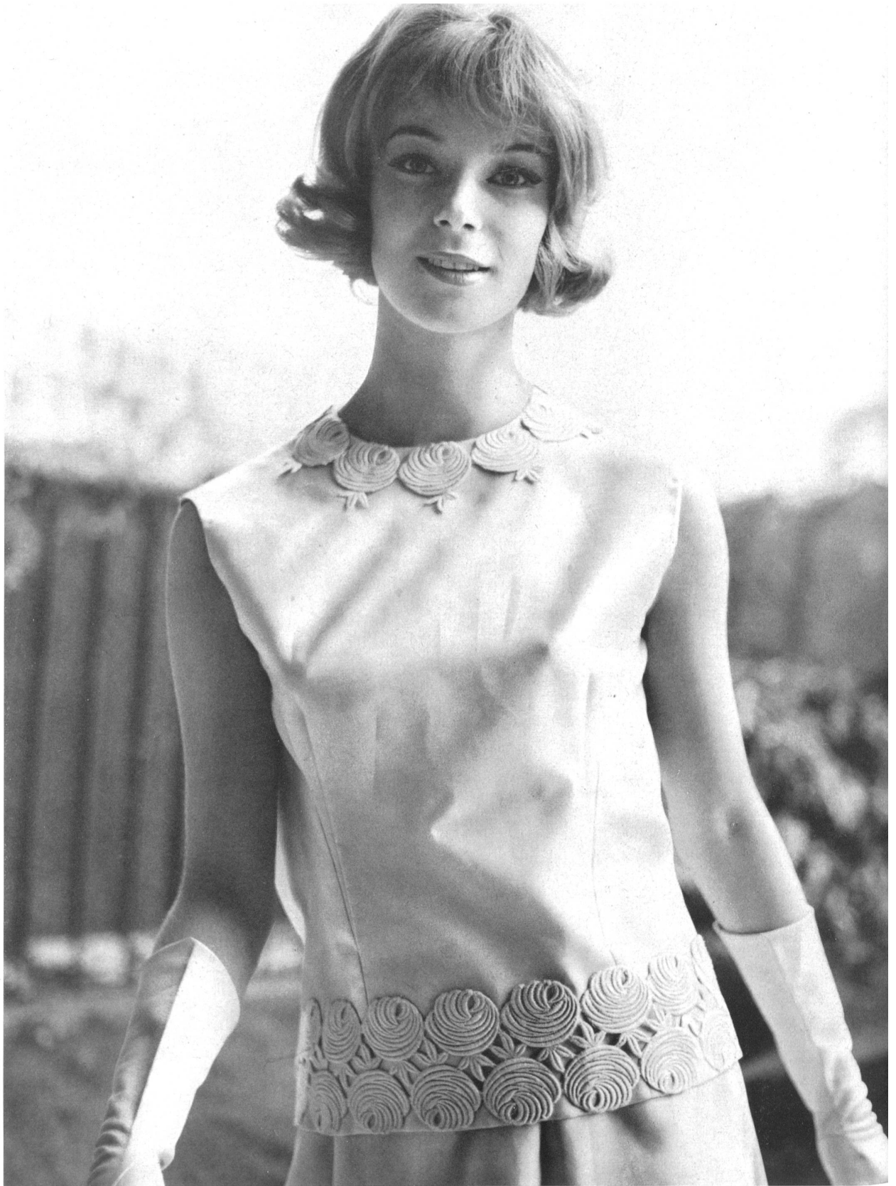
BERNARD SAGARDOY Bande de guipure de Jacob Rohner S. A., Rebstein