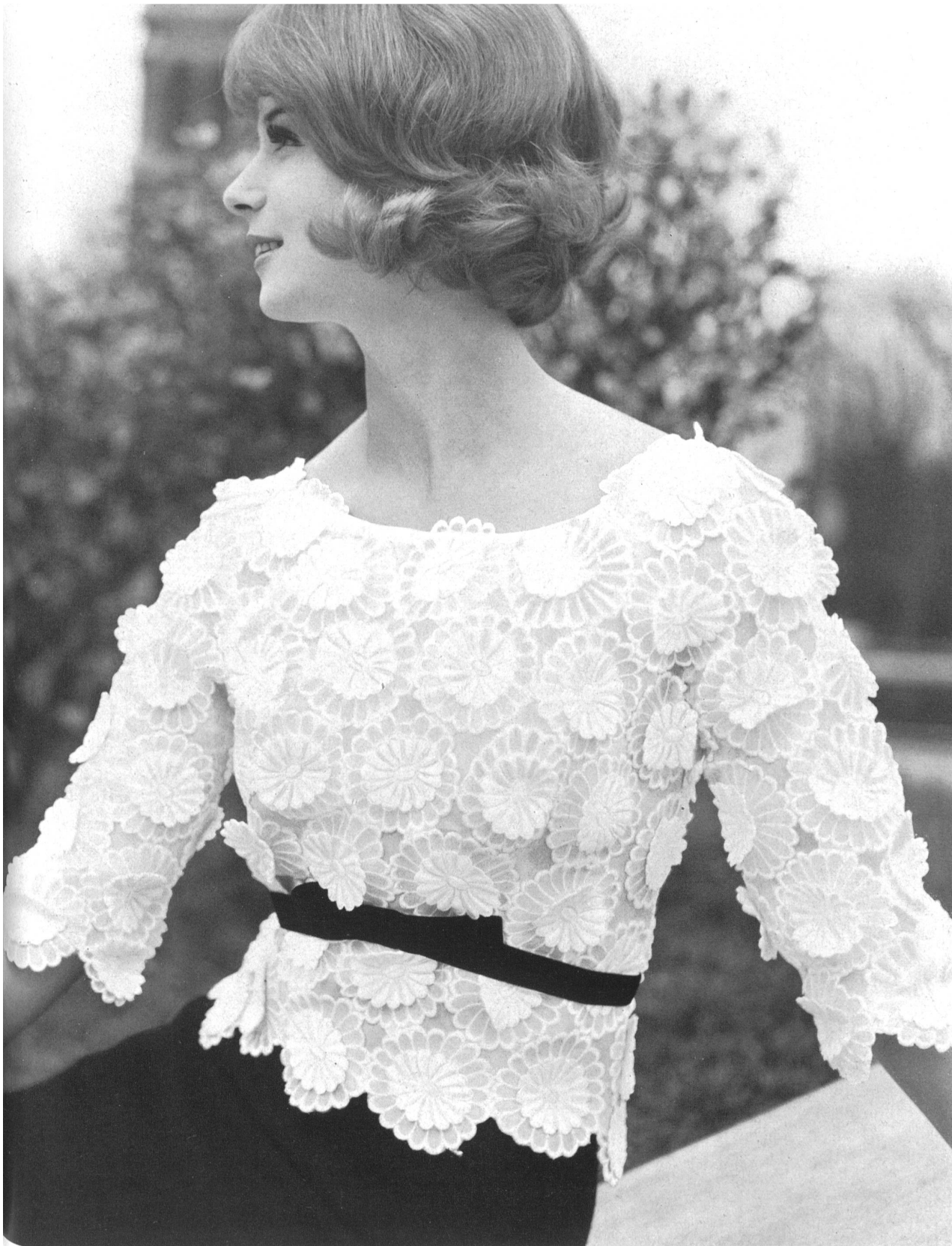
JACQUES HEIM Broderie «Nelo» appliquée sur organdi de J. G. Nef & Co. S. A., Hérisau