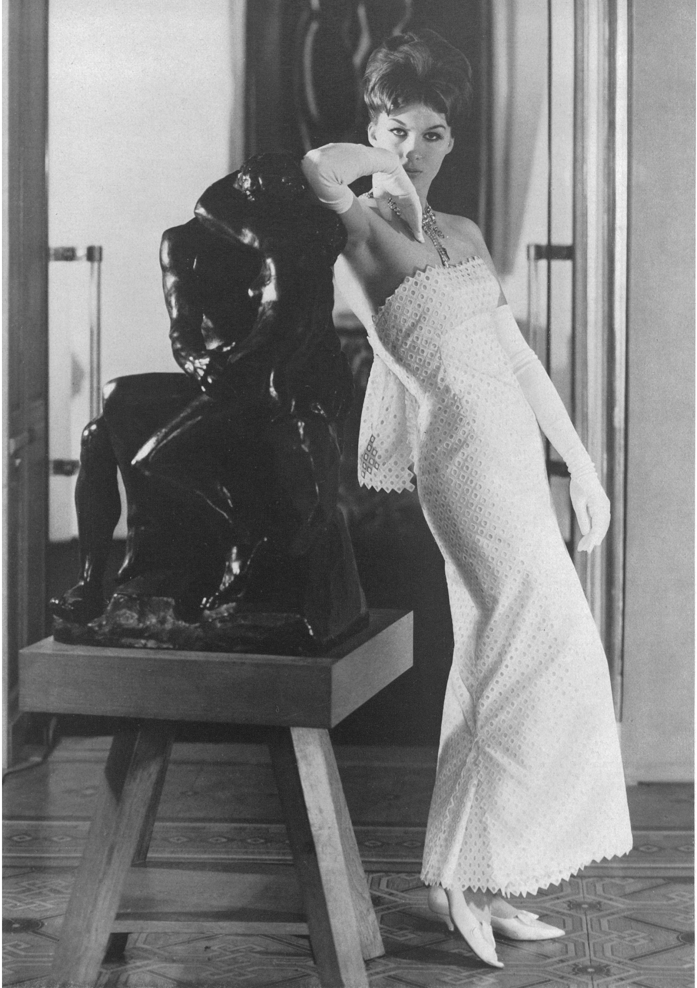
CARVEN Linen brodé de Forster Willi & Co., Saint-Gall Grossiste à Paris: Pierre Brivet S. à r. l.