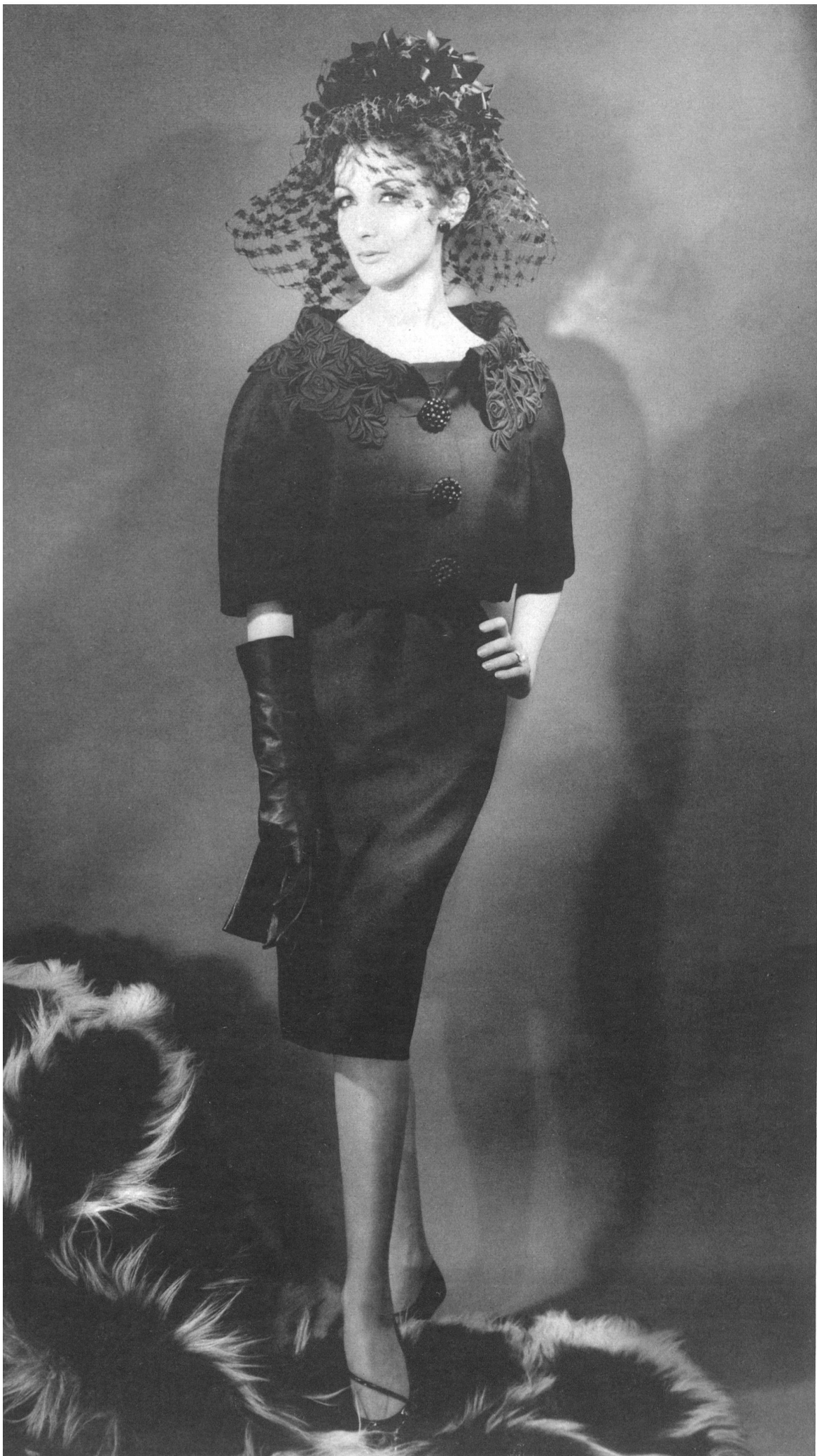
BERNARD SAGARDOY Broderie noire découpée de Union S. A., Saint-Gall Grossiste à Paris: Robert Burg & Cie