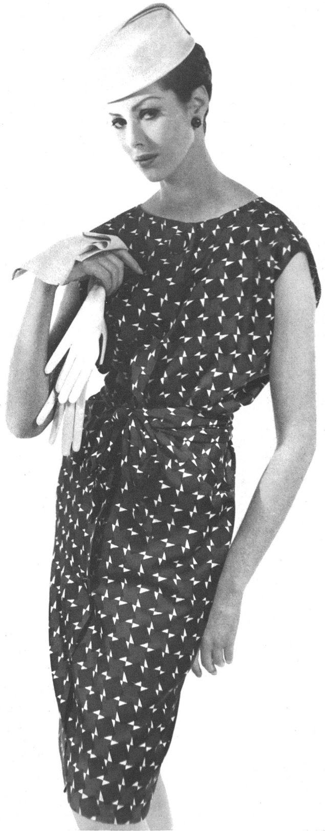
HUBERT DE GIVENCHY