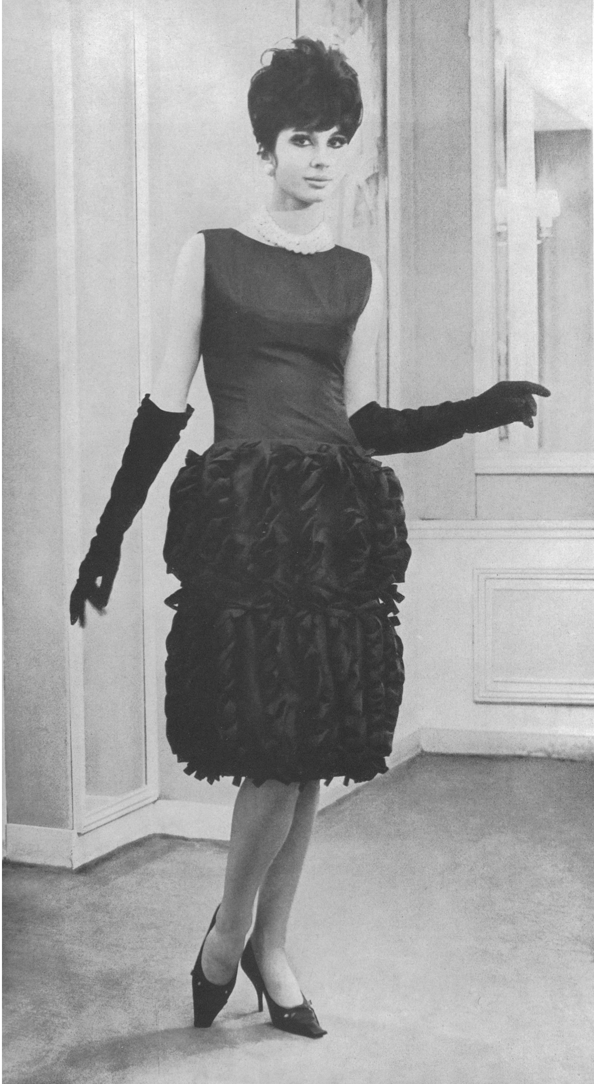
CHRISTIAN DIOR Taffetas de soie de la S. A. Stünzi Fils, Horgen