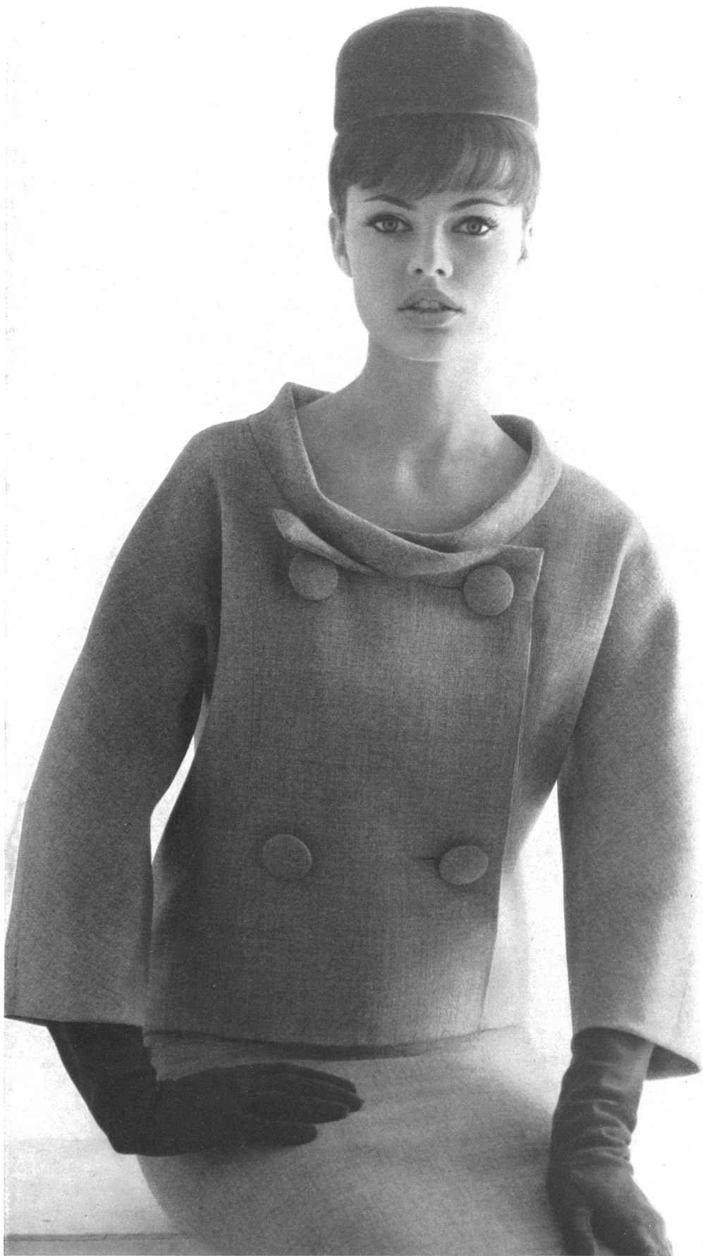
PIERRE CARDIN « Shetty fashion fil » des Tissages de soieries Naef Frères S. A., Zurich