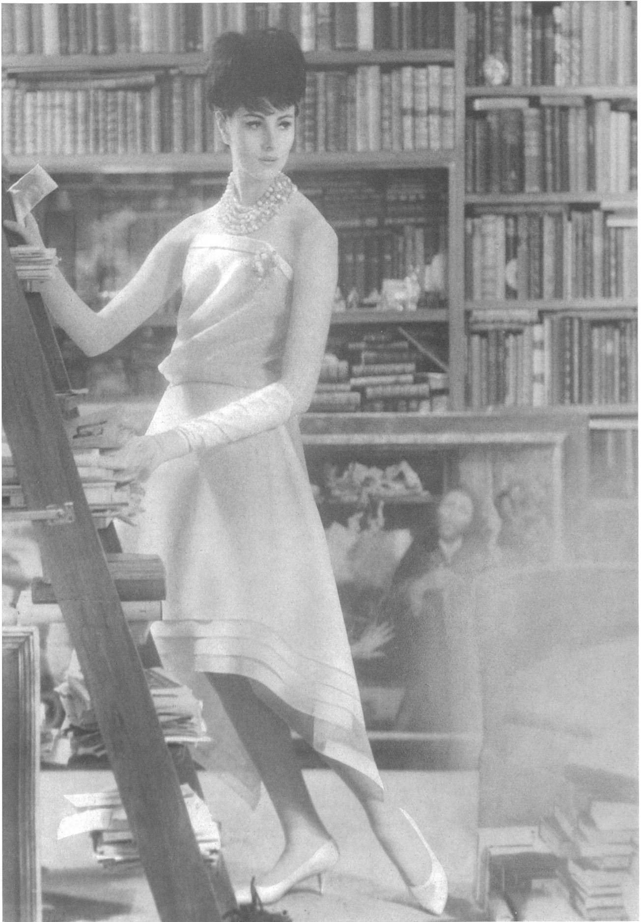
CHRISTIAN DIOR « Basra » de L. Abraham & Cie, Soieries S. A., Zurich