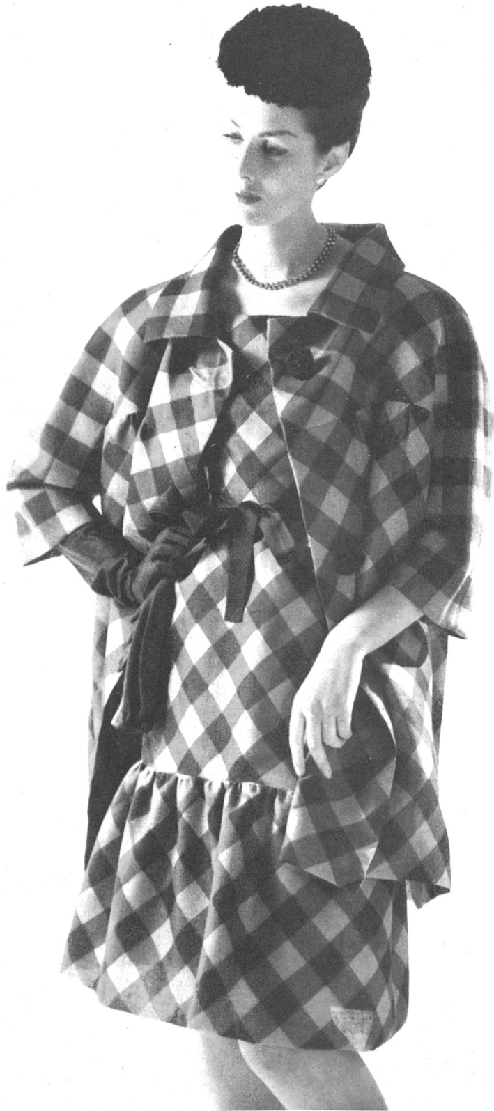
HUBERT DE GIVENCHY