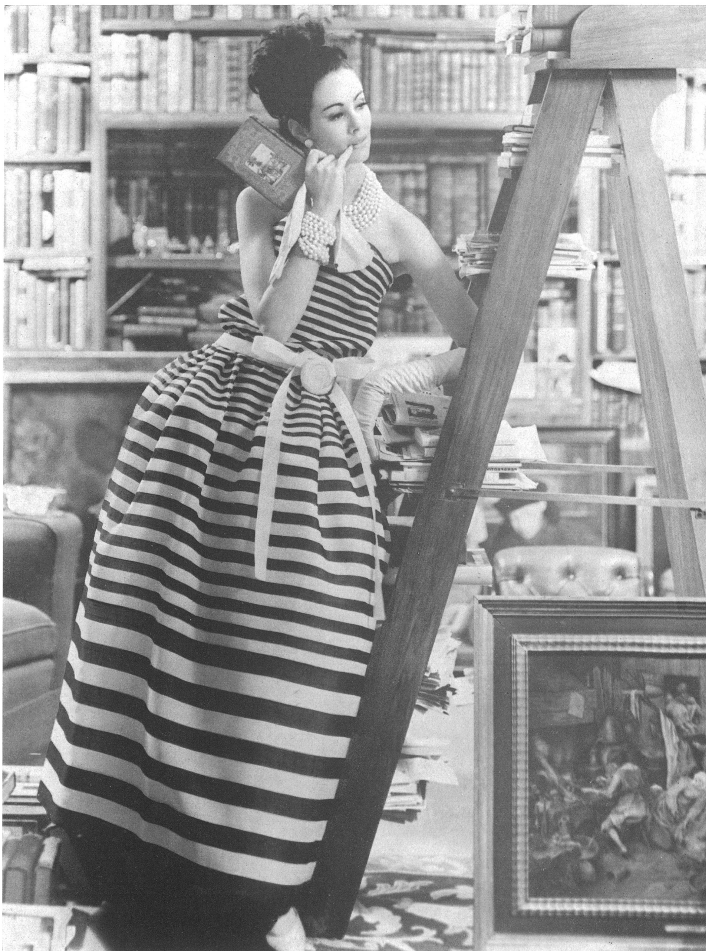
CHRISTIAN DIOR « Gazar » rayé de L. Abraham & Cie, Soieries S. A., Zurich