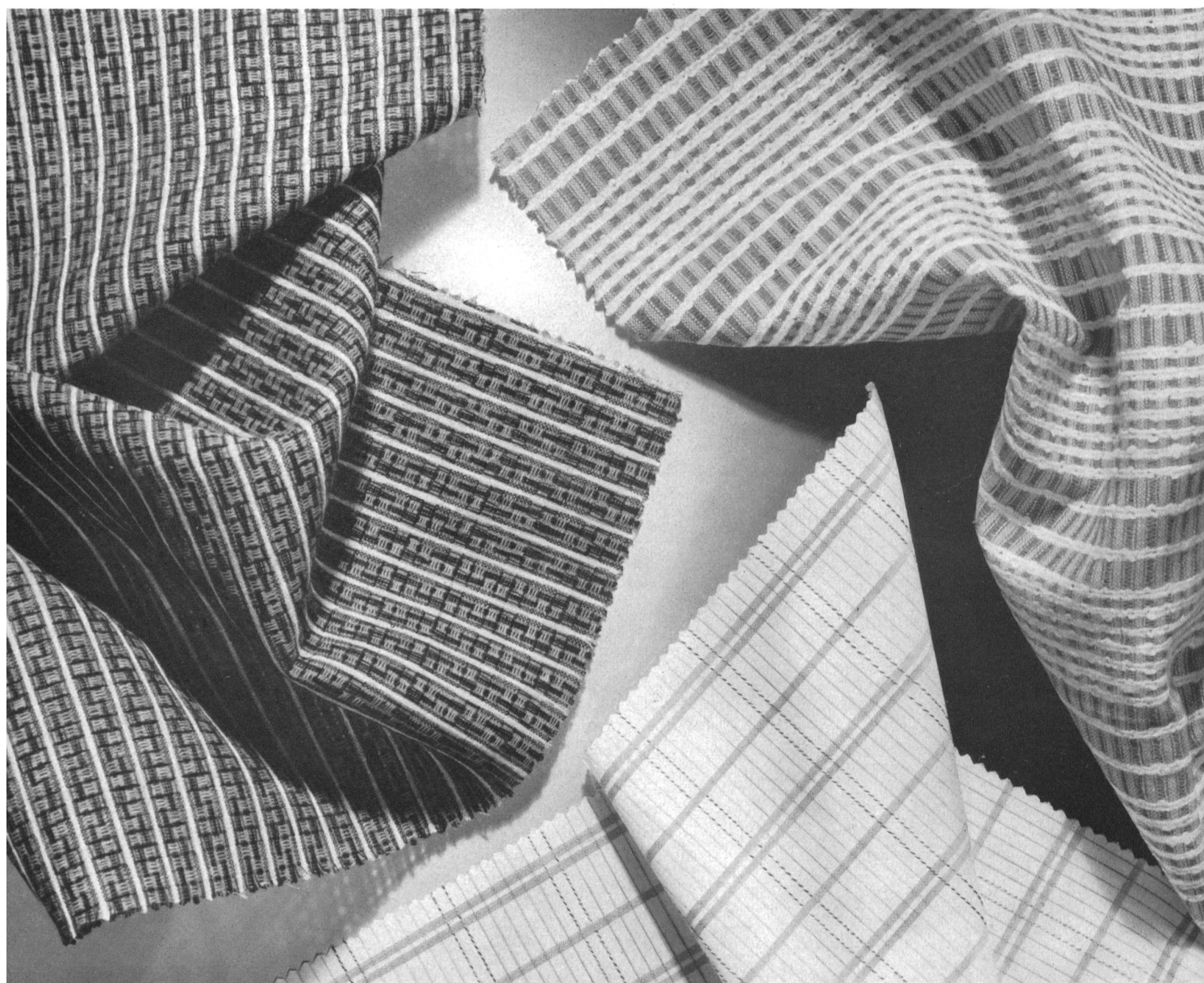
HONEGGER & CIE S. A., SAINT-GALL Tissus de coton modernes pour chemises de sport Fashionable cotton fabrics for sport shirts Tejidos de algodón modernos para camisas de deporte Moderne Baumwollgewebe für Sporthemden