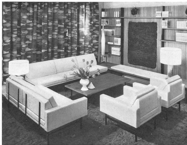
Un beau rideau en tissu de coton imprimé suisse, exposé chez Idealheim S. A., Bâle.

Ya es sabido que, independientemente de la boga siempre renovada del bordado suizo, los continuos esfuerzos de los productores para hacer del algodón un tejido noble, tan agradable de usar como elegante, han desarrollado considerablemente la importancia económica de este ramo. En 1961, la exportación suiza de productos de algodón llegó a los 379 millones de francos suizos ($ USA = 88,6 millones) de los cuales un poco más de la tercera parte consistía en bordados. Durante el mismo año, Suiza ha exportado más de 4800 toneladas de hilos y torzales de algodón, mitad y mitad de cada clase, y 7474 toneladas de bordados y de tejidos de algodón. La hilatura de algodón ocupa en Suiza 1,3 millones de husos y la torceduría ot ros 350.000, mientras que funcionan