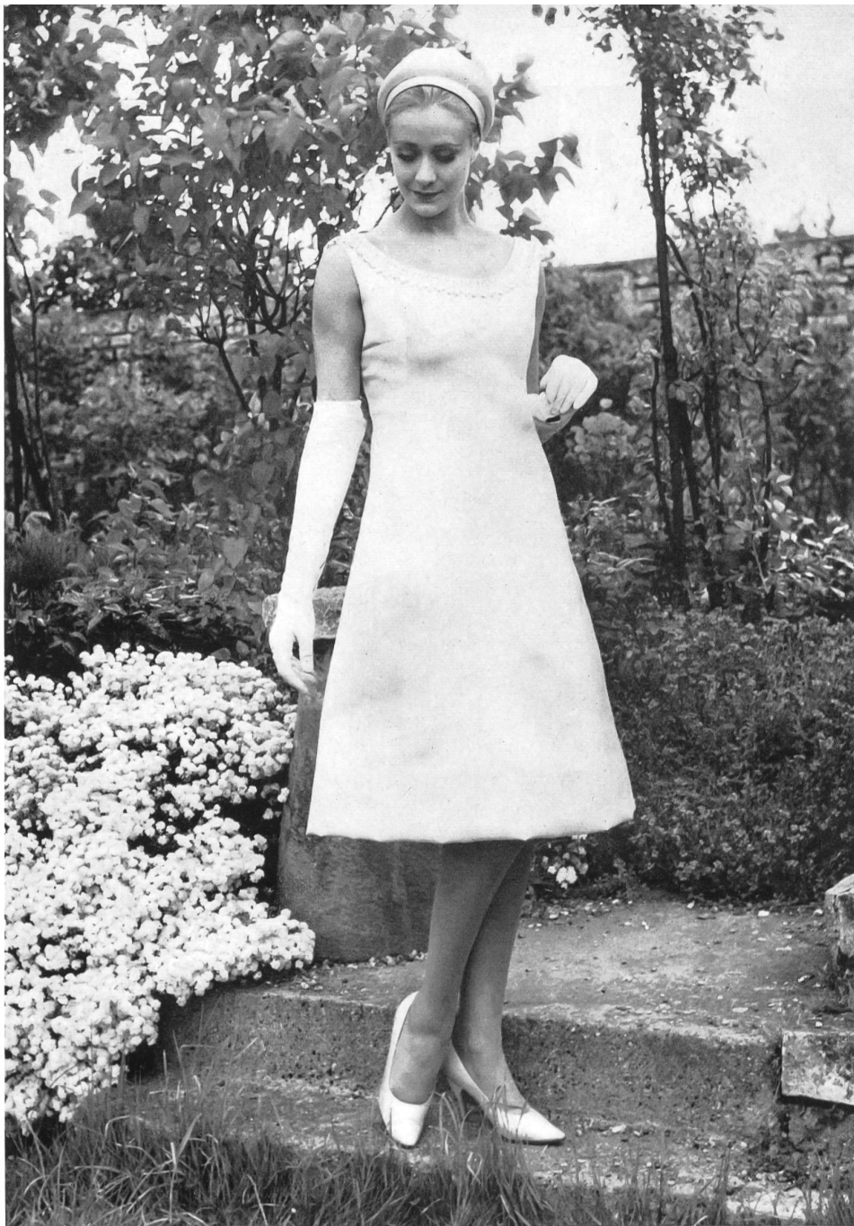
L. ABRAHAM & CIE, SOIERIES S.A., ZURICH Satin double-face Modèle Christian Dior Ltd., Londres

un gorro alto de leopardo con una confortable corbata alta así como un accesorio de peletería poco común, pero útil, un tapabocas de « renard » gris pálido. Los vestidos de seda eran más bonitos que nunca e ilustraban muy bien la comprensión de Paterson frente a las exigencias de la vida actual. Sus vestidos hacen soñar despierta y le gustaría a una llevarlos puestos, y cuando dice: « Yo creo para las circunstancias y las exigencias de la vida contemporánea y para esta era del twist », se conoce que sabe lo que se hace. Su mujer, rubia y alegre, está asociada a su negocio de Albermarle Street; forman así un equipo de « rompe y rasga » en el mundo de la moda.