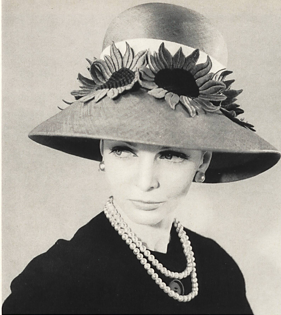
JEANNE LANVIN (DEVAUX) Motifs brodés deux couleurs de Union S. A., Saint-Gall Grossiste à Paris : Robert Burg & C