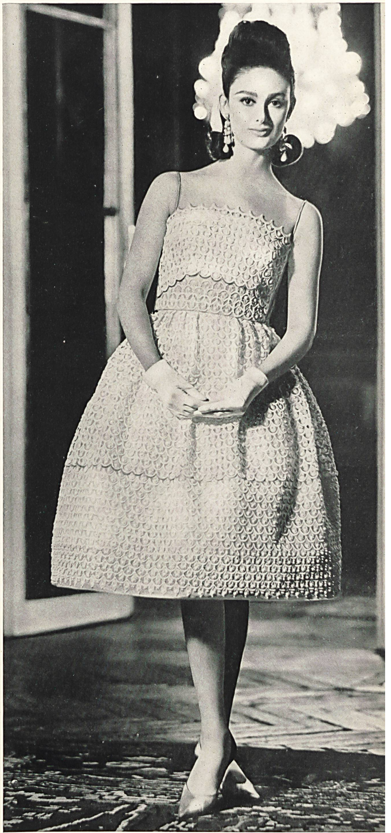
CARVEN Volant de guipure de Forster Willi & Co., Saint-Gall Grossiste à Paris : Robert Burg & Cie