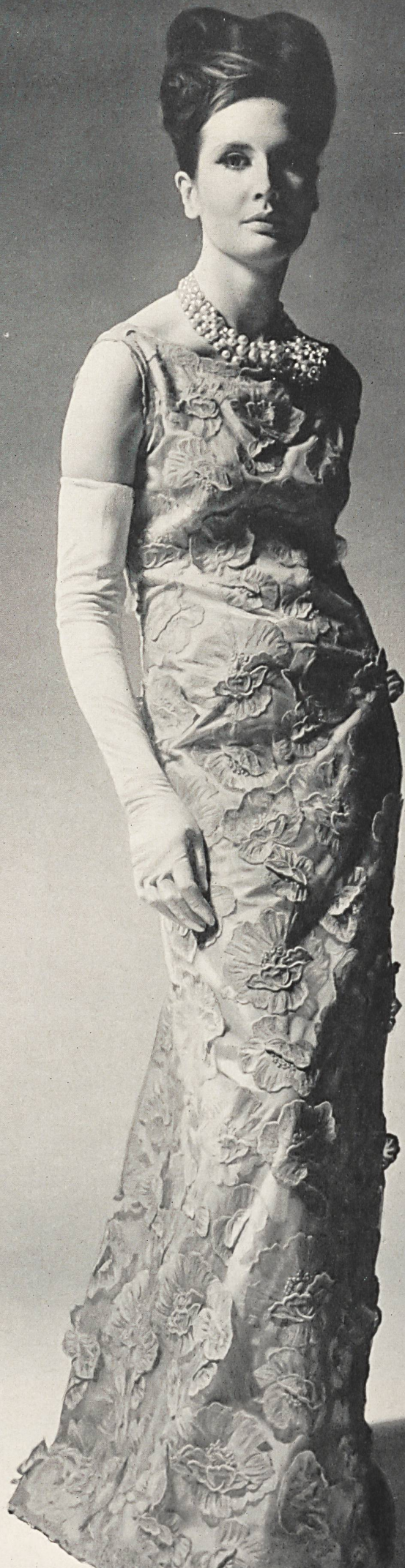
BALENCIAGA Photo Rév