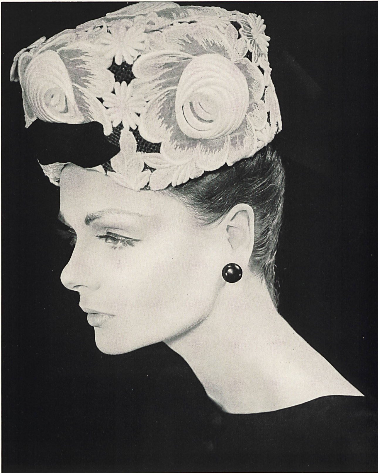
JEANNE LANVIN (DEVAUX) Galon d'organdi brodé à motifs superposés de A. Naef & Cie S.A., Flawil/Saint-Gall Grossiste à Paris : Robert Burg & Cie