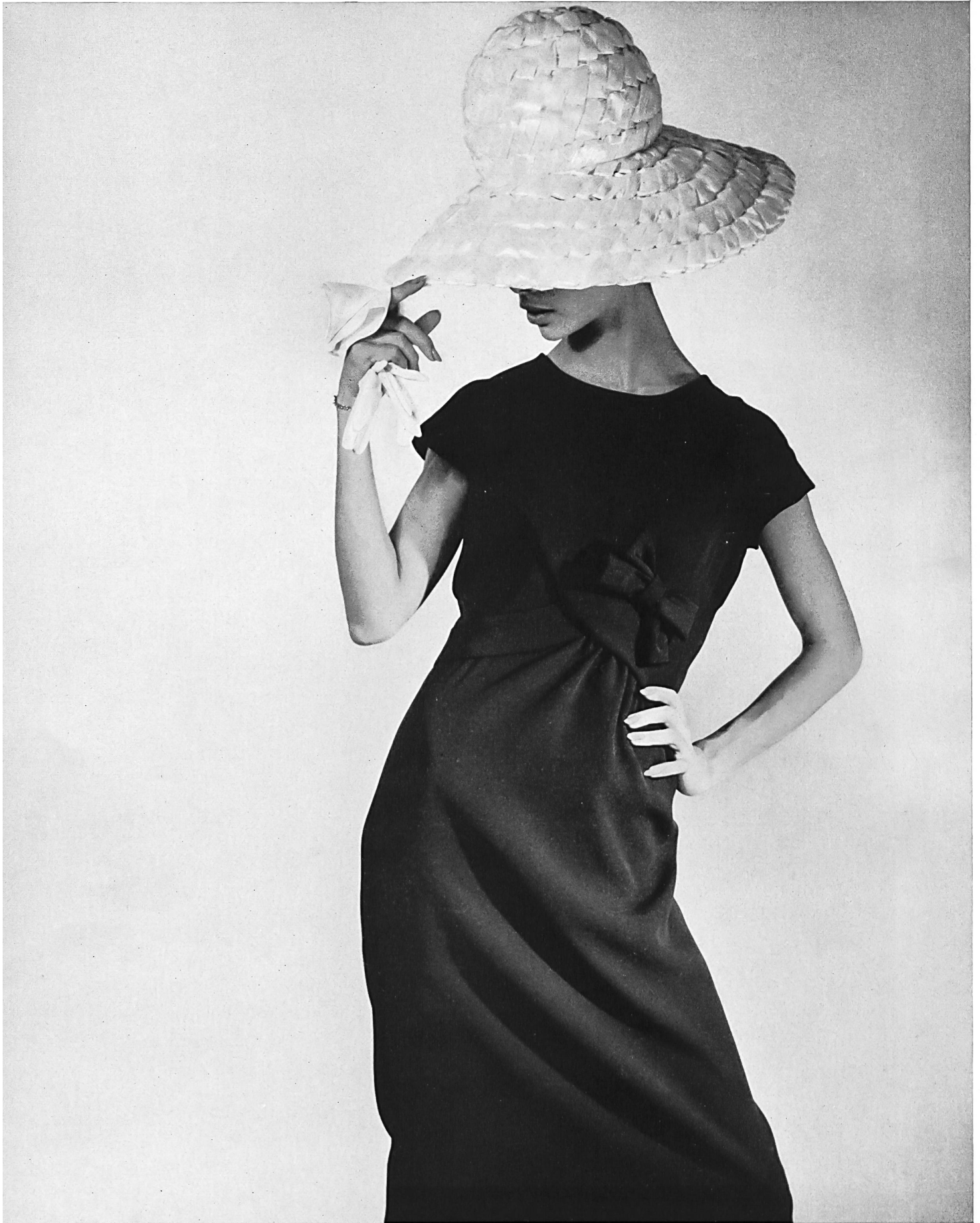
FERRERAS Crêpe « Sambora » de la S. A. Stünzi Fils, Horgen