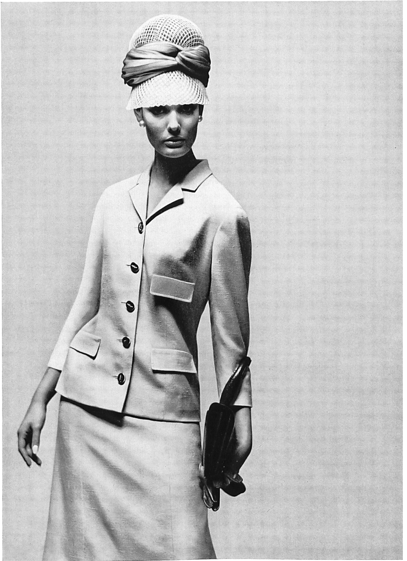
HERMES Pure soie « Sandra » de Robt. Schwarzenbach & Co., Thalwil