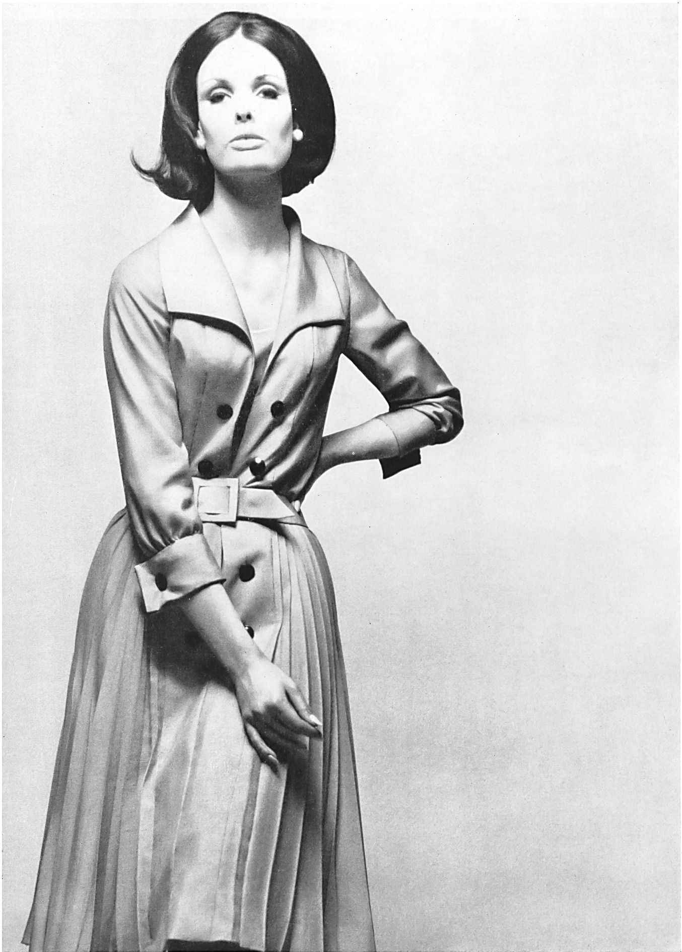
MAGGY ROUFF Pure soie « Tussahline » de Robt. Schwarzenbach & Co., Thalwil