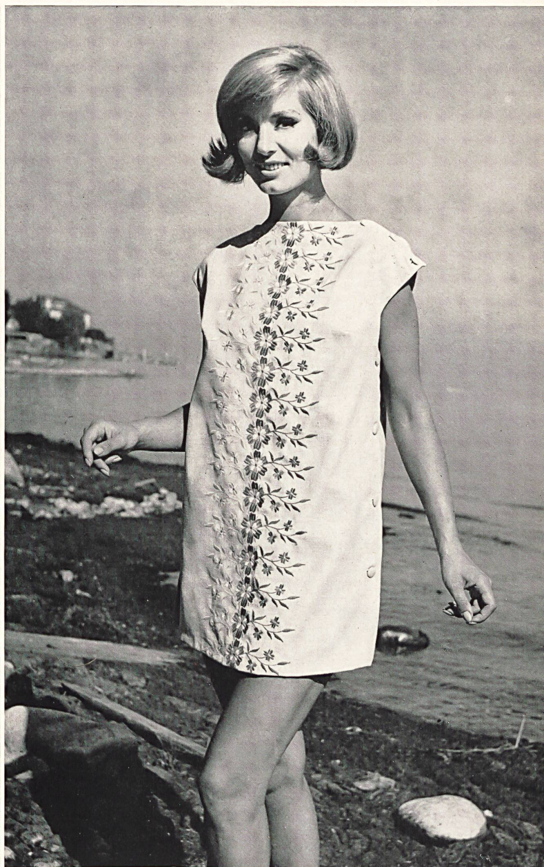
« RECO », REICHENBACH & CO. S.A., SAINT-GALL

Tissu brodé Cotolin mi-partie Cotolin mi-partie embroidered fabric Tejido bordado Cotolin mi-partie Cotolin mi-partie besticktes Gewebe