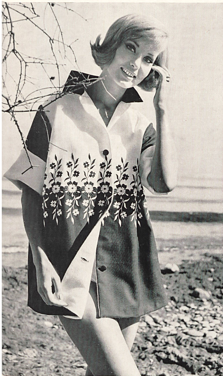
« RECO », REICHENBACH & CO. S.A., SAINT-GALL

Tissu brodé Cotolin mi-partie Cotolin mi-partie embroidered fabric Tejido bordado Cotolin mi-partie Cotolin mi-partie besticktes Gewebe