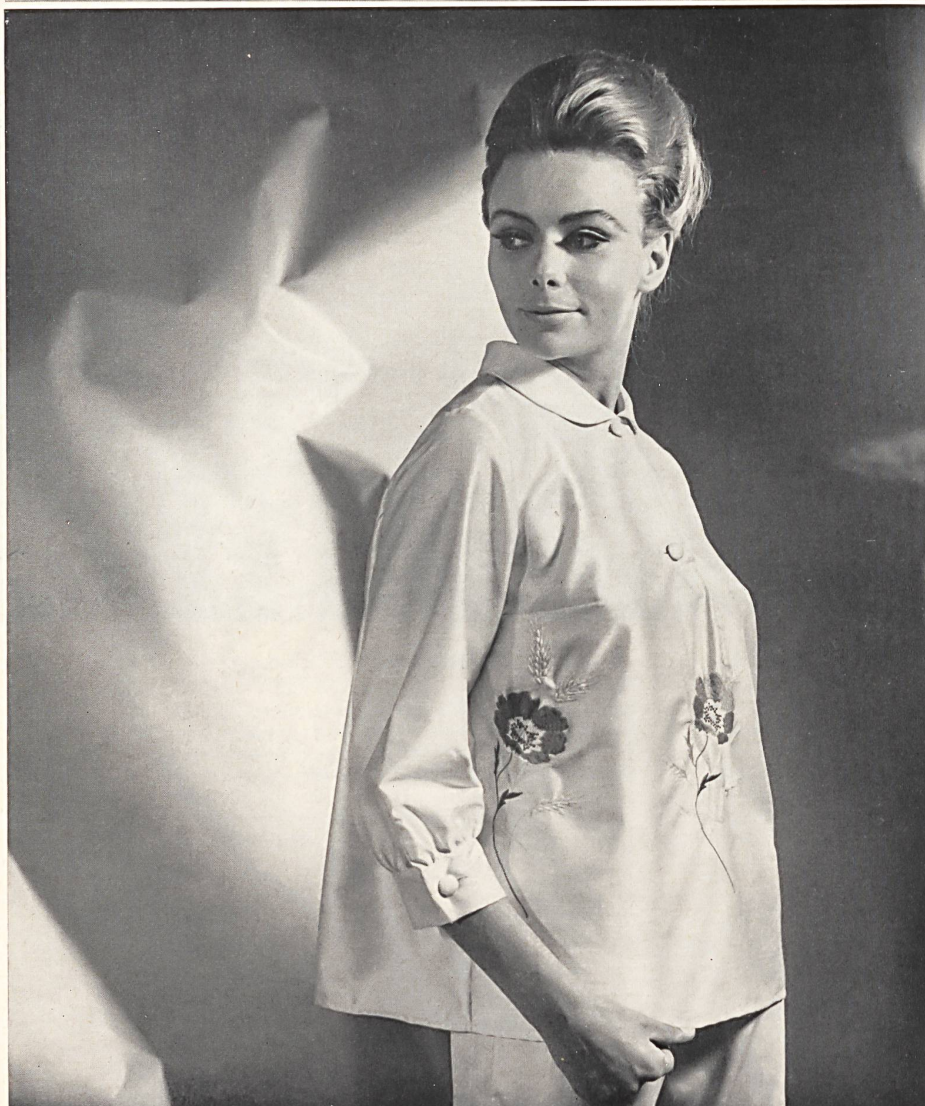
« Ban-Lon » — « Swiss Minicare » JOSEPH BANCROFT & SONS CO. AG., ZURICH