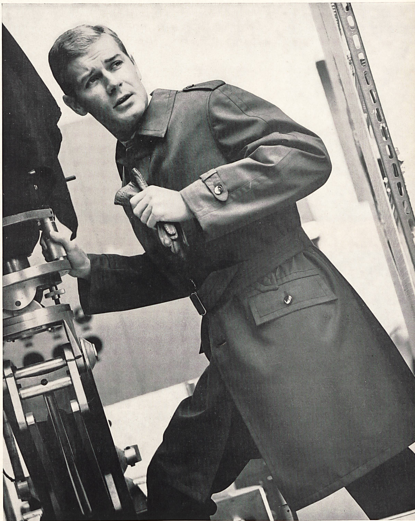
HAUSAMMANN TEXTILES S.A., WINTERTHUR « Osa-Atmic » tissu Diolène et coton — Diolen and cotton fabric — Tejido de Diolene y algodón — Diolen/Baumwoll-Gewebe Modèle « PKZ », Burger Kehl & Cie S.A., Zurich