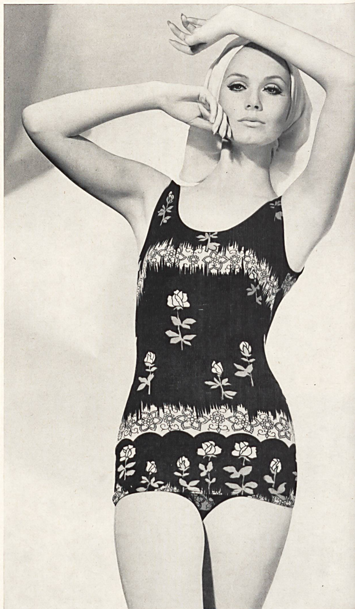
« ROBORO », J. F. ROHRER-BOLLIGER S.A., ROMANSHORN Maillot de bain en tricot « Helanca » avec dessin original imprimé « Helanca » swimsuit printed with an original design Bañador en « Helanca » con dibujo estampado original « Helanca » Badeanzug mit apartem Druckdessin