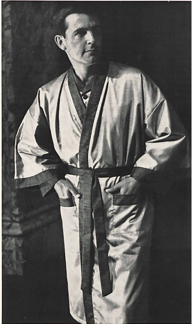
STOFFEL S.A., SAINT-GALL Satin pur coton avec envers à effet Honan Pure cotton satin with Honan effect on the back Modèle « Judogi » de/by Le Roi Menswear, Londres