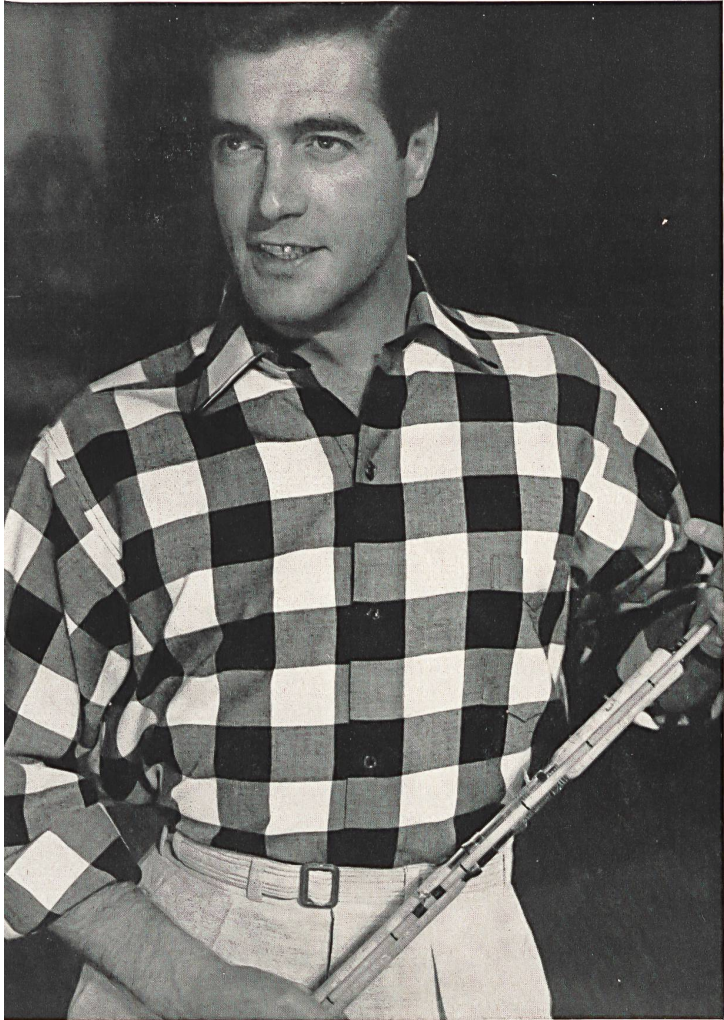
S.A. A. & R. MOOS, WEISSLINGEN « Lanella », tissu mi-laine pour chemises de sport « Lanella », half-wool fabric for sports shirts Modèle de/by: Tatler for Men, Londres