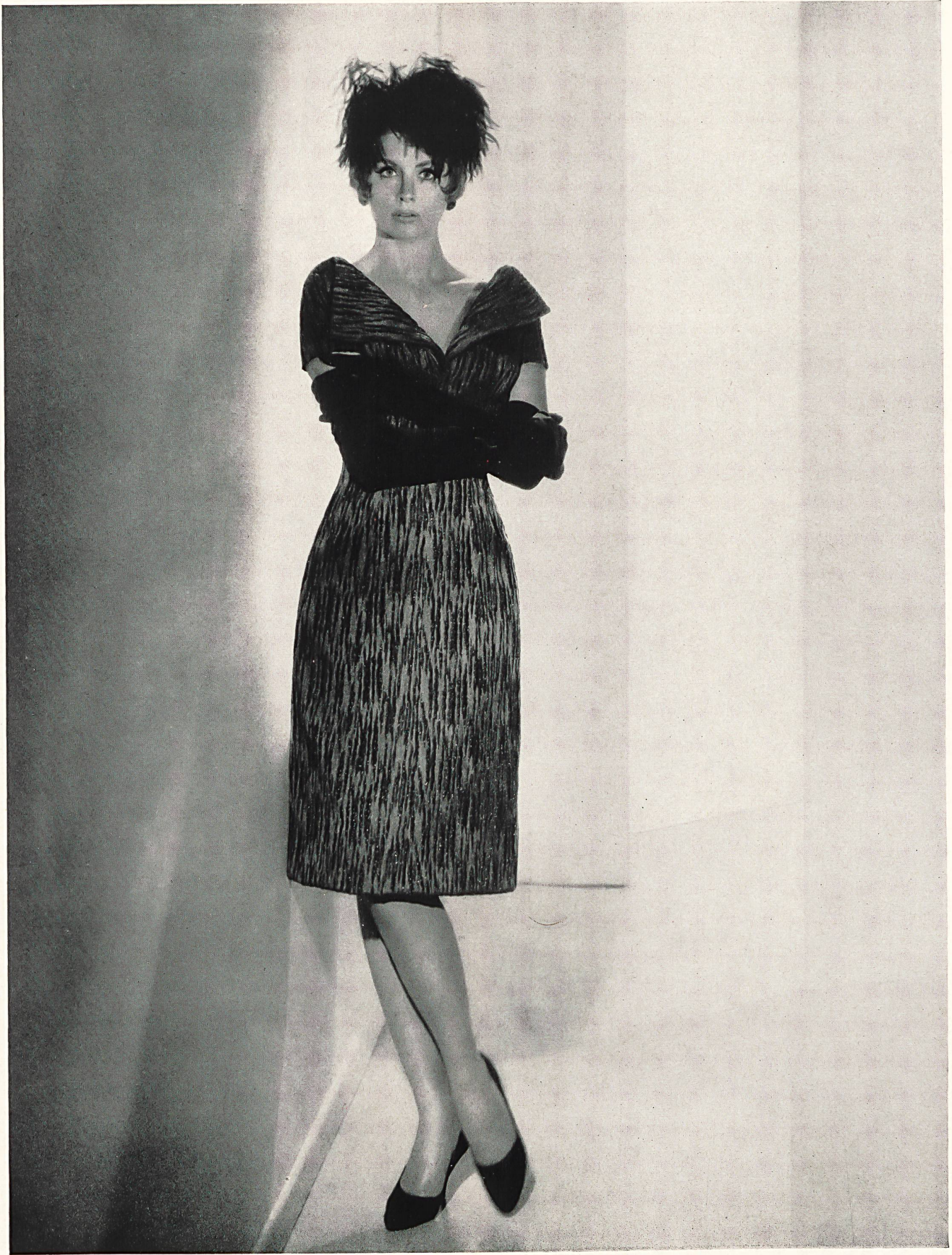
RUDOLF BRAUCHBAR & CIE S.A., ZURICH Tissu « Darling » fabric Modèle de/by: Helga, Los Angeles