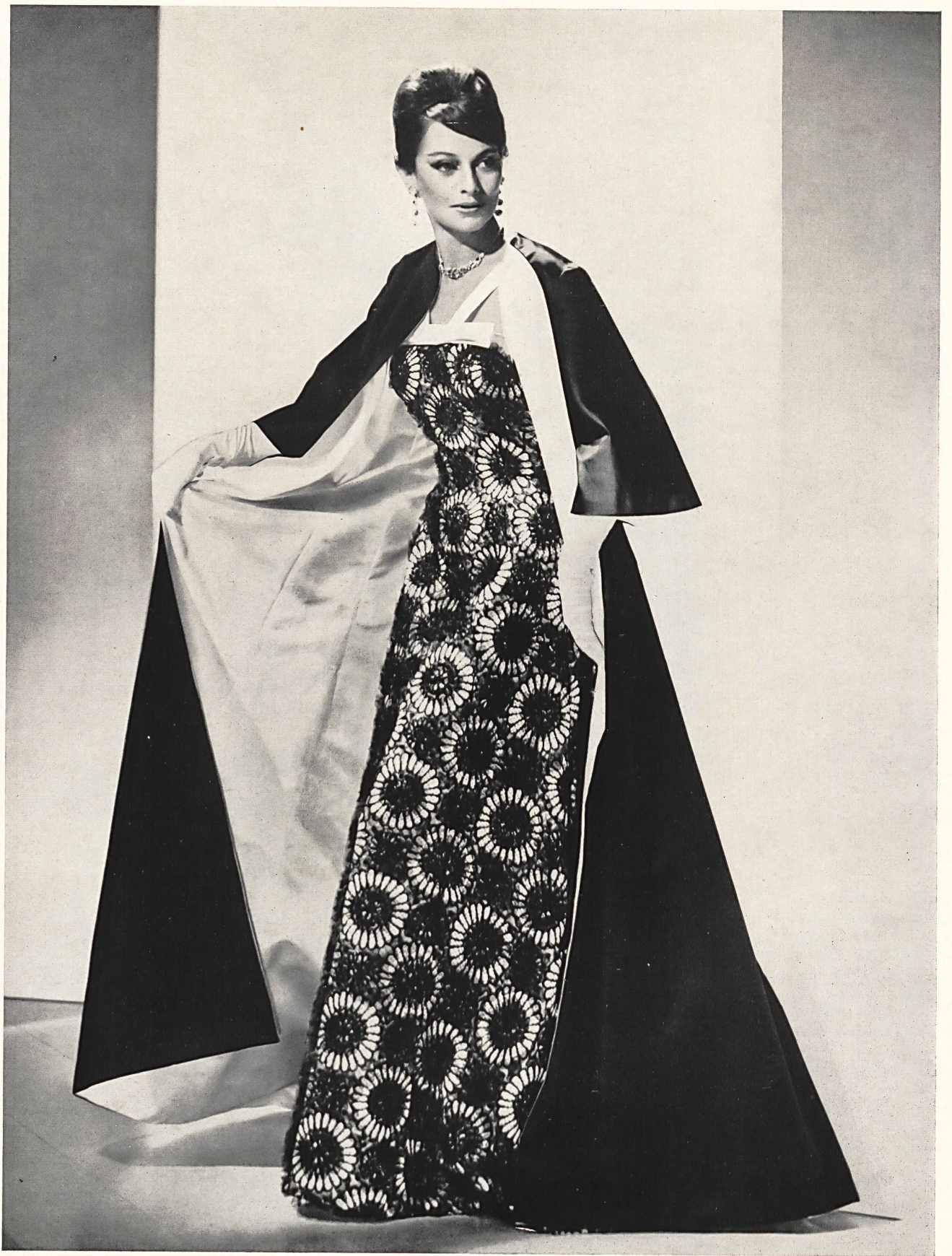
FORSTER WILLI & CO., SAINT-GALL Guipure noire rebrodée Black re-embroidered etched lace