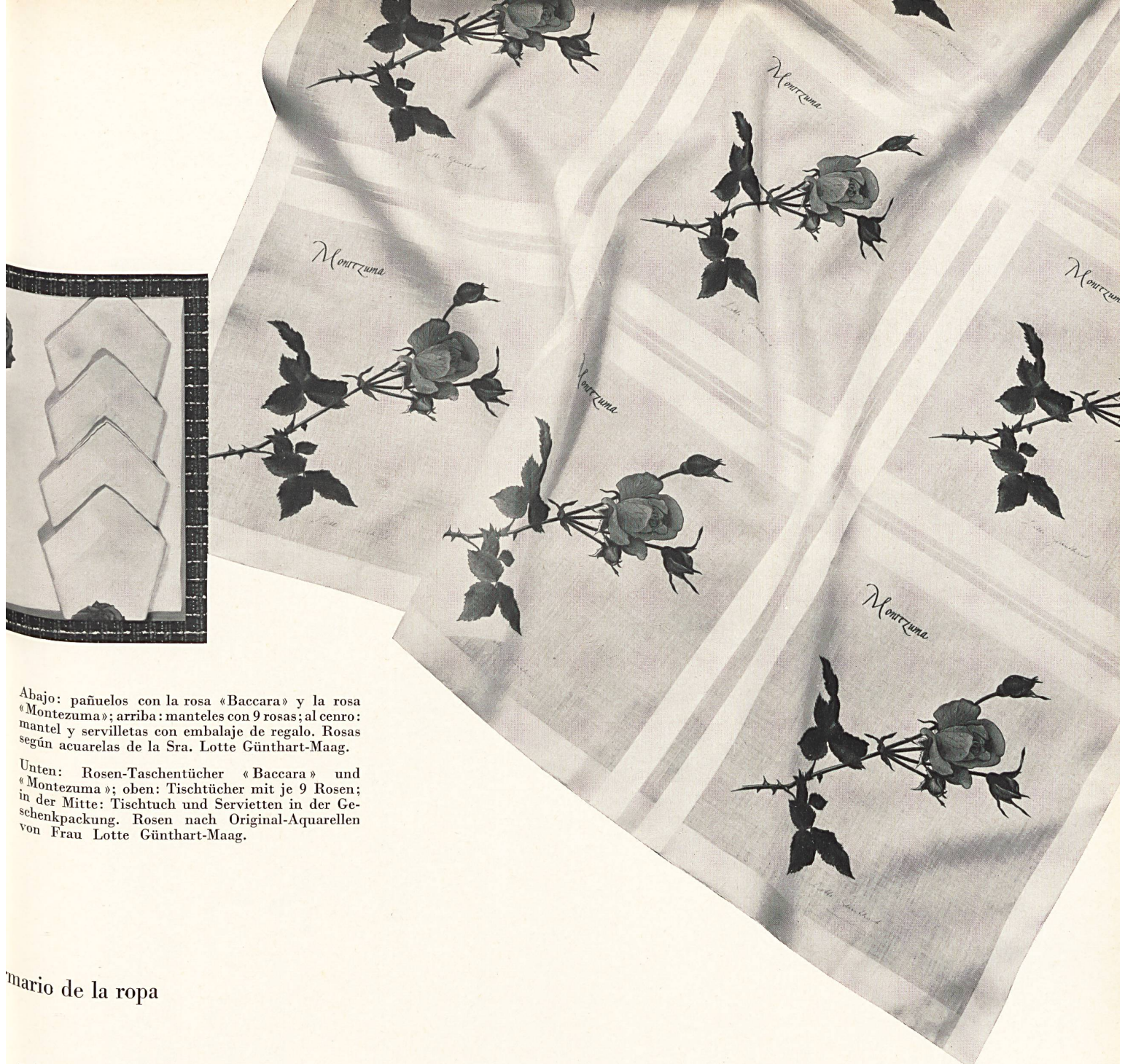
Abajo: pañuelos con la rosa «Baccara» y la rosa «Montezuma»; arriba: manteles con 9 rosas; al centro: mantel y servilletas con embalaje de regalo. Rosas según acuarelas de la Sra. Lotte Günthart-Maag.