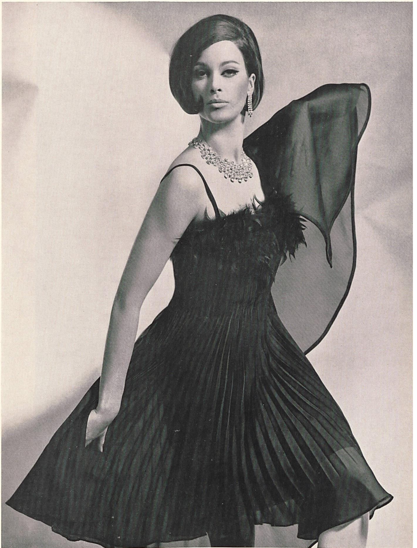
EUGEN BRAUNSCHWEIG S.A., ZURICH Robe de cocktail en plissé soleil avec plumes de marabout Sun-ray pleated cocktail dress with marabu feathers Vestido de coctél con plisado « soleil » y plumas de marabú Cocktaildress in « Plissé Soleil » mit Marabu-Federn