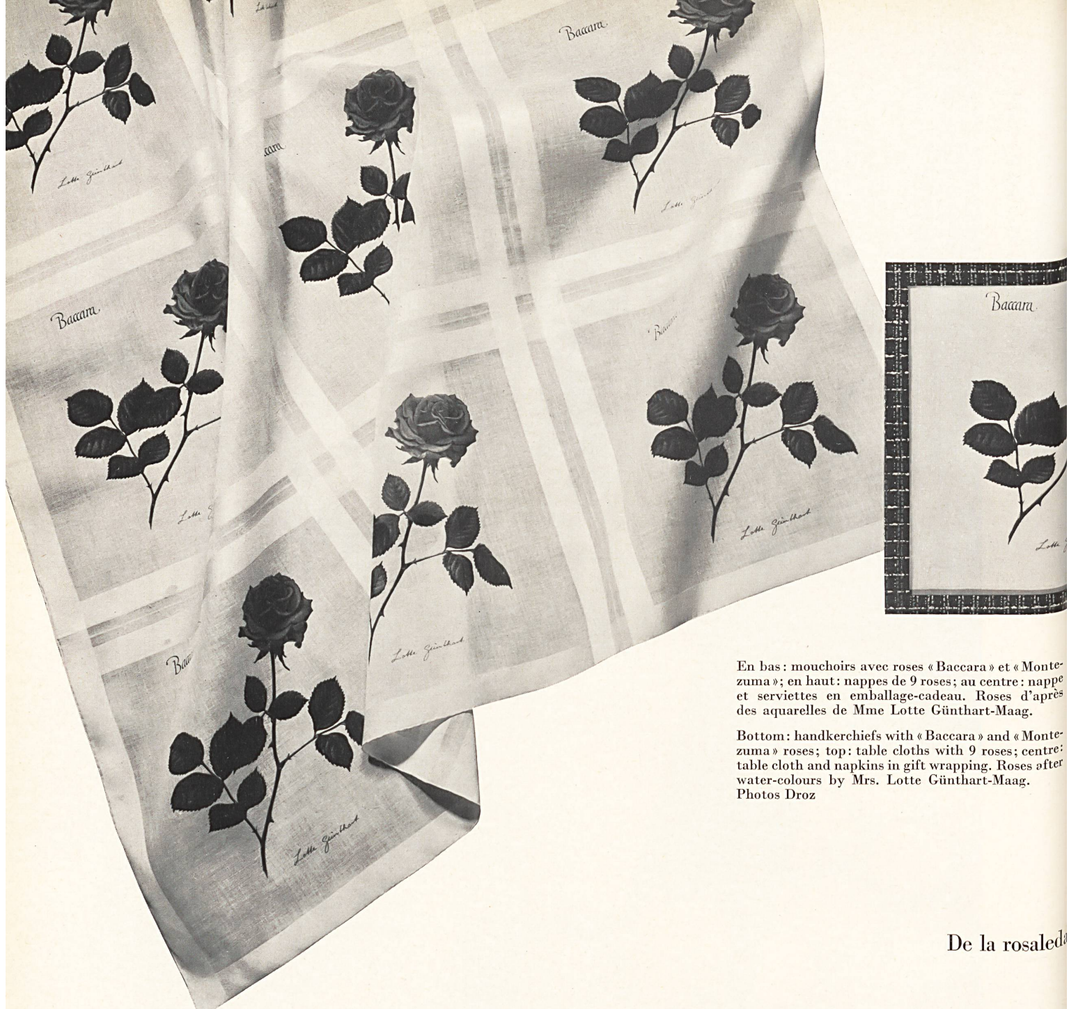
En bas : mouchoirs avec roses « Baccara » et « Montezuma »; en haut : nappes de 9 roses; au centre : nappe et serviettes en emballage-cadeau. Roses d'après des aquarelles de Mme Lotte Günthart-Maag.