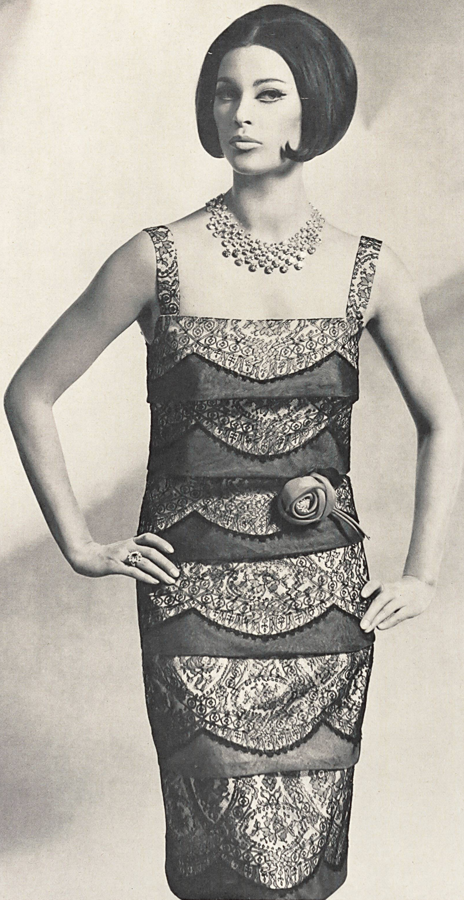
EUGEN BRAUNSCHWEIG S.A., ZURICH Robe de cocktail avec dentelle Chantilly Cocktail dress with Chantilly lace Vestido de coctél con encaje de Chantilly Cocktailkleid mit Chantilly-Spitze