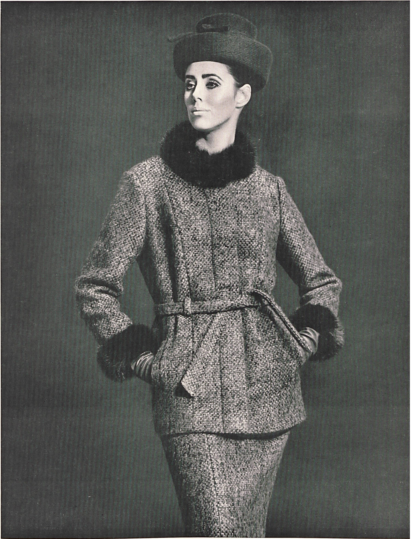
ARTHUR SCHIBLI S.A., GENÈVE