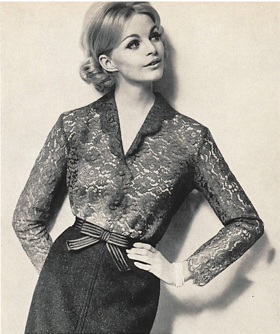
HAURY & CO. S.A., SAINT-GALL Blouse en dentelle rachel, jupe en lainage à effets de poils • Rachel lace blouse skirt in hairy woollen fabric • Bluse aus Raschelspitze; Jupe aus Wolle mit Stichel haaren