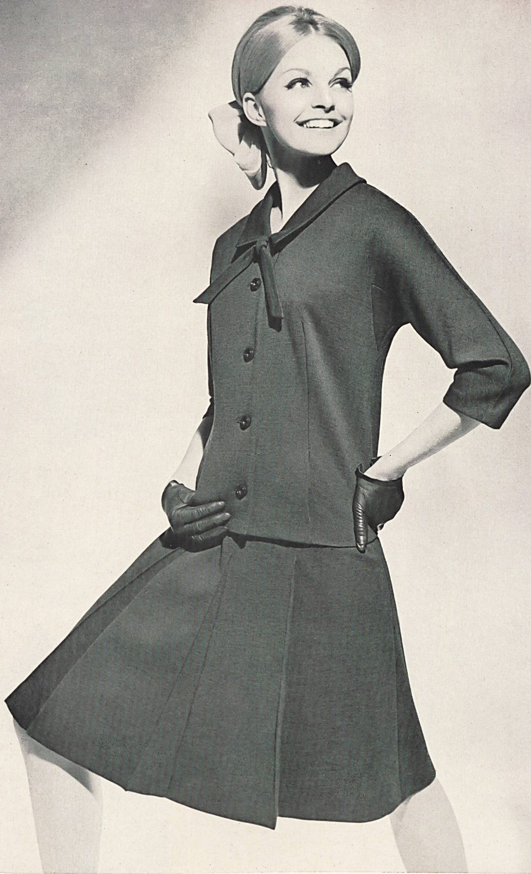
« HÉRISA », HÉRISA S.A., HÉRISAU Tricots mode • Fashionable knitted goods • Modische Strickwaren