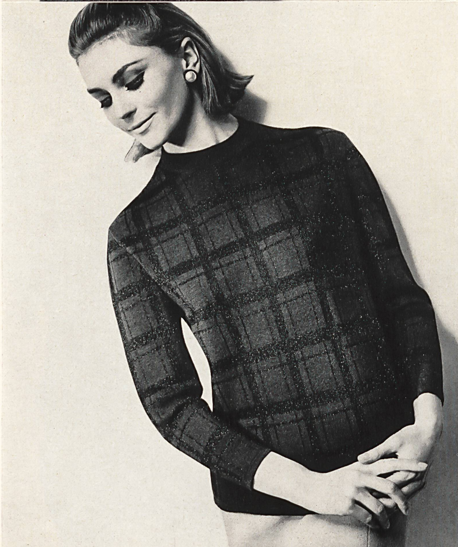
« PRIORA », JOH. LAIB & CIE S.A. AMRISWIL Fabrique de bonneterie • Knitwear Manufacturers • Strick- und Wirkwaren fabrik