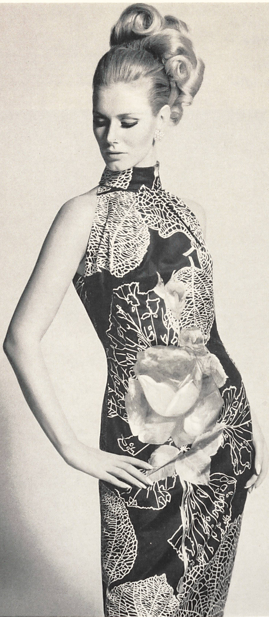
RIBA SOIERIES S.A. ZURICH Tissu « Papillon » Modèle: Gack, Zurich