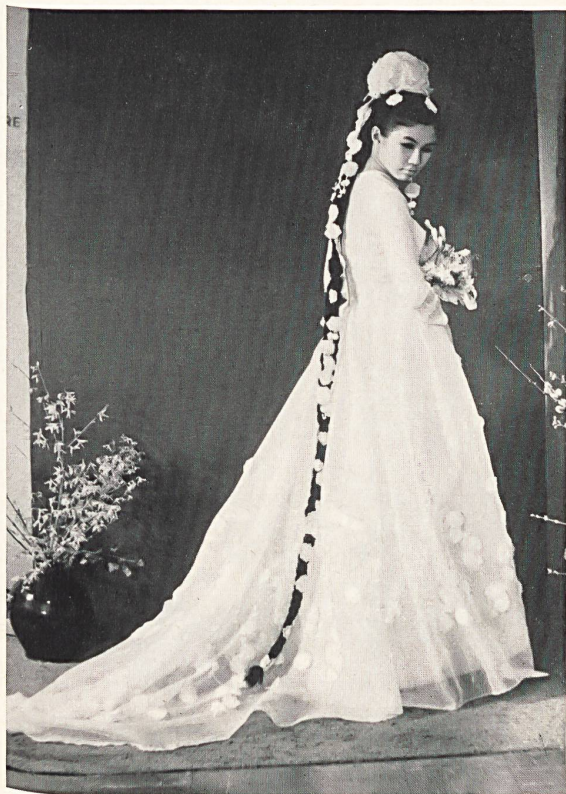
Vestido de boda, primer premio, Escuela de Modas de Kingston (Surrey); trenza adornada con aplicaciones de bordado