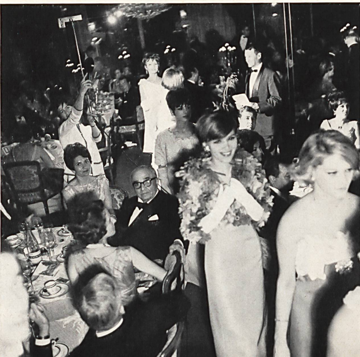
El final del desfile, durante la cena de gala.

Añadiremos que un programa muy detallado y muy bien presentado informaba a los participantes a estos acontecimientos sobre las distintas industrias suizas cuyo concurso se había asegurado la Cámara de Comercio Suiza en Francia — a la que hemos de felicitar por la excelente organización y el buen éxito alcanzado.