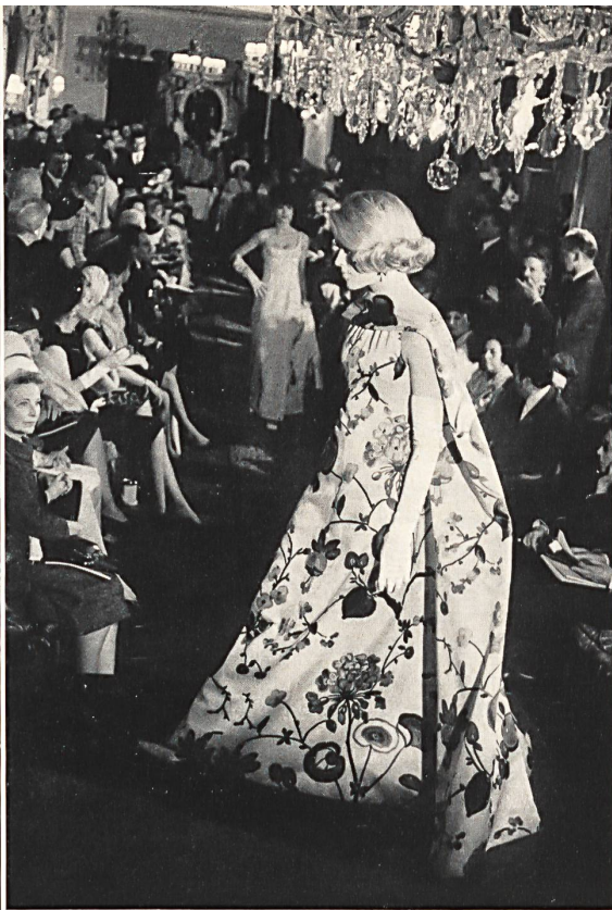
A la izquierda, modelo Cardin, de organza estampado de Abraham — A la derecha, modelo de Nina Ricci, de bordado de San Galo.